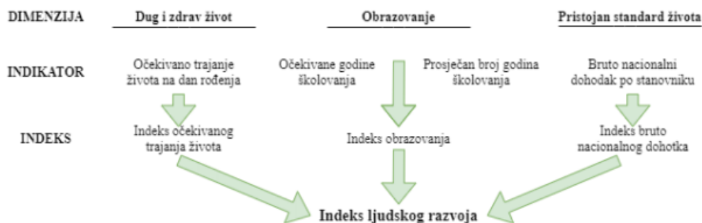
Slika 1; Determinante Indeksa ljudskog razvoja

Ivan Stojaković: Utjecaj javnih politika na privatno poduzetništvo u Republici Hrvatskoj (specijalistički diplomski rad)