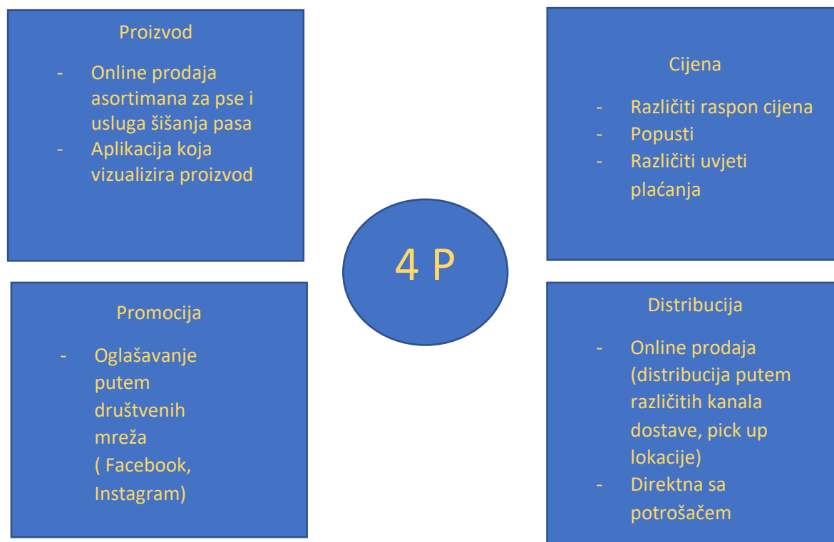
Tablica 2 Marketinški miks ili splet poduzeća „Visulize me“