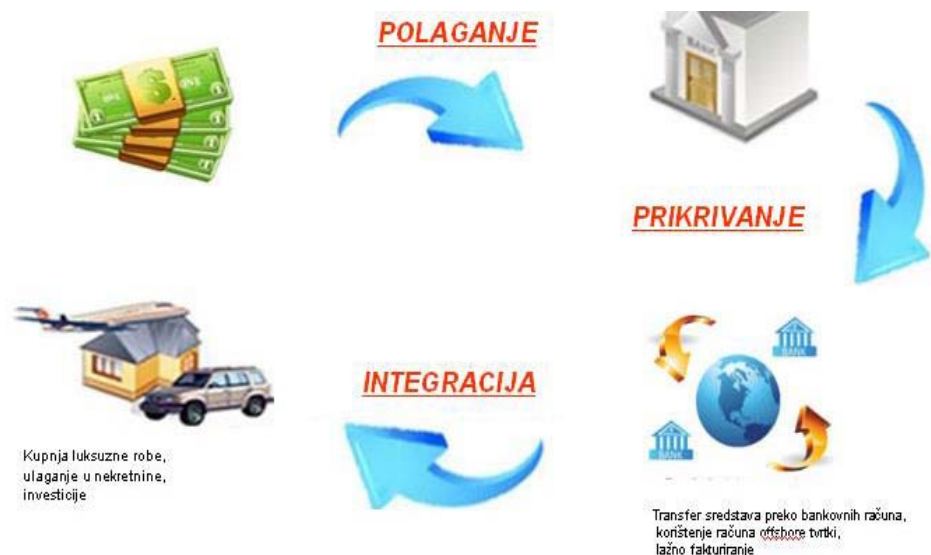
Slika 1 Prikaz tri temeljne faze pranja novca

Navedene faze predmetnog procesa mogu biti posve odvojene, no isto tako ovisno o okolnostima one se mogu odvijati u isto vrijeme, te može doći i do preklapanja.