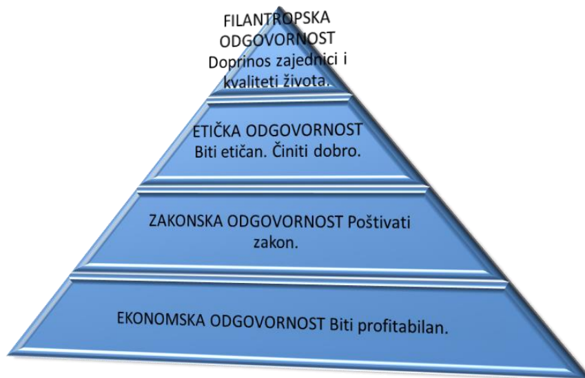
Slika 1 vlastita izrada prema Marin Buble, Management, Ekonomski fakultet Sveučilišta u Splitu, Split, 2000., str. 104

Društveno odgovorno poslovanje svoju popularnost doseže 1991. godine nastankom „ Piramide društveno odgovornog poslovanja “ Archieja B. Carrola, autora Poslovnog upravljanja .