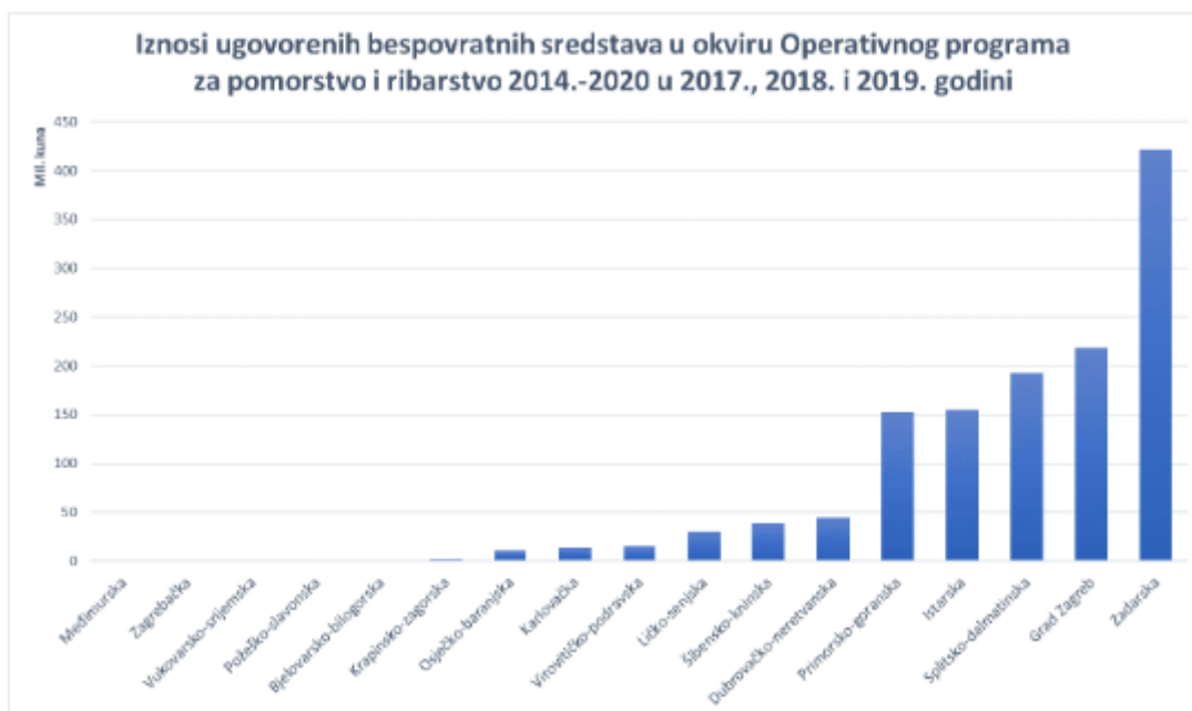
Slika 9 Iznosi u okviru OPRR