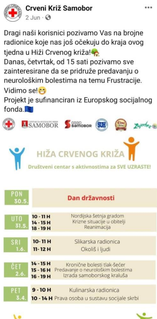
Slika 10. PR projekta kroz objave na društvenim mrežama