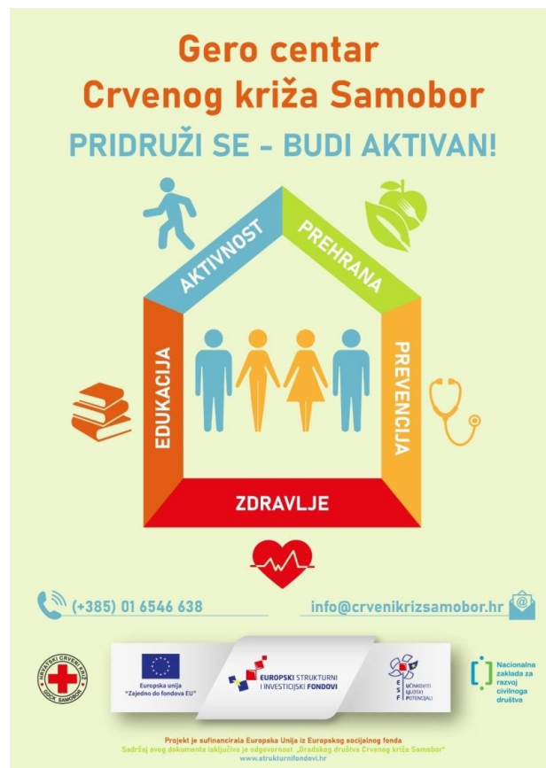
Slika 7. Plakat projekta Gero centar Crvenog križa Samobor