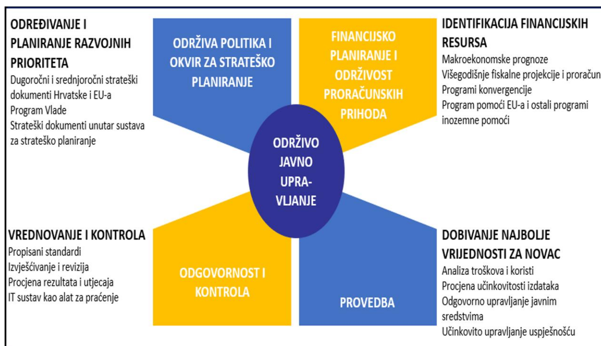
Slika 1. Očekivani učinci uspostave sustava strateškog planiranja

Strateško planiranje svoje početke nalazi u privatnom sektoru, ali isto tako treba se provoditi na lokalnoj, regionalnoj i nacionalnoj razini jer predstavlja ključni dio uspješnog upravljanja i ciljnog razvoja javnog sektora, a na kraju i položaja i stanja u državi. 2