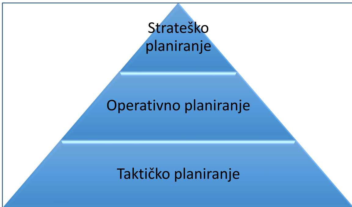
Slika 1. Hijerarhijska razina s obzirom na mjeru operacionalnosti 2

Kao što je vidljivo na slici, na vrhu je strateško planiranje, to jest viši menadžment. Razina ispod je srednji menadžment, to jest operativno planiranje. Najniža razina planiranja bavi se kratkoročnim planiranjem – iz tjedna u tjedan, mjeseca u mjesec i pokriva ga taktičko planiranje.