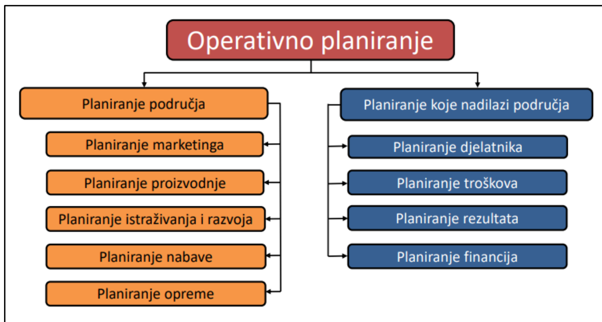
Slika 2. Struktura operativnog plana (Osmanagić Bedenik, 2002:103.)

Plan marketinga dalje uključuje plan prodaje, plan mjera marketinga, plan troškova marketinga i plan prometa. Plan prodaje dio je poslovnog plana poduzeća koji služi za dokumentaciju politike prodaje za naredno razdoblje. (Erhmann, 1999:263) - plan prodaje odgovara na sljedeća pitanja: