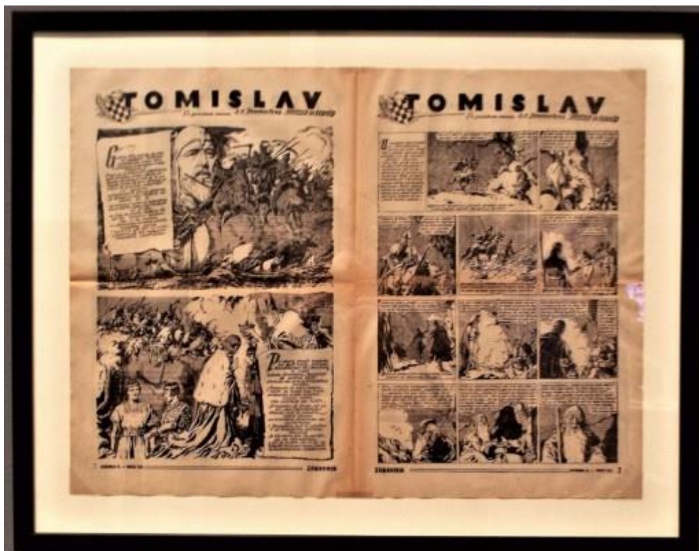
Slika 3. Maurovićev povijesni strip „Tomislav“