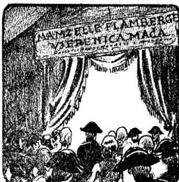
244. Najveća senzacija velikog sajma St. Germaine u Parisu bila je mamzelle Flamberge, djevojka nepobjediva na maču...