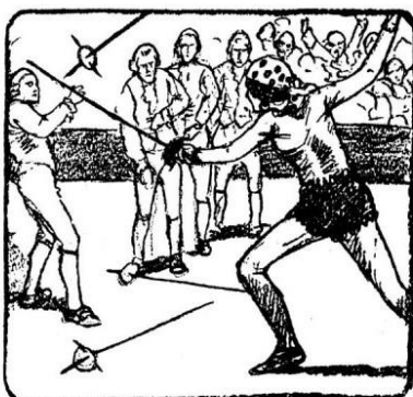
247. Dolazili su građani, mušketiri i plemići, da se s njom ogledaju u maču. Ali vjerenica mača ostala je nepobjediva i svakom je izbila mač iz ruke.