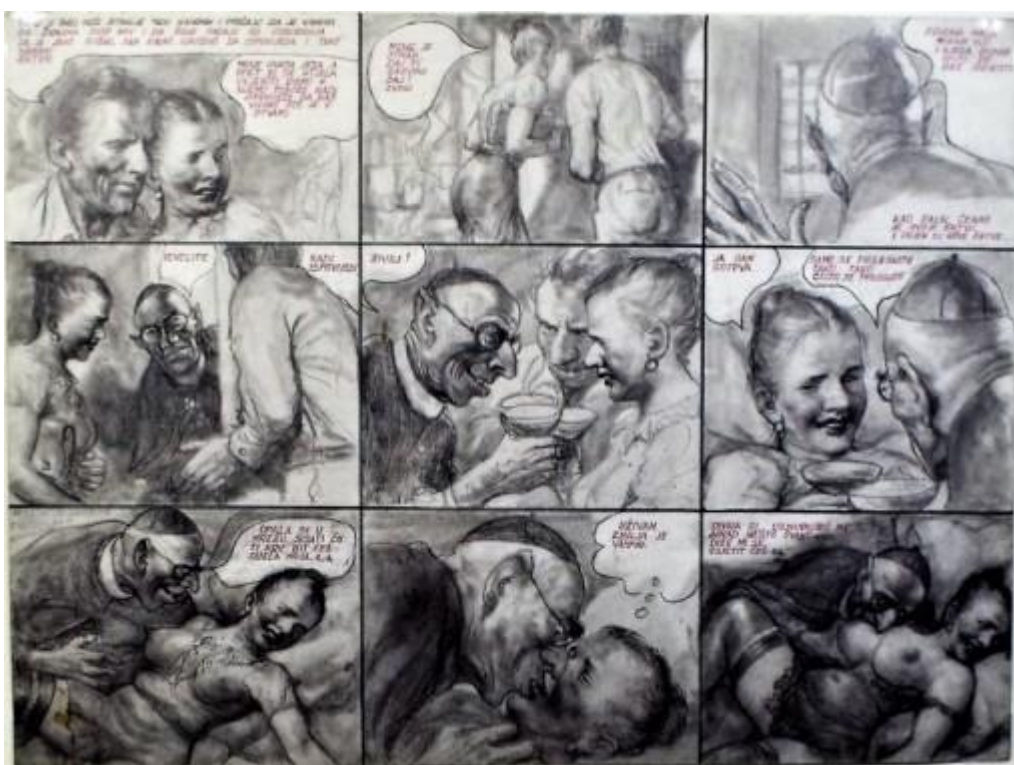
Slika 5. Maurovićeva pornografska zbirka „Kandal“

Andrija Maurović se na zalazu života okrenuo stvaranju pornografskog stripa, što je definitivno obilježilo njegovu strip karijeru. Erotskih stripova je bilo i prije Andrije, međutim, mnogi likovnjaci su se složili da se nijedno od njih likovnom kvalitetom ne može mjeriti s Maurovićevim erotskim crtežima. Maurović se crtanjem erotike i pornografije počeo baviti prije Drugog svjetskog rata, kada je po narudžbi crtao seriju pornografskih razglednica. Teme su, primjerice bile udana mlada žena iz visokog društva i vozač koji koriste priliku tijekom duge noćne vožnje. Teško je reći gdje se danas nalaze te razglednice jer se Maurović uvijek nemarno odnosio prema svojim djelima.