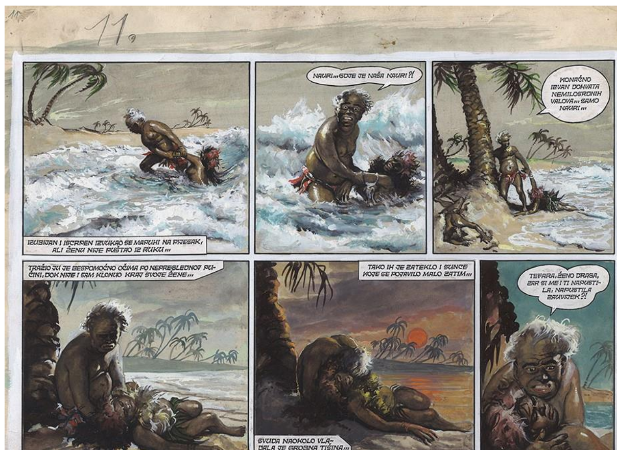
Slika 4. Strip u boji „Biser zla“

Prvi broj „Plavoga vjesnika“, poznat i kao „Plavac“, najdugovječnije publikacije u povijesti hrvatskoga stripa, izišao je 1954. godine, a njegov je podnaslov glasio „Tjednik za pouku, zabavu i razonodu“. U punih dvadeset godina, izišlo je 970 brojeva, a povijest stripa podijelila se na razdoblje prije i poslije „Plavoga vjesnika.“