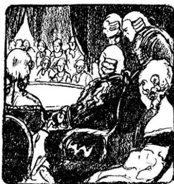
248. Slava gospođice Flamberge proćula se po cijelom Parisu. Na kraju je došao i sam kralj s cijelim svojim dvorom, da se uvjeri o njezinoj vještini.