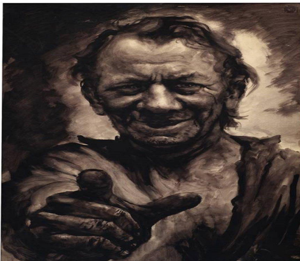
Slika 2. Maurovićev autoportret, 1970-ih, Zbirka Novaković

Andriji Mauroviću definitivno je godilo saznanje da toliko ljudi prati njegov rad te što je preko stripa postao poznat i omiljen. Činjenica je da je još za života postao legendom, međutim, većina njegovih pratitelja složiti će se da Andrija nikad nije bio svjestan svog stvaralačkog ega i činjenice da spada među desetak najvećih stvaralaca u povijesti svjetskoga stripa. Nikada nije pristajao da se njegov rad na strip odvoja i smatra važnijim od ostalih vrsta njegova likovnog djelovanja, pa i „čistog slikarstva“ kojemu se vratio u posljednjim godinama života. Koliki je velik bio njegov utjecaj na razvoj stripa u Hrvatskoj, ali i šire govori i impozantan broj djela, stvaran tijekom tridesetak godina njegove bogate karijere.