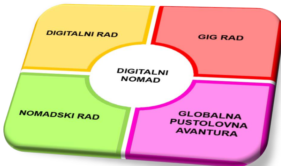
Graf 1. Elementi u radu digitalnih nomada

Rad svakog digitalnog nomada sastoji se od četiri vrlo bitna elementa prikazana u sljedećem slikovnom prikazu, a sastoji se od digitalnog rada, gig rada, nomadskog rada i globalne pustolovne avanture.