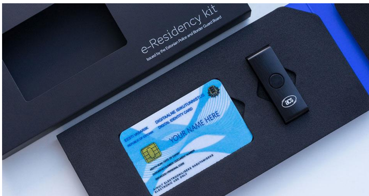
Slika 1. Estonska viza za digitalne nomade

U nekim zemljama postoji i specifična kategorija viza namijenjena digitalnim nomadima, koje omogućuju legalni boravak i rad na određenom području za određeno vrijeme. Estonija i Portugal su neke od zemalja koje su uvele vize za digitalne nomade. Za podnošenje zahtjeva za vizu u Estoniji potrebno je dokazati da ste u proteklih šest mjeseci ostvarivali zaradu od približno 3.000 Funti mjesečno, dok se za podnošenje zahtjeva za vizu u Portugalu traži da se dokaže zarada od 2.800 EUR mjesečno.