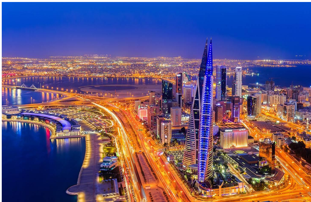
Slika 5. Bahrein