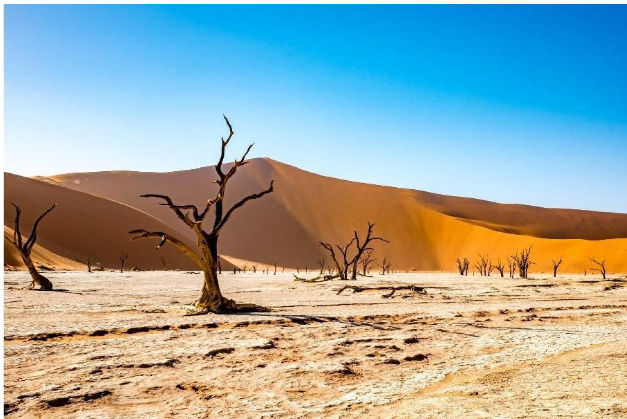
Slika 4. Namibija