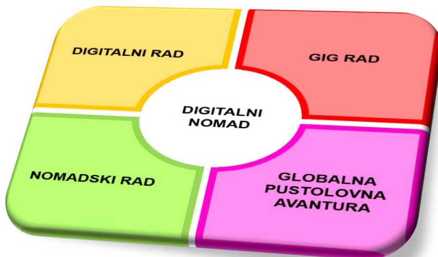
Graf 1. Elementi u radu digitalnih nomada

Rad svakog digitalnog nomada sastoji se od četiri vrlo bitna elementa prikazana u sljedećem slikovnom prikazu, a sastoji se od digitalnog rada, gig rada, nomadskog rada i globalne pustolovne avanture.