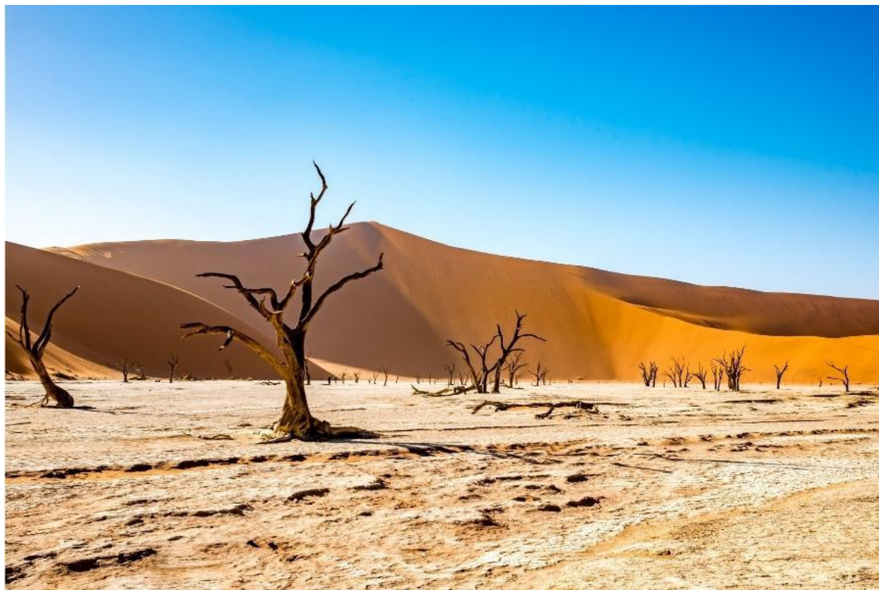
Slika 4. Namibija