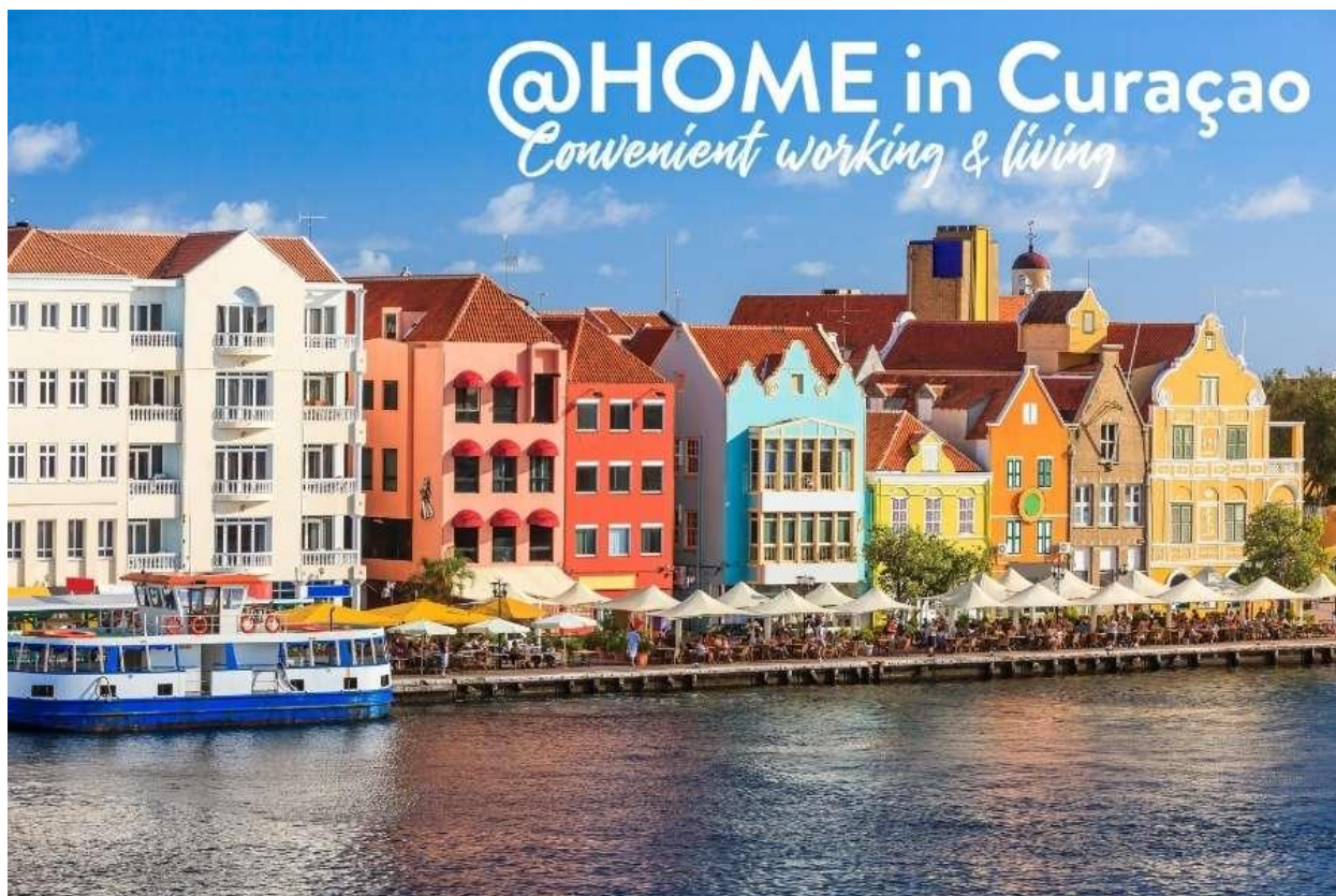
Slika 3. Curacao