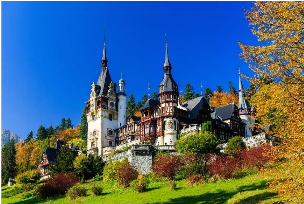
Slika 2. Rumunjska