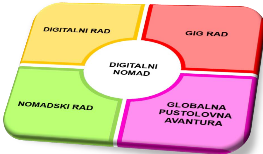
Graf 1. Elementi u radu digitalnih nomada

Rad svakog digitalnog nomada sastoji se od četiri vrlo bitna elementa prikazana u sljedećem slikovnom prikazu, a sastoji se od digitalnog rada, gig rada, nomadskog rada i globalne pustolovne avanture.