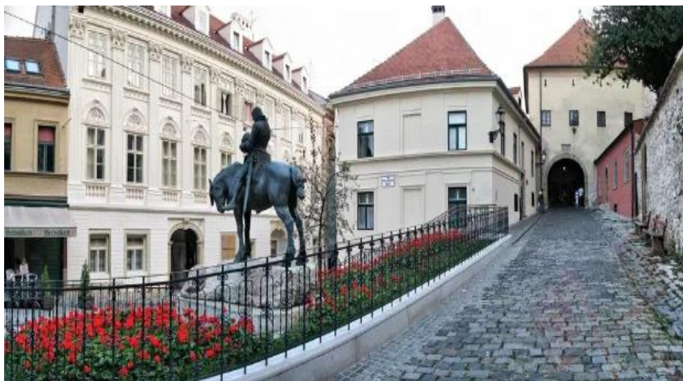
Slika 10. Kamenita vrata

Udovica je razumjela da slika pripada gradu, a ne samo njoj. Izvadila je zlatnike iz skrovišta, podigla oltar pod svodom Kamenitih vrata i postavila na njega sliku Djevice Marije s djetetom (Hitrec, 2007).