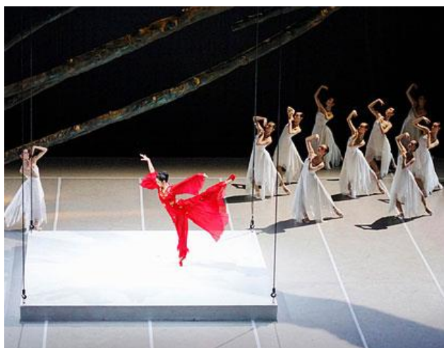
Slika 6. Žene Troje

Festival je osnovan 1947. godine kao inicijativa za obnavljanje kulture i umjetnosti nakon Drugog svjetskog rata. Cilj mu je promovirati umjetnost u različitim oblicima, uključujući kazalište, glazbu, ples, operu, književnost i vizualne umjetnosti. Najpoznatiji segment festivala je Edinburški festival umjetnosti, koji se fokusira na kazalište, glazbu, ples i operu. Ovogodišnje izdanje (2023.) kao i mnoga prijašnja posvećeno je mitovima i legendama 16