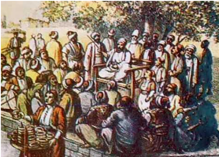
Slika 2. Meddah

Povijesno gledano, meddah-i su imali zadaću prosvjetljivati, educirati i zabavljati svoju publiku. Izvedeći predstave u karavansarajima, tržnicama, kavanama, džamijama i crkvama, ovi pripovjedači su prenosili vrijednosti i ideje među uglavnom nepismenom populacijom. Njihova društvena i politička kritika često je poticala živahne rasprave o suvremenim pitanjima.