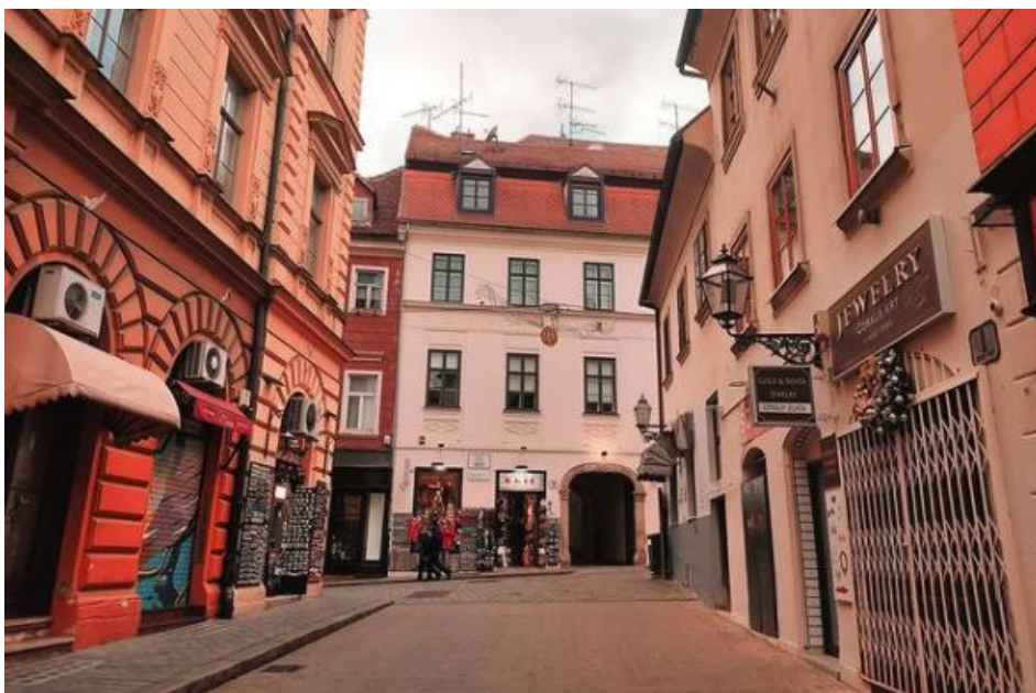
Slika 9. Krvavi most danas