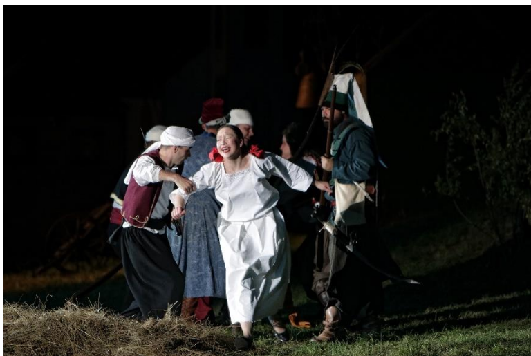
Slika 5. Picokijada