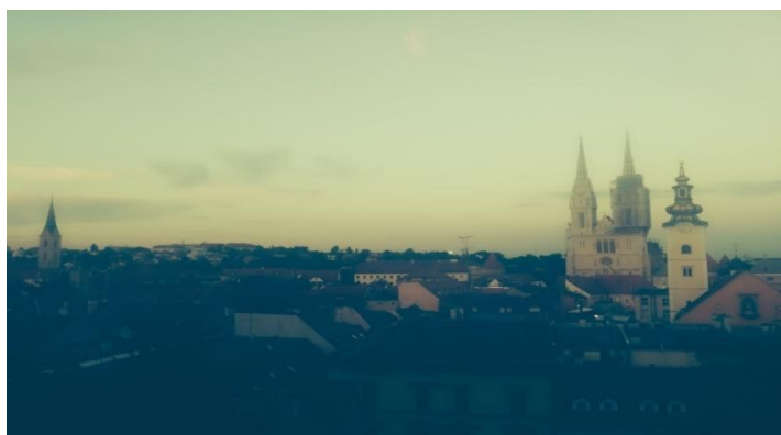
Slika 7. Pogled s gornjeg grada

Bogata materijalna baština uz sebe veže elemente nematerijalne baštine koji se prenose kroz književna i umjetnička djela. Neki od simbola grada Zagreba su: Katedrala Marijina Uznesenja, poznata kao Zagrebačka katedrala, Gornji grad, smješten na brdu Gradec, predstavlja povijesno središte grada Zagreba i mjesto legendi. Ovdje se nalazi kula Lotrščak, Strossmayerovo šetalište, Kamenita vrata, Markov trg te mnoge druge povijesne znamenitosti. Trg bana Josipa Jelačića je centralni trg u Zagrebu nazvan po bana Josipu Jelačiću, vođi u borbi za autonomiju Hrvatske. Trg je omiljeno mjesto okupljanja građana, a na središnjem dijelu trga nalazi se spomenik banu Jelačiću te Manduševac.