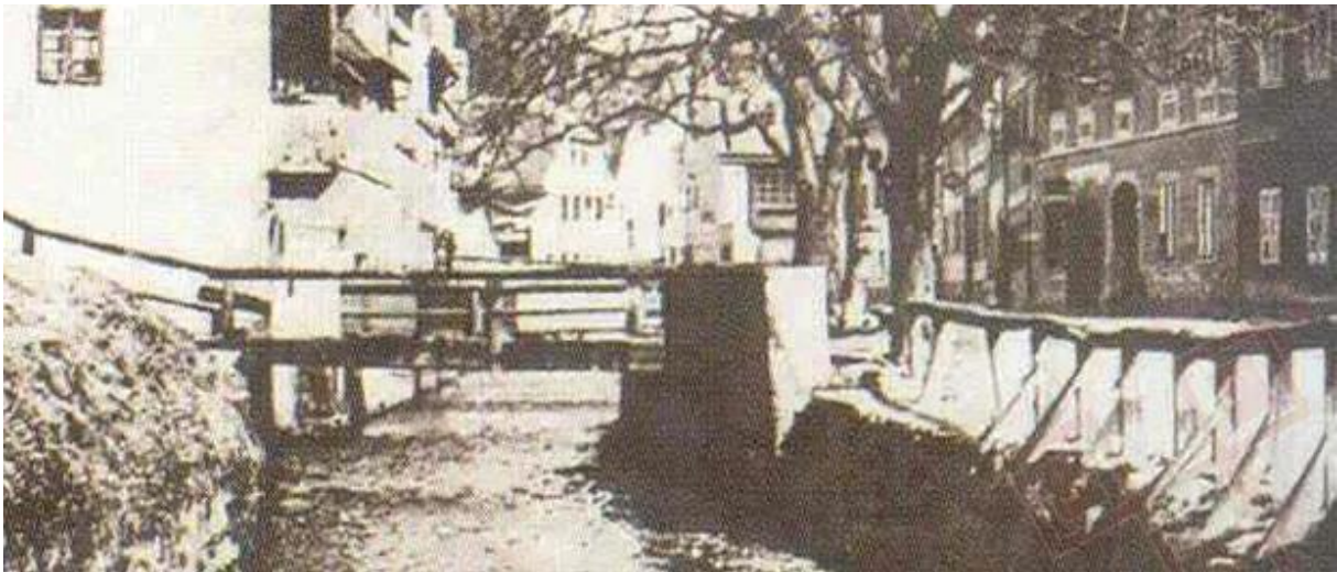
Slika 8. Pisani most

Na propovjedaonici stajao je opat Petar koji je pred narodom i optuženicima govorio o njihovoj budućnosti u paklu. Opat je naredio da Klara i Lovro budu gurnuti ispod njegovih nogu, ispod propovjedaonice. Njegove riječi bile su tako razorne da su ljubavnici doslovno izgorjeli do kosti (Hitrec, 2007).