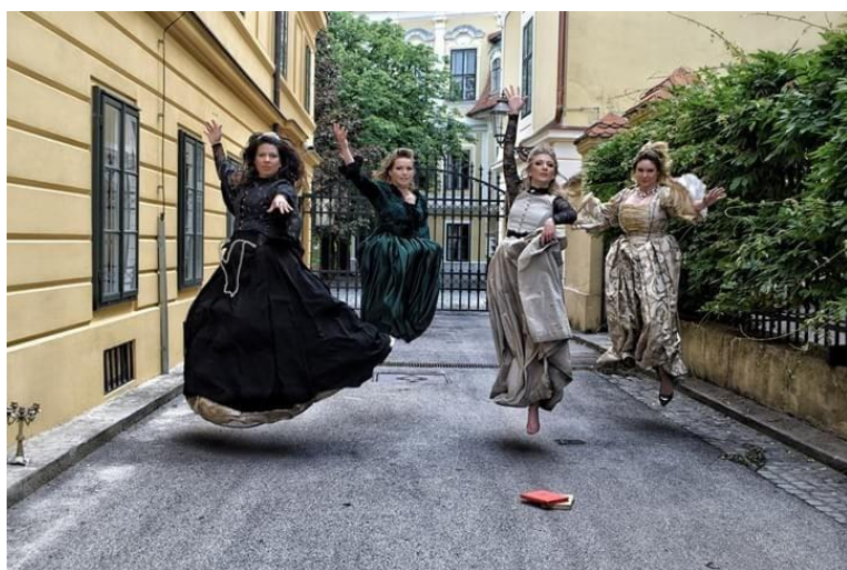
Slika 11. Gornjogradske coprnice

Gornjogradske čarolije su iznimno uspješan projekt male tvrtke Omnes artes d.o.o., koja se bavi izvedbenom umjetnošću. Slogan tvrtke sadržan je u samom nazivu i predstavlja raznolikost svih umijeća koje najbolje prikazuju projekti poput Gornjogradskih čarolija, Iz Zagorkina pera i najnovijih Neznanih junakinja. Projekt Gornjogradske čarolije postoji od 2013. godine, a počeci su bili skromni. Ideju je pokrenula tvrtka Omnes artes uz podršku Muzeja grada Zagreba i Turističke zajednice grada Zagreba. U početku su obilasci održavani tijekom dana, bez raskošnih kostima i glumaca. Međutim, od samih početaka su se trudili ponuditi nešto više, pa je obilazak završavao u Muzeju grada Zagreba s posjetom izložbi vezanoj uz progon vještica te kreativnom radionicom u muzeju. Od prvih sezona stavljali su naglasak na posjetitelje i na načine kako obogatiti njihovo iskustvo, pa su pored poklona za sudionike, uveli i posudbu vještičjih šešira u tijeku trajanja obilaska, kako bi ih što više uključili u priču. Uvođenjem likova, također se otvorio novi prostor za interakciju posjetitelja s glumcima. 23