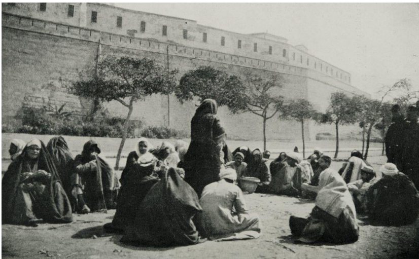
Slika 3. Pripovjedačica, arapska noć

Međutim, kvaliteta izvedbe uvelike ovisi o atmosferi koju stvara između pripovjedača i gledatelja, kao i o meddahovoj sposobnosti da uključi imitacije, šale i improvizacije koje se često odnose na suvremene događaje. Ova umjetnost, koja veliku važnost pridaje vladanju retorikom, izuzetno je cijenjena u Turskoj. 6