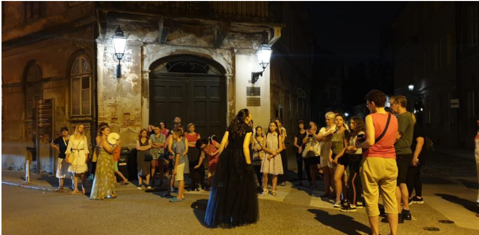
Slika 12. Purgerica i začarane priče

Sudionici imaju priliku sudjelovati u interaktivnim dijelovima ture te čuti o legendama grada i seoskim običajima poput pletenja cvijeća, druženja mladih oko vatre i pripovijedanja priča o gradu koji spava između dvaju zmajeva - Medvednice i Save. Tura je temeljena na djelima Zdenka Bašića, Ivane Brlić Mažuranić, Denivera Vukelića i Vida Baloga, koji istražuju hrvatsku mitologiju i bajoslovlje. 25