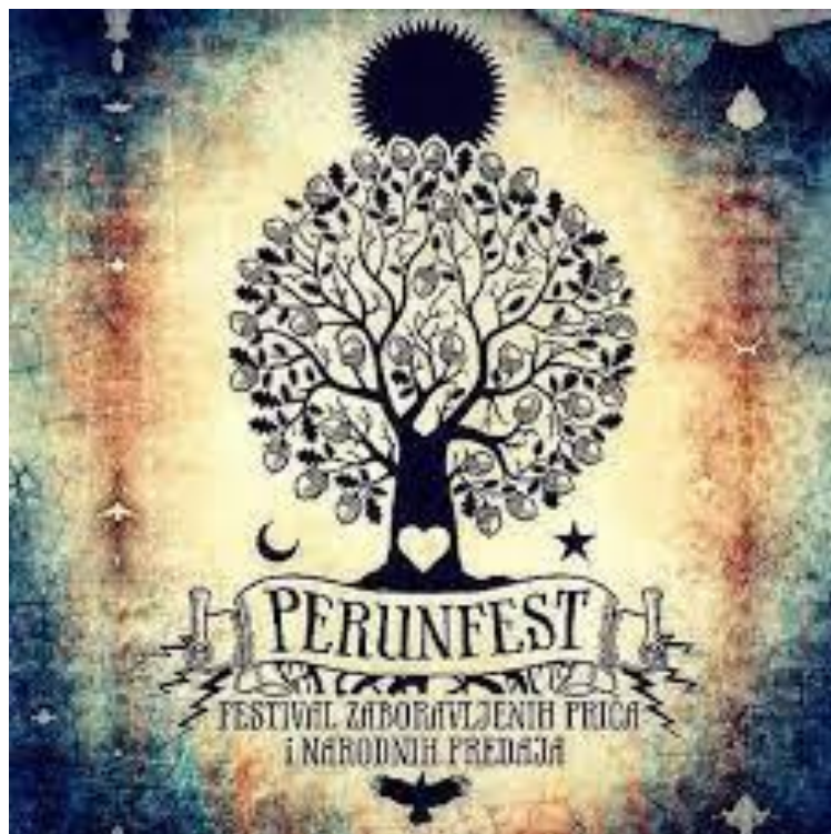
Slika 4. Vizualni identitet Perunfesta

Na dnu ispod korijena svijeta stoji sakrivena Mokoš (u obliku zimske vrane); majka Peruna i baka mladog božanskog para Jurja i Mare; predstavlja zemlju, majku; ona koja život daje, ali život i oduzima; svoj oblik mijenja od živog proljeća kada izlijeće na vrh hrasta/Stabla Svijeta, do strašne zime kada leti nad zemljom i klopoče kljunom dok nosi smrt, ali štiti sve sjemenje pod zemljom, kreativnost i sve novo što tek dolazi. 13