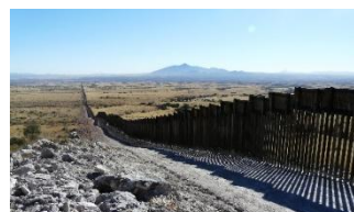
Slika projekta US-Mexico border walla 1

Ovo je projekt izgradnje zida na granici SAD-a i Mexica, a koji financira SAD uz potporu njenog samog predsjednika Donalda Trumpha. Namjena zida-granice bila bi sprječavanje ilegalnih prelazaka meksičkih građana, koji