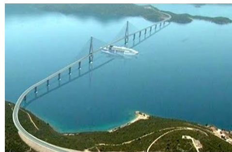
Slika projekta Pelješkoga mosta 1

Izgradnja Pelješkog mosta je od iznimne strateške i političke važnosti za našu zemlju. Most će nakon izgradnje uspostaviti čvrstu vezu Hrvatskog teritorija sa svojim najjužnijim dijelom, Dubrovačko-neretvanskom županijom, bez prelaska preko teritorija susjedne nam Bosne i Hercegovine. Most će spojiti kopno s poluotokom Pelješcem preko morskog tjesnaca u dužini