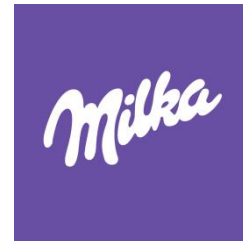
Logo Milke 1

Prvu čokoladu Milka napravio je švicarski slastičar Phillipe Suchard 1901. godine, dok je današnji vlasnik licence međunarodni koncern Kraft Foods. Ime Milka je složenica prvih nekoliko slova dviju riječi: MILch i KAKao.