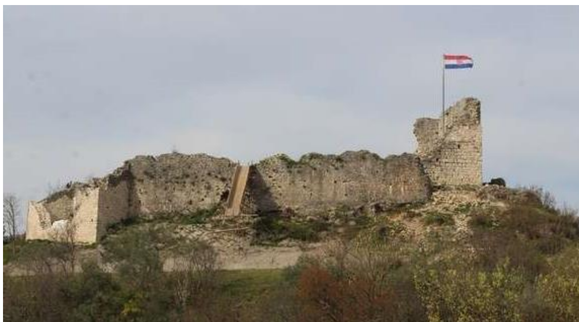
Slika 16: Tvrđava Kurjakovića