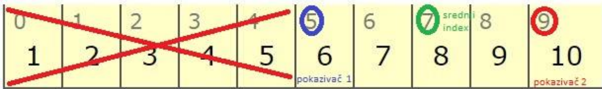
Slika 5. Binary pokazivači 2.korak

Zatim pomiče pokazivače na najmanju, najveću i srednju indeksnu vrijednost (kao što vidimo na slici 5) te ponovo uspoređuje vrijednost na kojoj se nalazi srednji indeks s traženom vrijednošću. U našem slučaju ponovno zanemaruje lijevu stranu liste jer tražena vrijednost je 9, a srednja je 8 tako da tražena vrijednost je veća od srednje, te zaključuje da se nalazi na desnoj strani od srednjeg indexa pa dobijemo slijedeće: