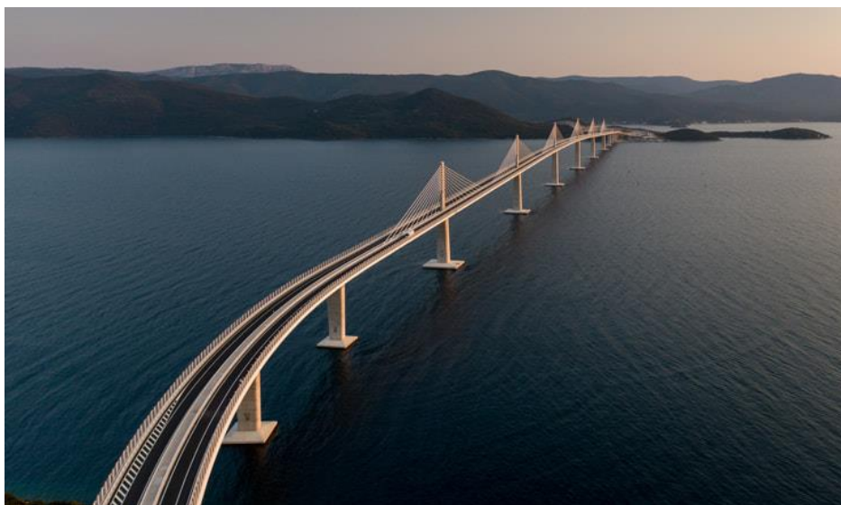
Slika 4 Izgrađen Pelješki most

Najpoznatiji projekt u novijoj Hrvatskoj povijesti, ako ne i uopće je projekt izgradnje Pelješkog mosta. To je projekt financiran sredstvima Europske unije te je dio projekta Cestovna povezanost s Južnom Dalmacijom. Sufinanciran je iz Operativnog programa Konkurentnost i kohezija u iznosu od 2.733.225.710,49 HRK što ga čini najvećim hrvatskim infrastrukturnim projektom financiranim iz fondova EU. Iznos ukupno prihvatljivih troškova projekta je 3.215.559.659,40 (HRK), od kojih je EU sufinancirala 85%.