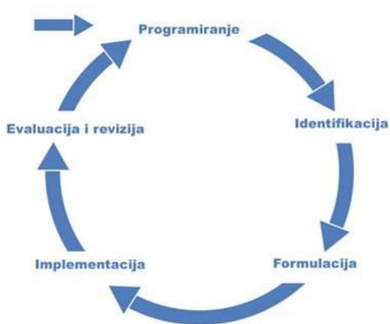
Slika 2 PCM metodologija upravljanja projektnim ciklusom

Pri donošenju odluka i odlučivanju u okviru upravljanja projektnim ciklusom postoji okvir kvalitete kojim se treba voditi, a sastoji se od tri ključna kriterija: relevantan, izvediv, učinkovit i dobro upravljanje projektom.