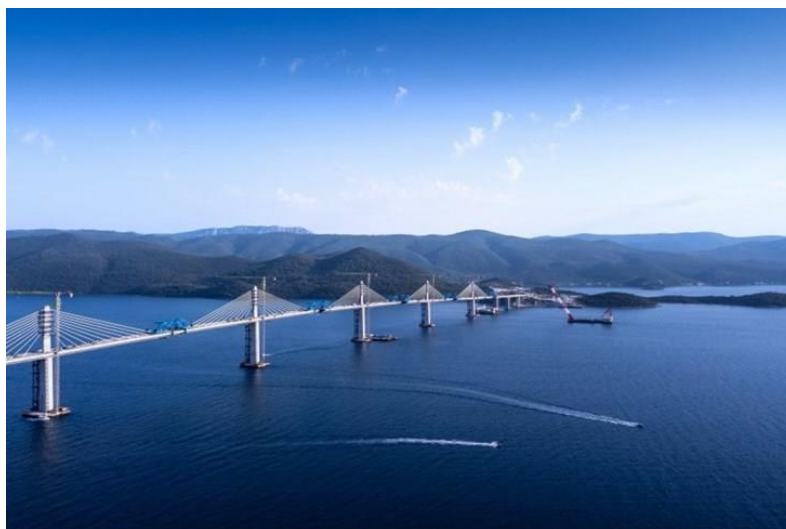
Slika 2. Najveći projekt u povijesti Republike Hrvatske