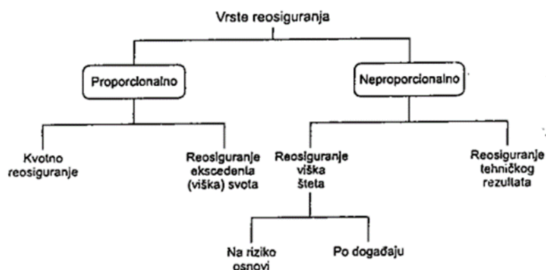
Slika 4: Vrste reosiguranja

Reosiguranje može biti proporcionalno i neproporcionalno. Kod proporcionalnih reosiguranja reosiguratelj prihvaća fiksnu proporciju udjela u mogućoj obvezi osiguravatelja, dok kod neproporcionalnih reosiguranja obveza reosiguravatelja dolazi do izražaja samo u slučaju ako ugovoreni iznos. (Andrijašević, 1999: 311-312)