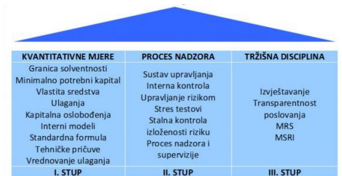
Slika 3: Struktura Solvency II

„U okviru Solvency II, svi rizici u poslovanju društava za osiguranje i društava za reosiguranje trebali bi biti kvantitativno i kvalitativno prepoznati i upravljani. Današnji sustav regulacije adekvatnosti kapitala i granice solventnosti osiguratelja i reosiguratelja u upotrebi je još od 1970., a posljednje izmjene doživio je 2002. godine. Zasnovan je na pravilima i mjerama koje definiraju granicu solventnosti koju moraju ispuniti osiguratelji. To je jednostavan model koji uzima u obzir samo rizik osiguravatelja na principu indeksa premije i šteta“. 8