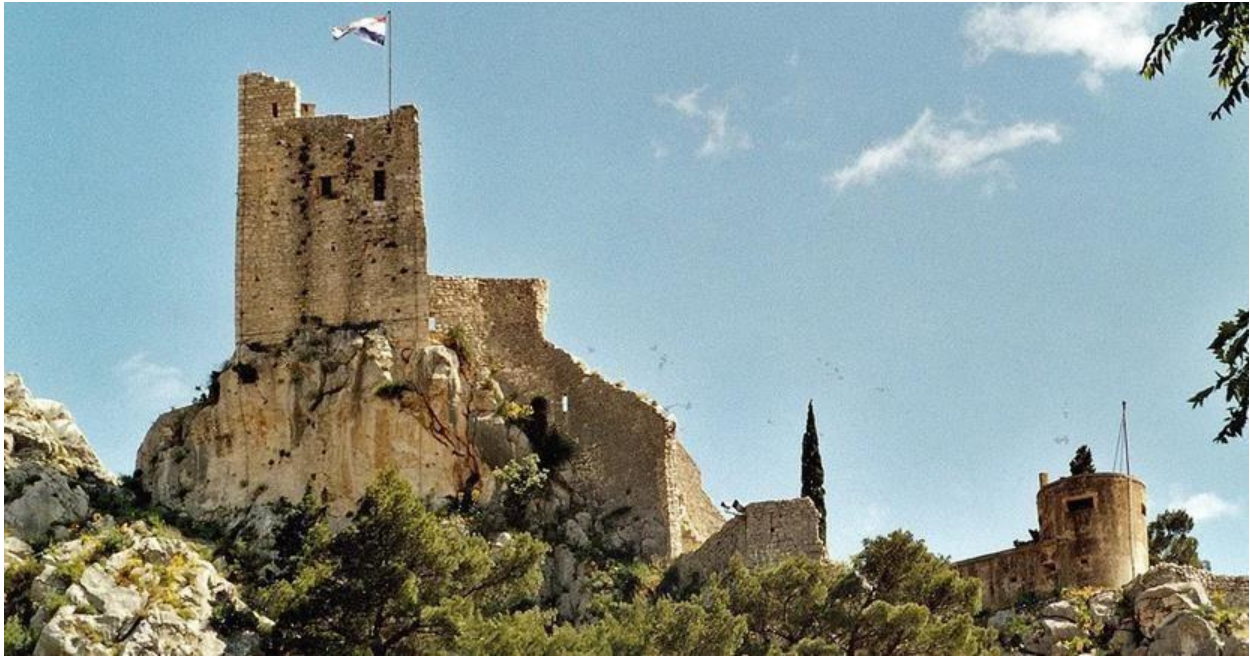
Slika 5. Tvrđava Peovica/ Mirabela Izvor:AdvisorTravel,2023.Mirabella fortress. AdvisorTravel,2023.

Dostupno na: https://en.advisor.travel/poi/Mirabella-Fortress-Peovica-21298 Preuzeto: 27.03.2023.