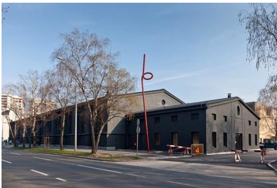
Slika 9. Lauba, kuća za ljude i umjetnost danas.