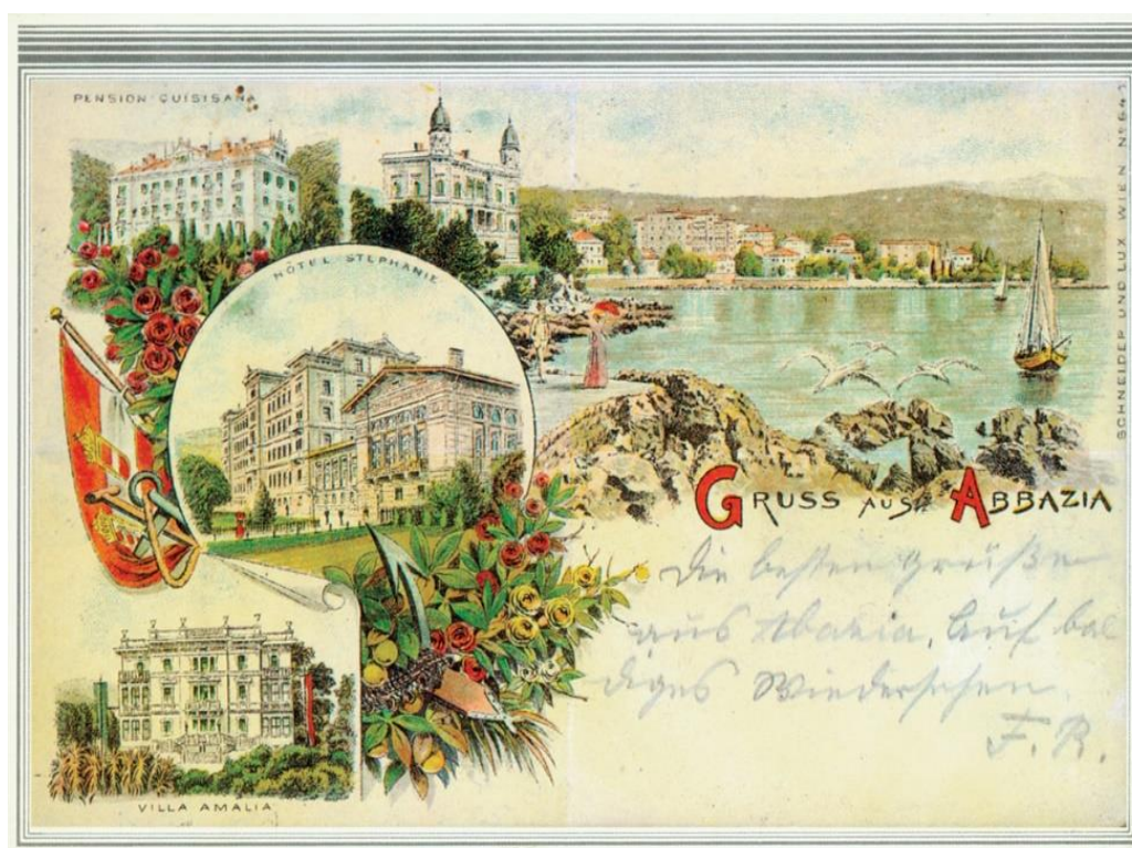
Slika 1. Opatija u počecima turizma u Hrvatskoj.

U razdoblju od sredine 19. stoljeća pa do I. svjetskog rata grade se ceste, željezničke pruge te se uvode brodske linije na Jadranskom moru. Otvaraju se i prvi hoteli (u Opatiji Villa Angiolina 1844. i Kvarner 1884.), pišu se prvi turistički vodiči (o Poreču i o Puli 1845.), organiziraju se prva istraživačka putovanja na Velebit i na jadransku obalu, primorska mjesta na Kvarneru postaju središtima zdravstvenog turizma. Prva turistička društva osnivaju se u Krku 1866. i na Hvaru 1868. godine.