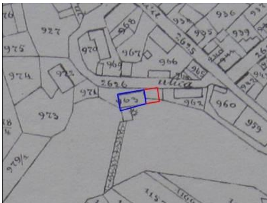
Slika 3. Tlocrt mlina na reambulaciji iz 1896.