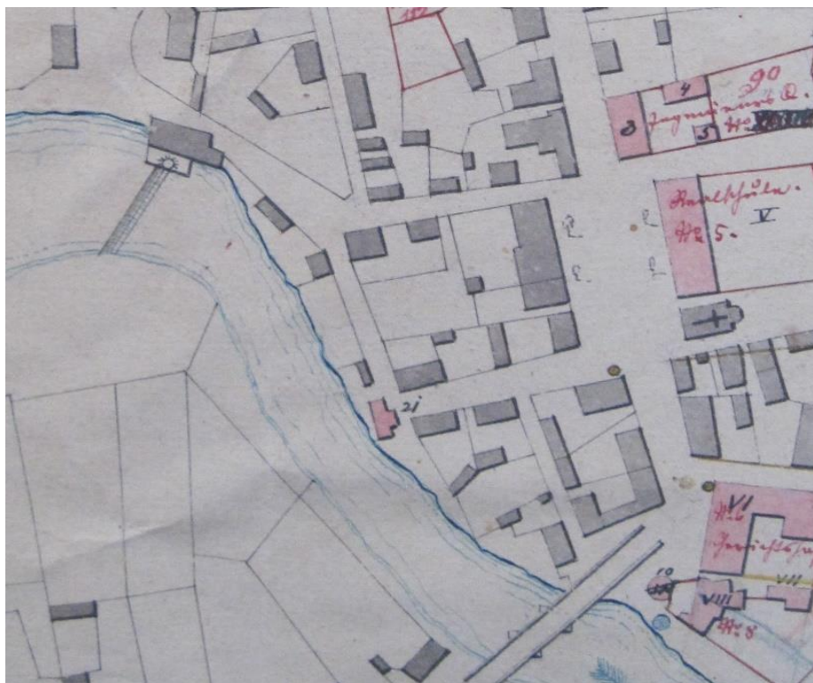
Slika 2. Murkovićev mlin na regulacijskoj osnovi 1874. godine, u gornjem lijevom uglu