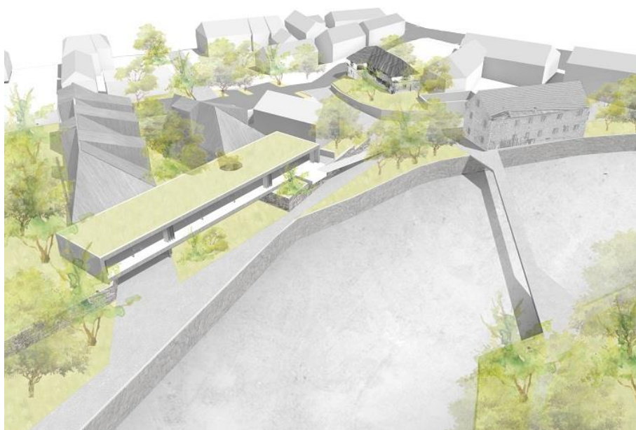
Slika 10. Nerealizirani projekt "Gastronomskog centra Like uz Novčicu".

iako nije sasvim jasno bi li se projektom obuhvatio i prostor mlina. Na tom prostoru prema ideji autorice projekta izgradio bi se gastronomski centar u kojemu bi se prezentirali i prodavali proizvodi koji imaju podrijetlo iz Like te bi unutar centra bio uključen i restoran s ličkom kuhinjom. Prema navodima glavni cilj ove ideje je razvoj cjelogodišnjeg turizma na području Like. Kako je već napisano nema zapisa o tome bi li ovim projektom Murkovićev mlin trebao ići u revitalizaciju, promjenu vlasništva te prenamjenu.