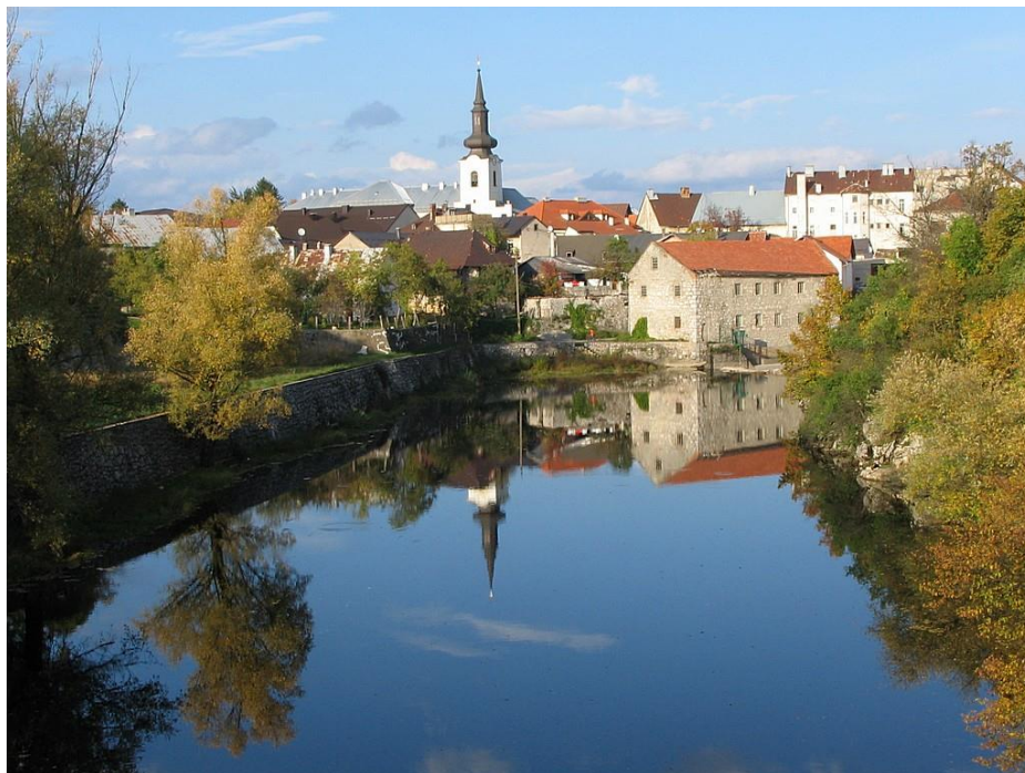
Slika 5. Tipična veduta grada Gospića danas

te šetnice i mjesto zadržavanja šetača i stanovništva. Pogled s novog mosta 8 na mlin čini i jednu od najprepoznatljivijih veduta grada. Veduta s pogledom na mlin nalazi se na stranicama Wikipedije pod pojmom „Gospić“, na lokalnim razglednicama, na mnogobrojnim društvenim mrežama (Facebook, Instagram i td.) te je danas prepoznatljiva slika kojom se definira izgled Gospića u očima njegovih posjetitelja. Početnog manjeg prostornog kapaciteta, s vremenom je proširivan. O promjenama koje su se događale sa samim objektom tijekom vremena više u nastavku poglavlja.