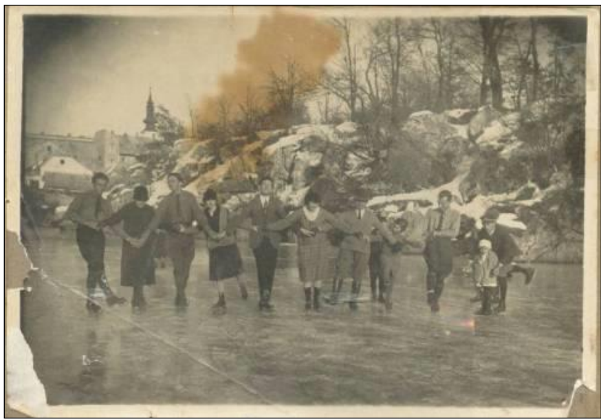
Slika 12. Klizanje ispred Murkovićeve mlina 1926. godine.