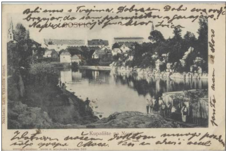
Slika 11. Drveno kupalište zvano „kerep“ na Novčici pokraj mlina 1905. godine.

građana, a sve do danas zadržana je ideja kao i želja da se na njoj obali realiziraju ne samo šetalište, već i drugi sadržaji. Ovisno o događanjima i u slučaju velikog prometa preko (u 19. stoljeću jedinog) Starog mosta građani su koristili bent (ustavu) uz mlin kao prijelaz preko rijeke.