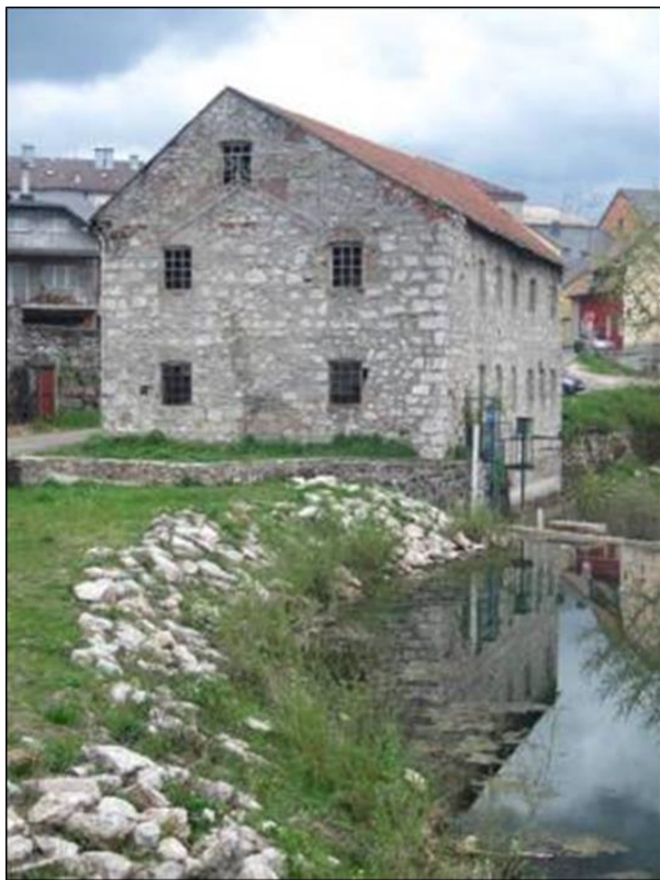
Slika 7. Pogled na mlin (1799.) s mlinskom branom s jugoistočne strane