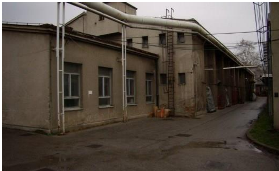
Slika 8. Prostor jahaonice na mjestu buduće Laube, 2007.