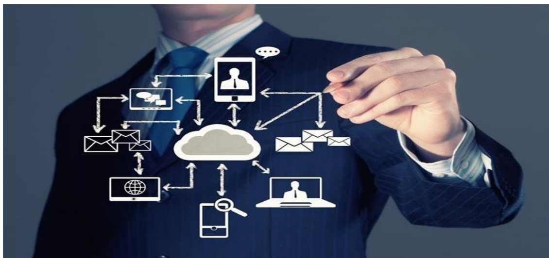
Slika 4. Centralizirani obračun plaća

zahtijevaju njihove sposobnosti. Dodatno, jedan od razloga je pružanje uvida u planiranje mirovina ili potrebe za zapošljavanjem. 23