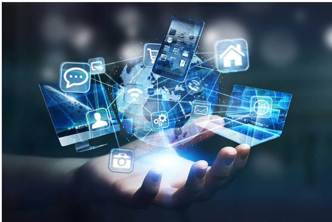
Slika 1. Digitalizacija