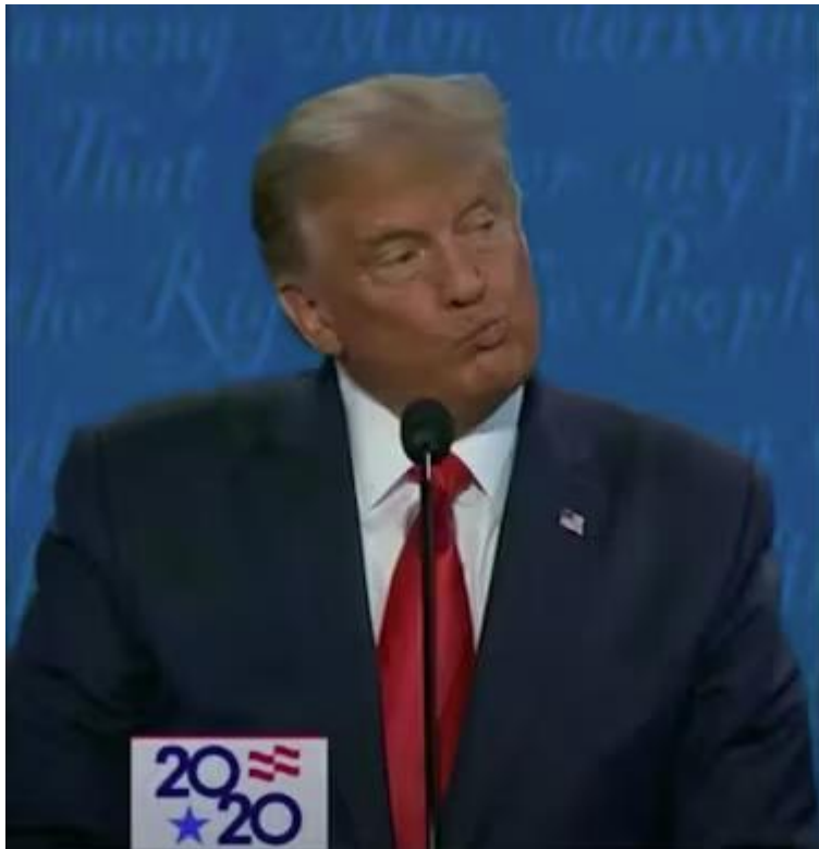
Slika 7. Donald Trump - pretjerano napućena usta

Donald Trump ima izražajne crte lica i drži kontrolu nad govorom tijela čak i u neugodnim situacijama, što projicira sliku autentičnog i samouvjerenog muškarca. Njegovi izrazi lica, poput režanja i smiješka, obično su odavali da se ne osjeća ugroženim od protivnika. Oni su odraz njegove dominantne osobnosti, iako se njegovo slijeganje ramenima može vidjeti kao prilično podložno.