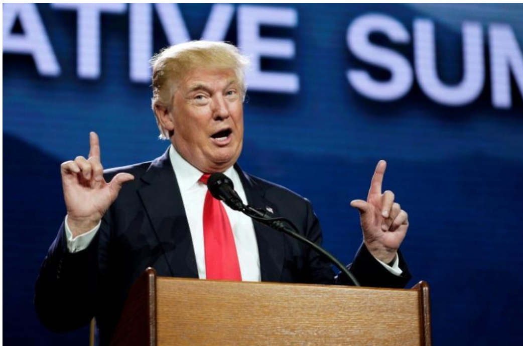
Slika 3. Donald Trump - L znak

Znak „OK“, kako je prikazano na slici iznad, Trump je koristio s ciljem da pokaže da je siguran u sebe, ima kontrolu nad činjenicama ili je želio da ljudi obrate pozornost. To je, također, uobičajena gesta među političarima koji žele istaknuti svoj stav.