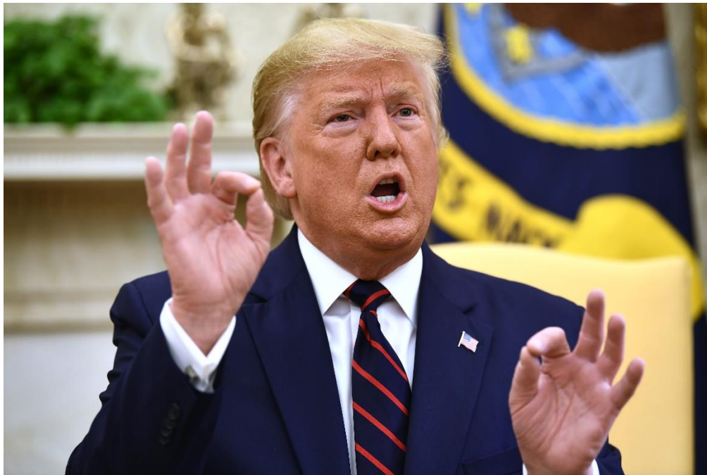
Slika 2. Donald Trump - OK znak.

Znak „OK“, kako je prikazano na slici iznad, Trump je koristio s ciljem da pokaže da je siguran u sebe, ima kontrolu nad činjenicama ili je želio da ljudi obrate pozornost. To je, također, uobičajena gesta među političarima koji žele istaknuti svoj stav.