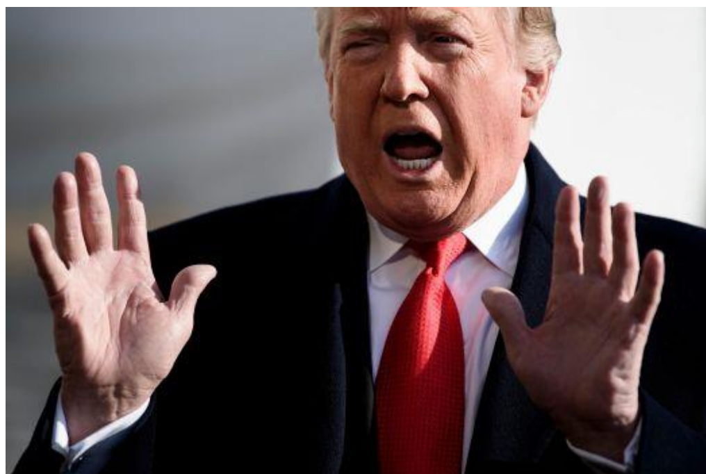
Slika 4. Donald Trump - gesta nevidljivog zida

Kada je Trump napravio gestu nevidljivog zida, učinio je to pomicanjem obje ruke na sinkroničan i paralelan način, što je pojačalo utjecaj njegove poruke. Donald Trump gestom nevidljivog zida, s obje ruke koje sugeriraju „stop“, htio je ukazati na hitnu reakciju na prijetnje s kojima se Amerika bori. U želji da zaštiti SAD od prijetnji kriminala sa teritorija Meksika, Trump je za vrijeme svojeg mandata kao predsjednik htio izgraditi zid na granici sa Meksikom, što je u svojem javnom nastupu nastojao prikazati.