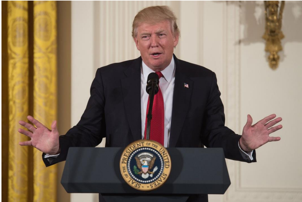
Slika 5. Donald Trump - otvorene ruke

Gesta otvorenih ruku općenito se koristi kao svojevrsni simbol pokoravanja te za mjerenje reakcija kod publike. Samo pokazivanje otvorenih ruku, odnosno dlanova upućuje na gestu pokornosti. Međutim, Trump ju je koristio kada nije znao odgovor na postavljeno pitanje ili kada je procjenjivao reakcije publike. Također, ljudi ovu gestu znaju koristiti kao znak iskrenosti i kada žele dati nekome do znanja da nemaju loših namjera.