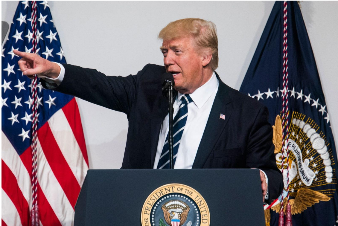
Slika 1. Donald Trump - upiranje prsta u publiku

Premda se upiranje prstom može smatrati nepristojnim kada je izravno upućen prema nekome, no Trump se njime koristio s ciljem povezivanja s pojedincem ili grupom u publici. Ovo koriste skoro sve političke i slavne osobe kako bi barem pokušali pokazati osobi ili grupi da je primijećena.