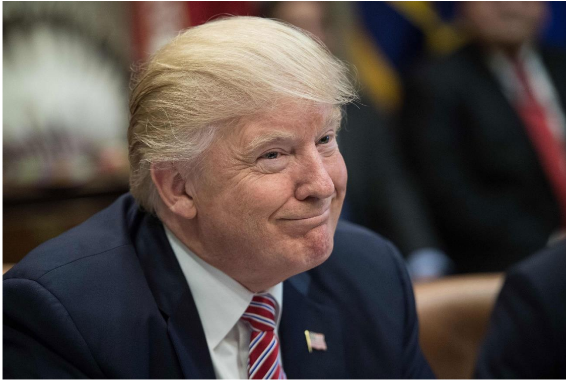
Slika 6. Donald Trump - zategnuti osmijeh

Donald Trump koristio je zategnuti osmijeh kao preteču poruzi ili prijetnju. Ovaj osmijeh inače se smatra jednim od tzv. jadnih osmijeha, koji se pojavljuje u osoba koje imaju želju naceriti se nekome, a pri čemu kontrolira svoj intenzitet osmijeha. Trump je često koristio ovu vrstu osmijeha, imajući tendenciju dominirati i voditi, a što je i činio za vrijeme svoje političke karijere. Također, ovaj osmijeh bio je ujedno i jedan od najčešćih koje je Trump javno pokazivao.