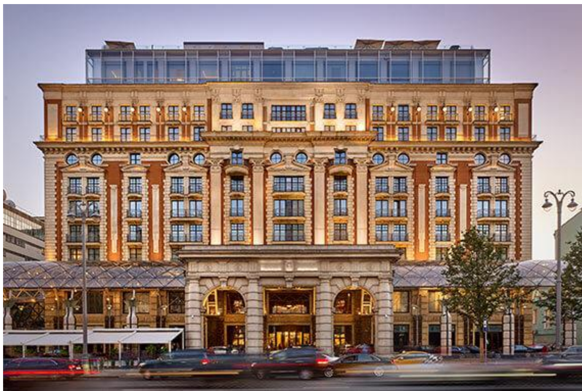
Slika 5 The Ritz-Carlton, Moskva, Rusija