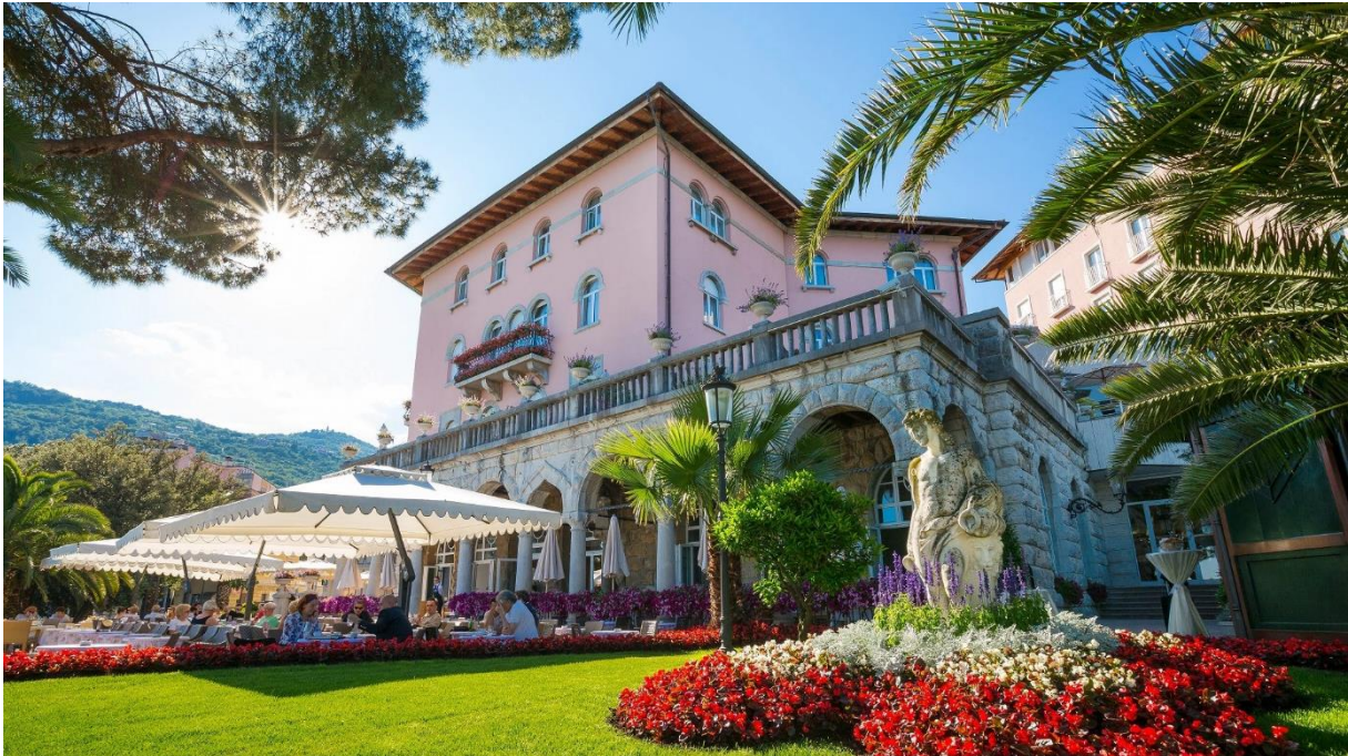
Slika 14 Amadria Park Hotel Milenij