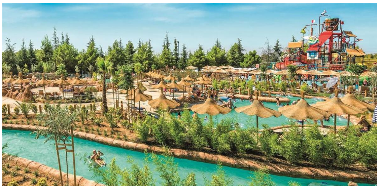
Slika 17 Aquapark Dalmacija

Aquapark Dalmatia – prvi tematski vodeni park u Dalmaciji. Nalazi se u srcu hotelskog kompleksa Amadria Park Solaris. Raznoliki vodeni sadržaji i atrakcije obogaćuju ponudu gostima hotelskog naselja.