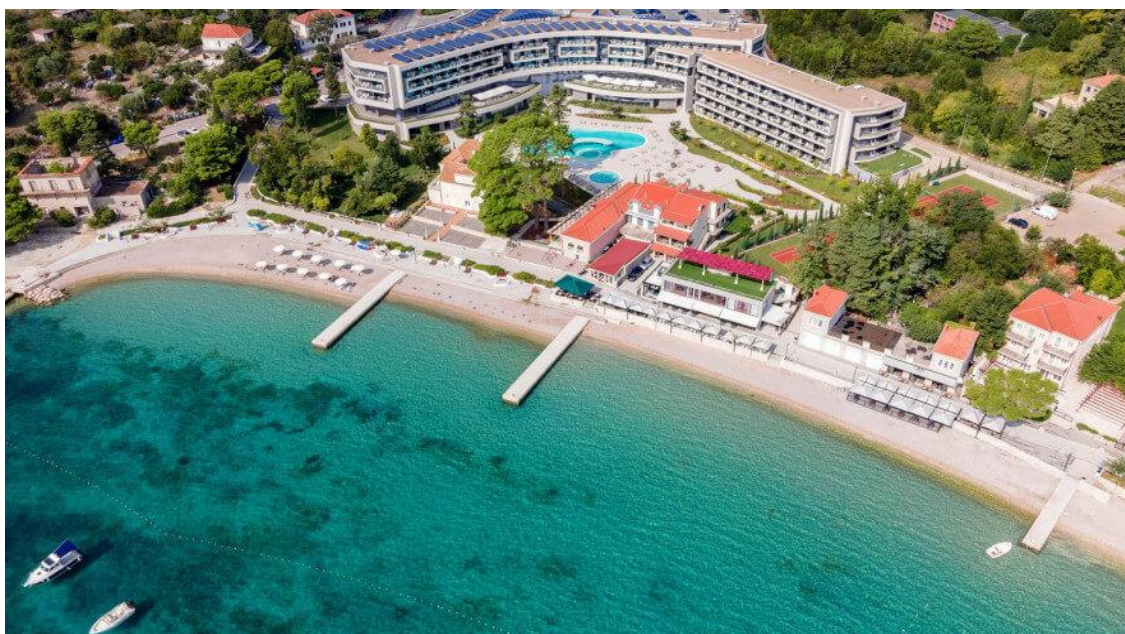
Slika 6 Sheraton Dubrovnik Riviera Hotel

Neki od Marriottovih hotelskih brandova nalaze se i u Hrvatskoj: Sheraton (Zagreb, Dubrovnik), Westin (Zagreb) i The Meridien Lav (Split).