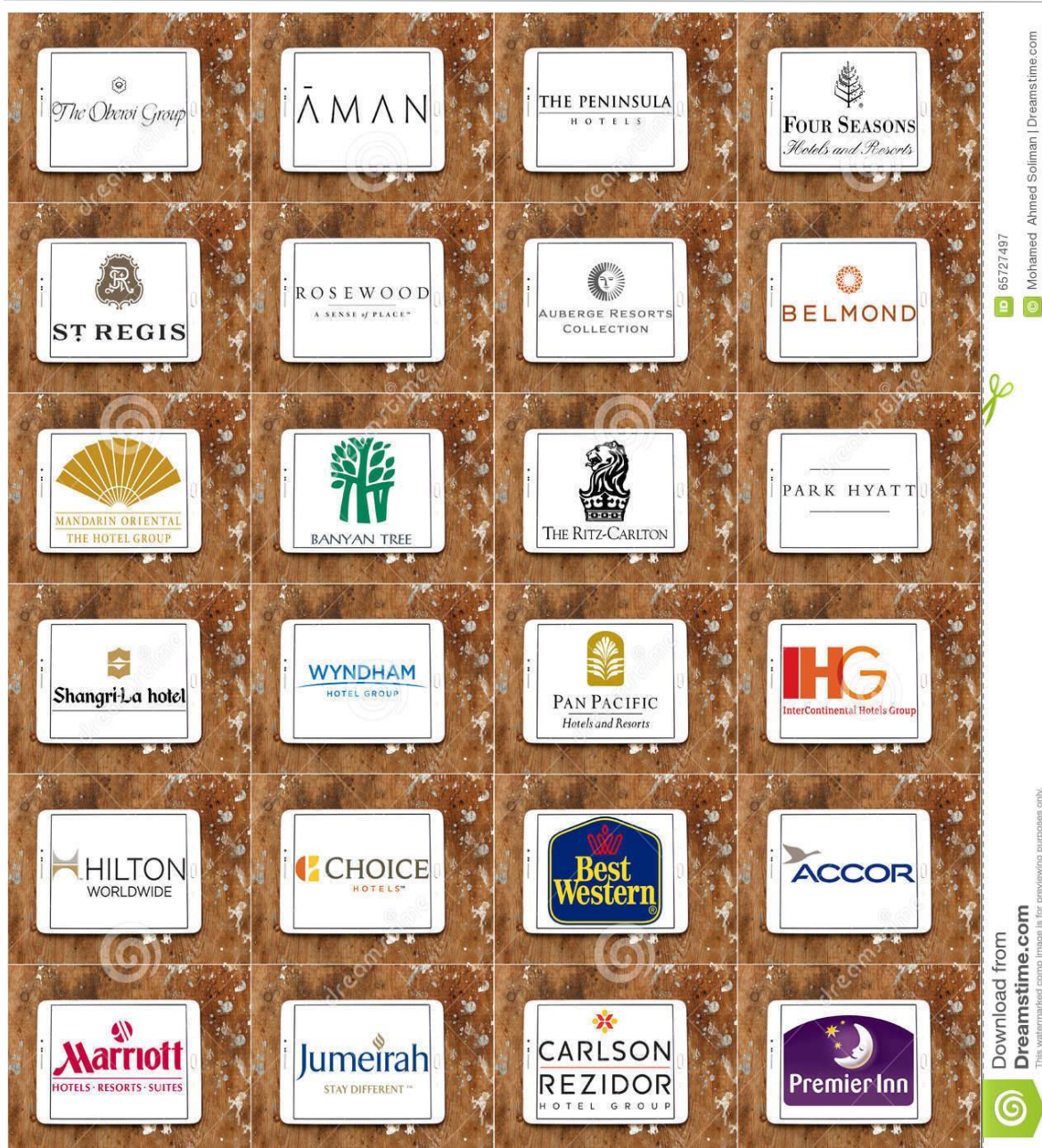
Slika 1 Loga najpoznatijih hotelski brandova u svijetu