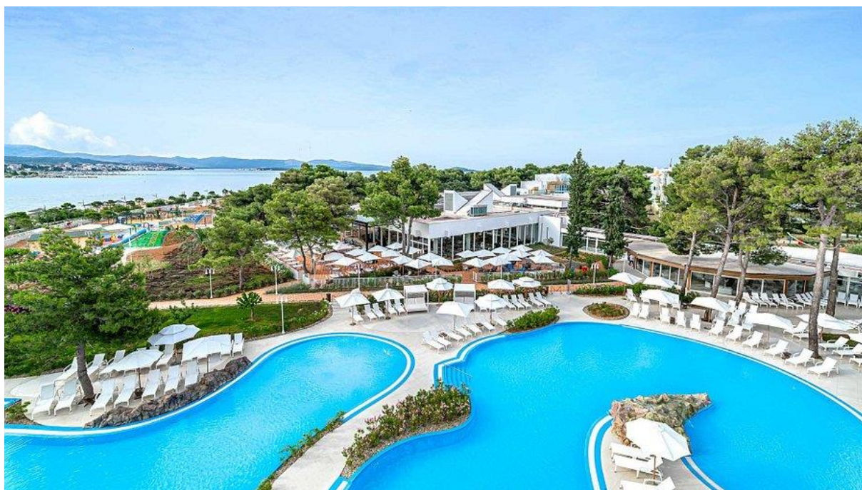
Slika 13 Amadria Park Hotel Jakov