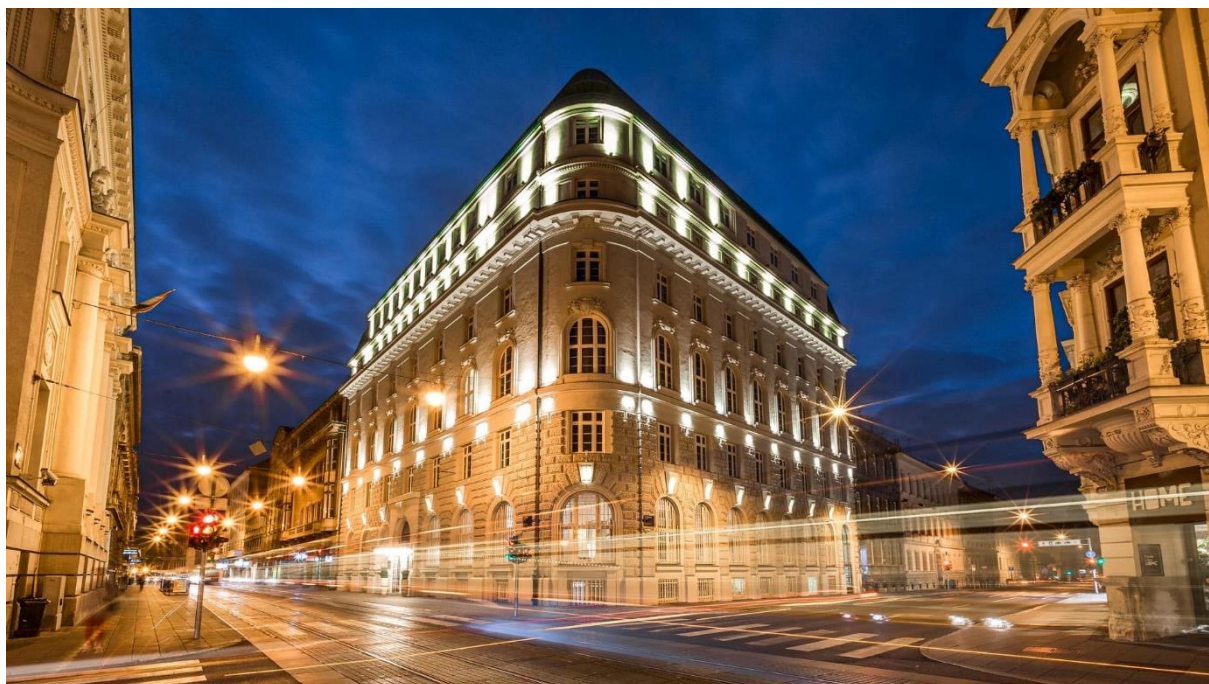
Slika 15 Amadria Park Hotel Capital Zagreb