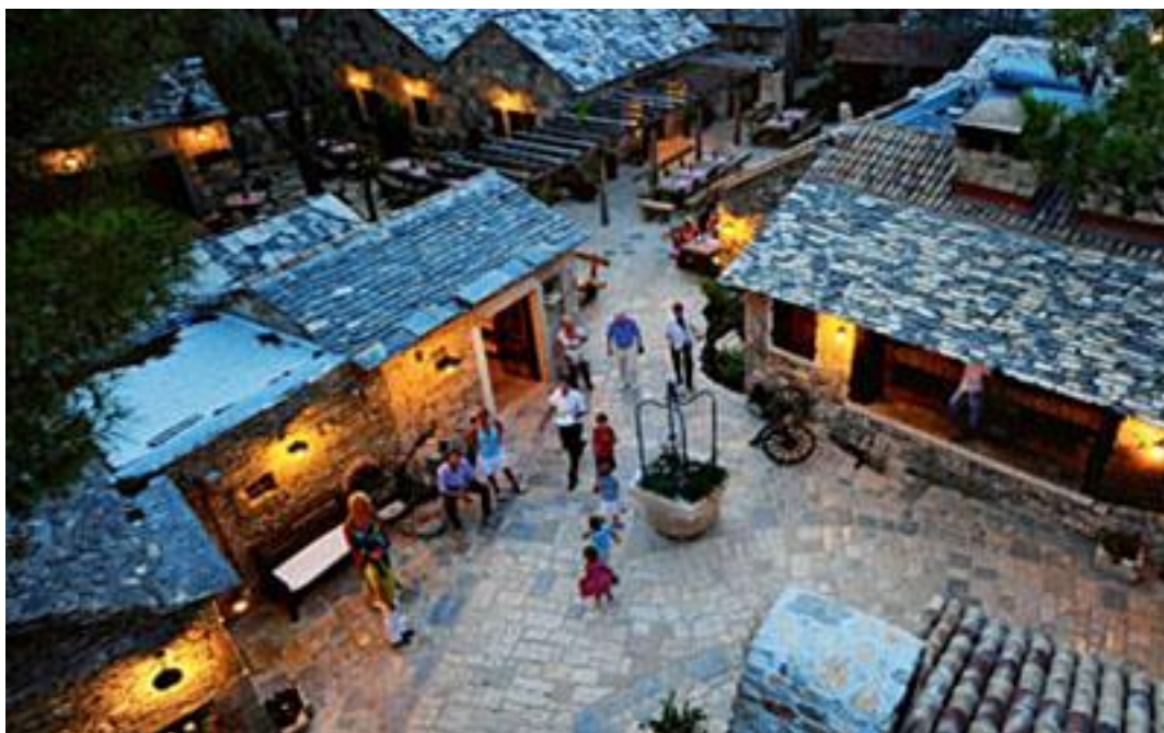
Slika 16 Dalmatinsko Etno Selo