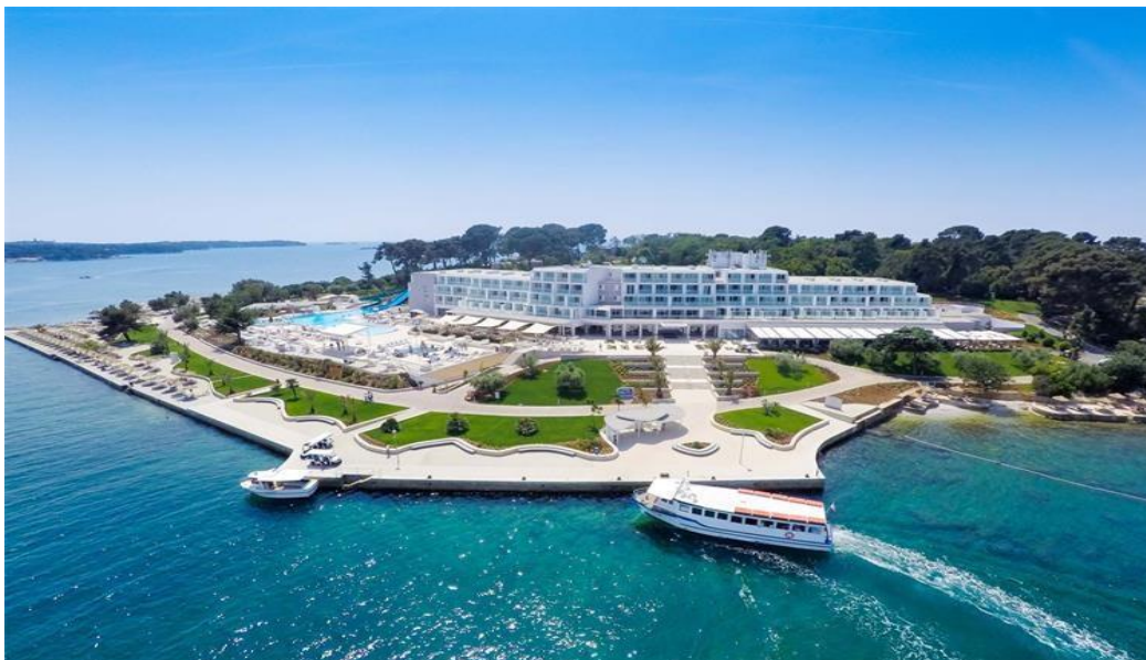
Slika 11 Valamar Riviera hotel