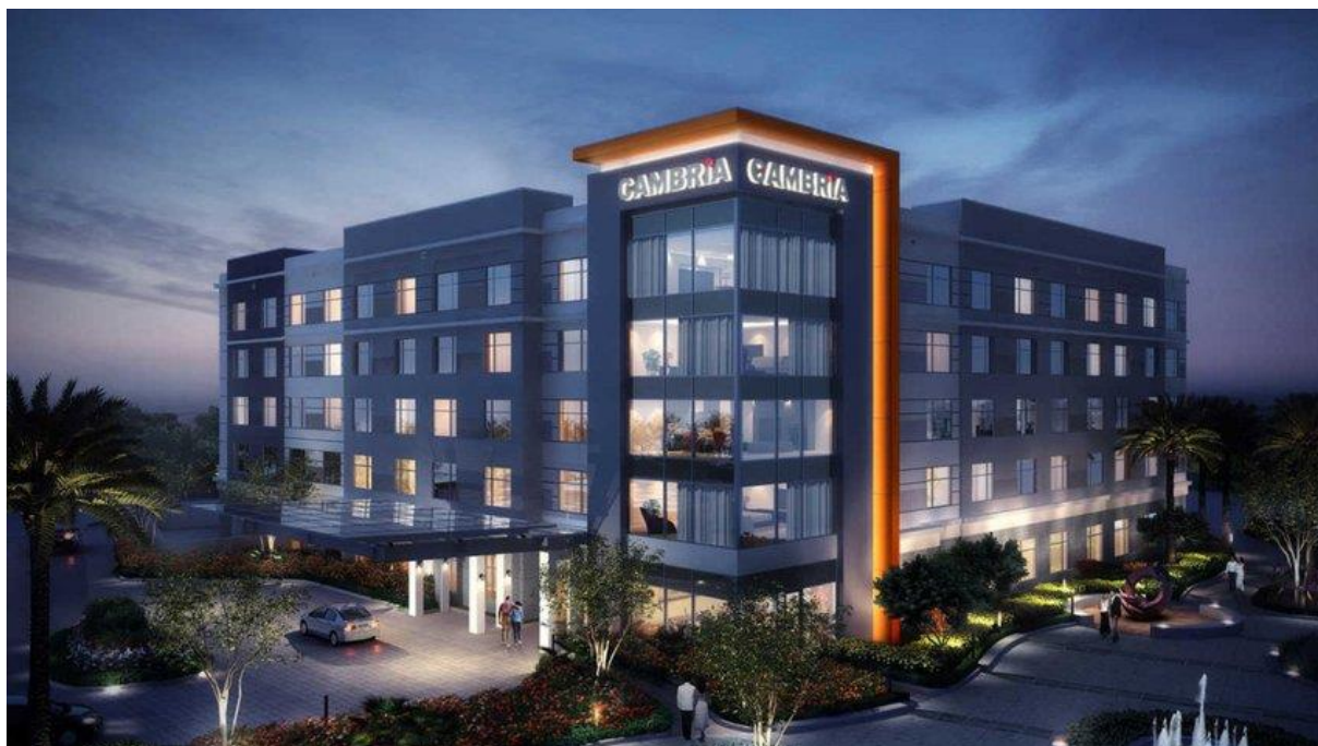
Slika 8 Hotel Cambria