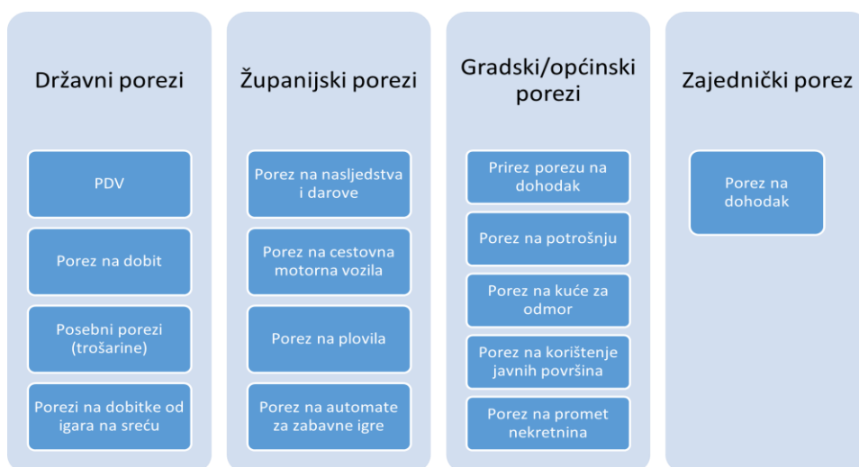
Slika 3 Podjela prema pripadnosti državnim/županijskim/gradskim/općinskim proračunima

Prema pripadnosti porezi se mogu kategorizirati na „državne poreze – pripadaju državnom proračunu, županijske poreze – pripadaju županijskim proračunima ili proračunu grada Zagreba, gradske ili općinske poreze – pripadaju gradskim ili općinskim proračunima, zajedničke poreze – dijelom pripadaju županijskim i dijelom gradskim/općinskim proračunima“ (Cipek i Eljuga, 2019:38).