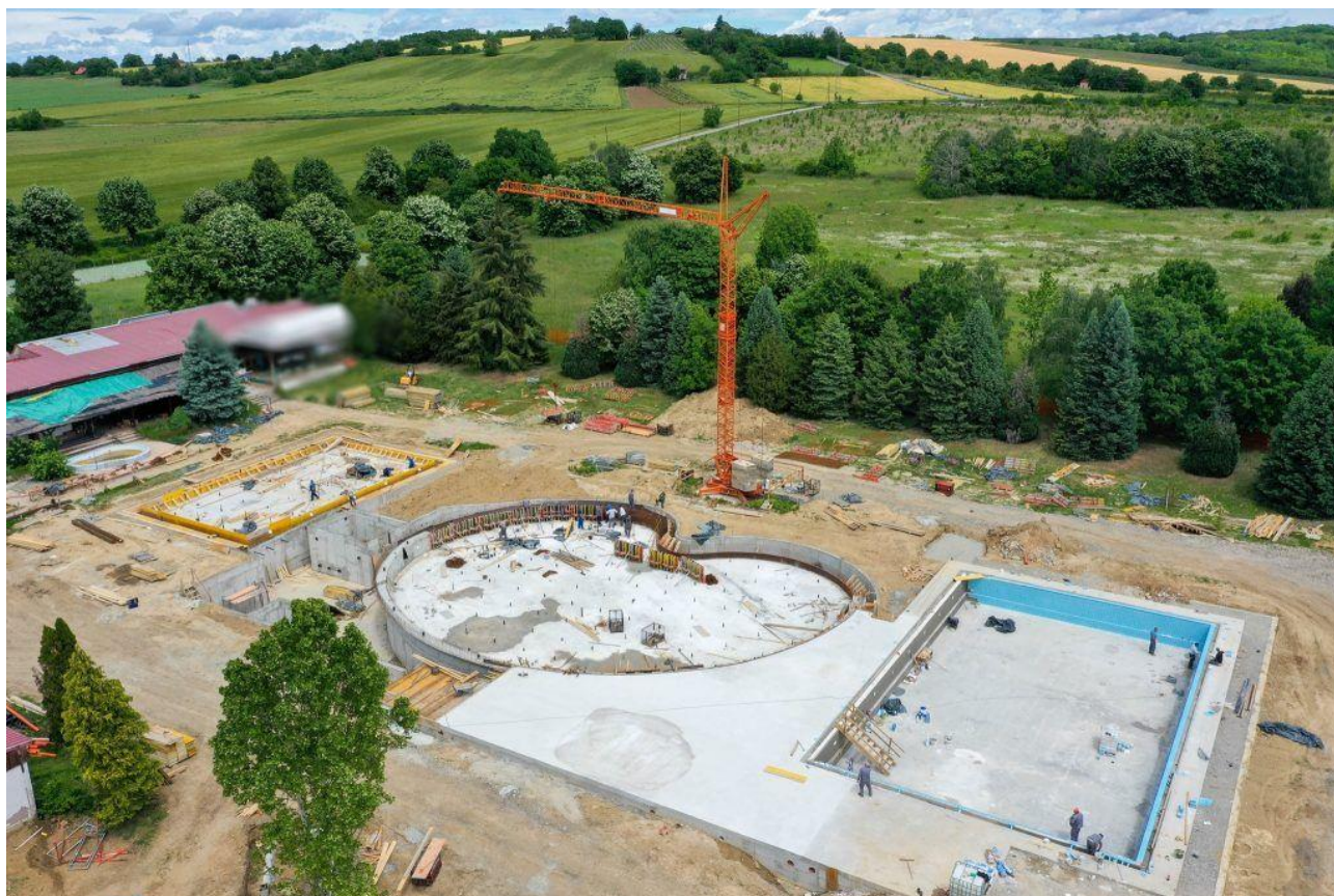
Slika 6. Početak radova izgradnje gradskih bazena u Belom Manastiru