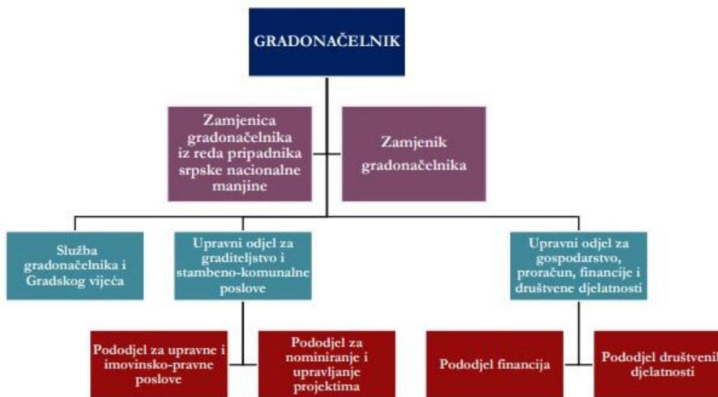
Slika 2. Organizacijska struktura gradske uprave Grada Belog Manastira