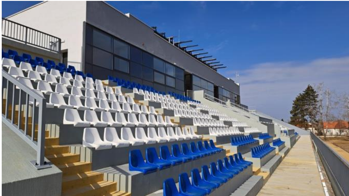
Slika 4. Prikaz tribina glavne zgrade stadiona u Belom Manastiru

Od dobivenih sredstava u projektu „Gradski sportski park“, 3.500.000,00 eura utrošeno je na izgradnju glavne zgrade sportskog parka s gledalištem (Slika 4) – tribinama (622 mjesta). Glavnu zgradu je izgradila tvrtka Zuber iz Višnjevca. Ugovor o javnoj nabavi radova s izvođačem u vrijednosti 3.500.000,00 eura potpisan je 23. lipnja 2021. godine. Radovi su počeli s pripremnim fazama što uključuje označavanje područja gdje će biti glavna zgrada. Teren je pripremljen u skladu s projektom. Nakon pripreme slijedilo je postavljanje temelja te konstrukcija zgrade. Paralelno s izgradnjom zgrade, timovi su radili na postavljanju tribina. Nakon završnih radova slijedila je završna provjera zgrade kako bi se osiguralo da je ona izgrađena prema svim standardima projekta