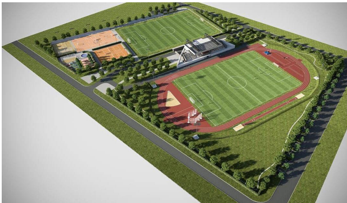
Slika 5. Planirani izgled stadiona u Belom Manastiru iz zraka nakon završetka svih radova

Za izgradnju pratećih sadržaja na lokaciji gradskog stadiona osigurana su dodatna sredstva u iznosu od 36.000,00 eura Ministarstva turizma i sporta i to za izgradnju teniskih terena. U tijeku je izgradnja pomoćnog terena prema najnovijim FIFA-inim standardima s umjetnom travom u vrijednosti 375.000,00 eura zajednice ponuditelja Concordia Consulting d.o.o. i Lumeg-in j.d.o.o. iz Zagreba. S 50.000,00 eura njegovu izgradnju sufinancira Osječko-baranjska županija kroz Program sufinanciranja kapitalnih ulaganja u sportske objekte i terene na području županije. Paralelno se izvode radovi na obnavljanju dosadašnjeg pomoćnog, a budućeg glavnog igrališta, u suradnji s Hrvatskim nogometnim savezom. Na Slici 5 je prikazan planirani izgled stadiona iz zraka nakon završetka radova.