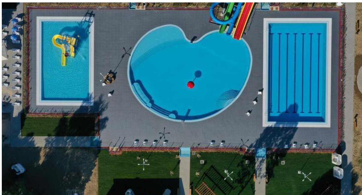
Slika 7. Pogled na gradske bazene u Belom Manastiru iz zraka