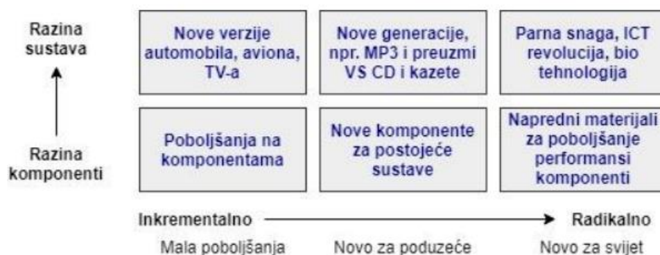
Slika 1: Stupnjevi inovacija

Inovacija je ključan element u razvoju poslovanja i društvenog napretka. Prema Tidd i Bessant (2009.) stupnjevi inovacije određuju razinu utjecaja koji inovacija ima na tržište, industriju ili društvo općenito. Ta razina može biti niža što pretpostavlja inkrementalno poboljšanje, do viših razina utjecaja kada se govori o radikalnim promjenama. Sukladno stupnju inovacije može se utvrditi koliko je nova inovacija. Stupnjevi inovacija prikazani su na sljedećoj slici.