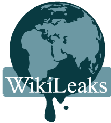
Slika 3. Logo WikiLeaks