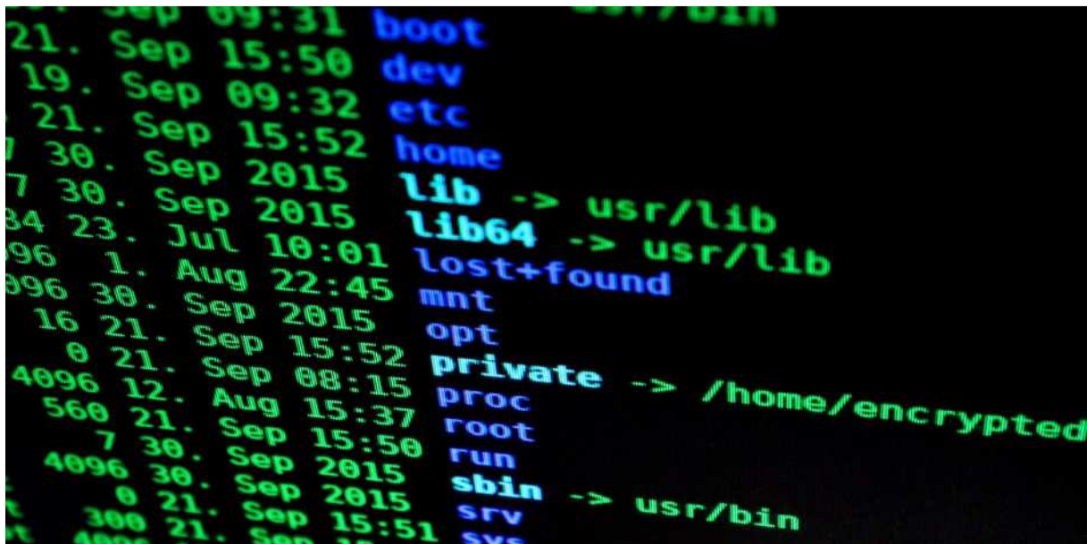
Slika 2. Prikaz pada računalnog sustava napadom hakera

razlika hakera i crackera bila u motivaciji njihova ponašanja u virtualnom svijetu, međutim, preuzet je pojam hacker koji je tada diferenciran kao „hacker bijelog šešira“ za nadarene specijalizirane stručnjake te „hacker crnog šešira“ za osobe koje su rušile sigurnosne informatičke sustave. Tako su hackeri crnog šešira u svojim informatičkim napadima koristili za motiv napada osvetu, sabotazu konkurentnih poduzeća, krađu informacija te vršenje terora nad određenim skupinama. Yar (2006) je naveo razliku između hakera i crackera gdje motivacija leži u razlikama koje će olakšati kriminološku obradu, a u daljnjem razvoju hakiranja su sociolozi opisali hakere procesom etiketiranja kao osobne napadače u virtualnom svijetu koji svjesno i ciljano nanose štetu napadom na računalne sustave. Radi se o procesu kroz koji se kreiraju kategorije kriminalnih i devijantnih aktivnosti i identiteta od strane društva. Posljedično, reakcije na „hakiranje“ i „hakere“ ne mogu se shvatiti odvojeno od činjenice da je značenje ovih termina društveno raspravljano i stvoreno (Yar, 2006).