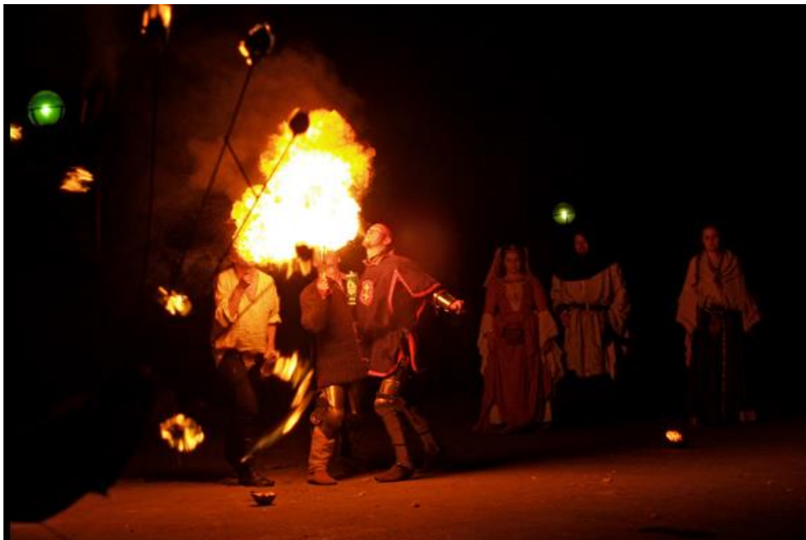
Slika 2 Prikaz putujuće družine i njihovog nastupa

Druga polovica 15. stoljeća donosi sve veći broj glumačkih družina koje redovito nastupaju po većim gradovima poput već spominjanih Dubrovnika i Zagreba, no svoje nastupe izvode i po raznim sajmovima, gostionicama i sl. U Dubrovniku tog doba dolazi do osjetnog jačanja scenskog života pod utjecajem hrvatske dramske književnosti. Tako se prikazuju djela Vetranovića i Nalješkovića, a glumišnom djelatnošću započinje i Marin Držić. Stvaranjem svojevrsnog scenskog života u gradovima, dolazi do odbijanja prihvata putujućih zabavljača, te im se brane izvedbe. Dokaz tih zabrana je i „Poljički statut“, jedan od najstarijih spomenika starog hrvatskog prava u kojem se izlaže da je moguće uskratiti nasljedstvo onome koji radi nečasne poslove a u koje je ubrojena i gluma. (Batušić,2019:18-22)