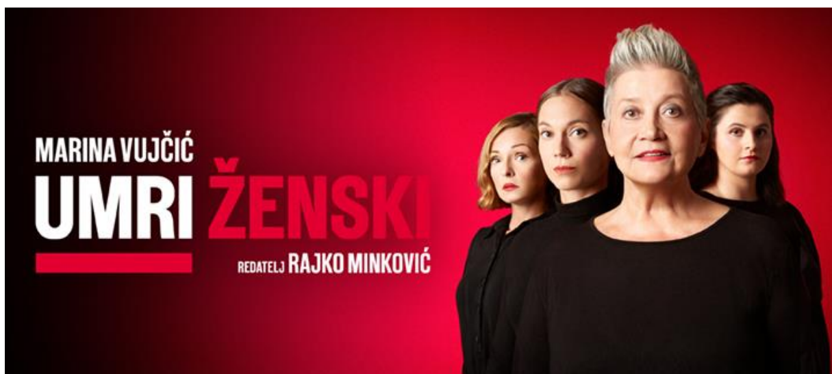
Slika 31 Plakat za najavu nove premijerne izvedbe teksta Umri ženski, Marine Vujčić

Kazalište Kerempuh se također smatra suvremenim kazalištem ponajprije zahvaljujući postavljanju brojnih djela suvremenih pisaca poput svojedobno Hitreca i Hadžića, Mrožeka i Brešana, pa do u novije vrijeme Mate Matišića, Senkera, Škrabe, Radakovića, Jergovića, Nine Mitrović i mnogobrojnih ostalih pisaca.