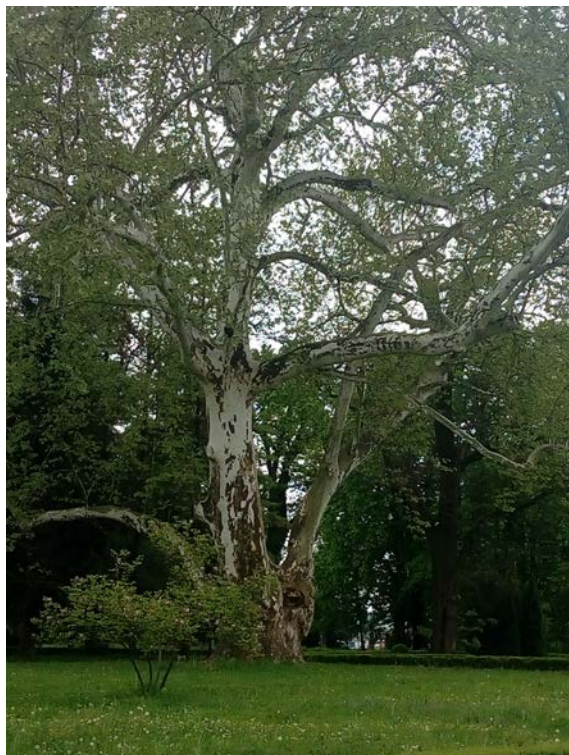
Slika 4-9 Platana

Perivoj je izravno povezan s njegovanim šumarkom, a ispred dvorca posebno se ističe velika platana stara oko 400 godina.