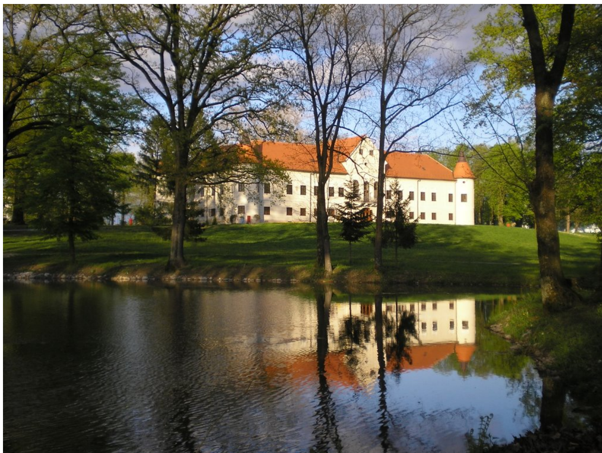
Slika 4-8 Park i jezero

Perivoj dvorca Lužnica prostire se na 8 ha površine i ima pejzažne odlike engleskog parka. Smatra se da je nastao u 18. st., a radi svoje očuvanosti i jedinstvenosti predložen je za zaštitu u kategoriji spomenika parkovne arhitekture. U sklopu perivoja nalaze se održavana šuma i jezero, a kroz park vode nepravilne šetnice.