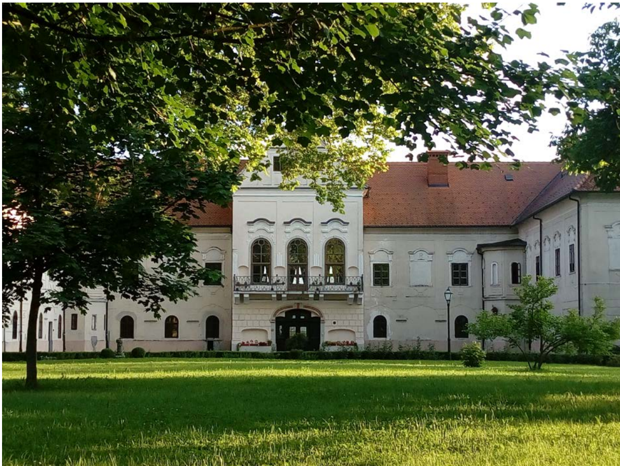
Slika 4-6 Dvorište

U 19. st. rađene su pregradnje u unutrašnjim kutovima dvorišta u neogotičkom stilu, ali dvorac u cijelosti sadrži odlike baroknog stila.