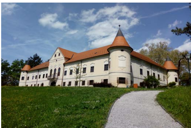
Slika 4-1 Dvorac Lužnica

Dvorac Lužnica izgrađen je na prijelazu savske doline u Marijagoričko pobrđe, nekoliko kilometara zapadno od Zaprešića, a prvi se put spominje 1673. godine. Današnji trokrilni jednokatni barokni dvorac u obliku slova U izgrađen je početkom 18. st. o čemu svjedoči rezbareno stubište s označenom godinom 1791. Imanje je prvotno pripadalo plemićkoj obitelji