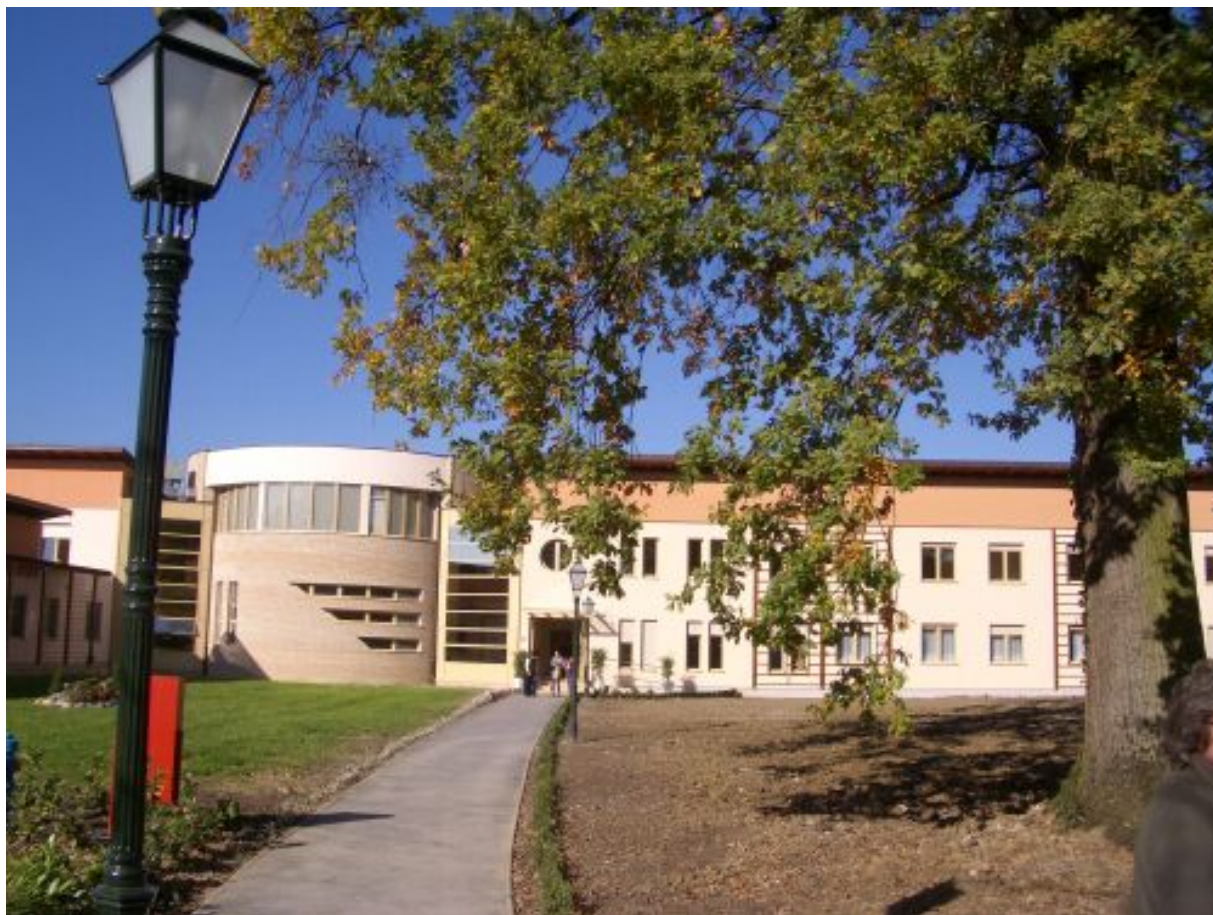
Slika 4-5 Novi Centar

Prema riječima ondašnje ravnateljice centra sestre Miroslove Bradice, jedan od glavnih ciljeva Centra je pomoći čovjeku u susretu s Bogom, sa samim sobom i svojim bližnjima kao i buđenje snage za kvalitetnijom kulturom življenja i preispitivanjem vlastitih životnih stavova.