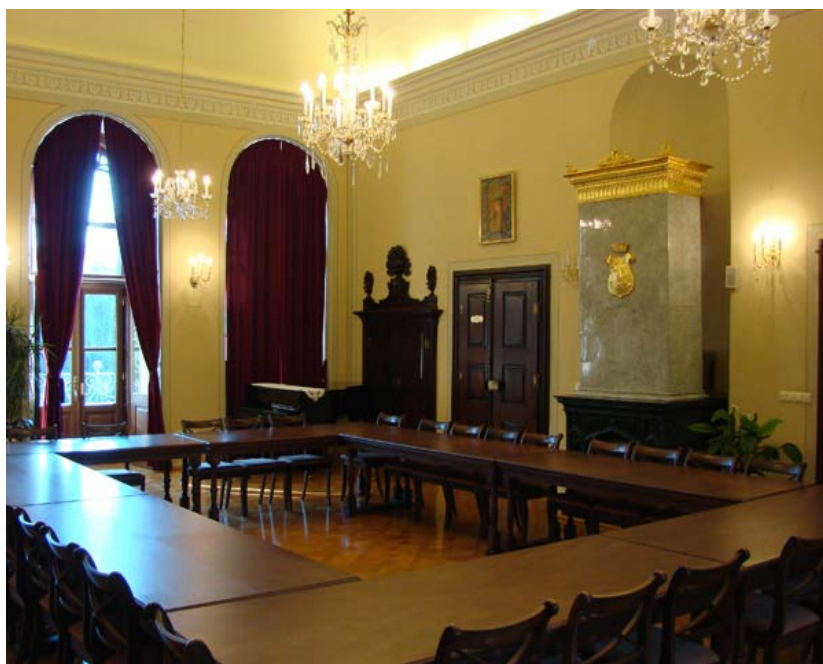
Slika 4-3 Unutrašnjost dvorca – Glavna dvorana