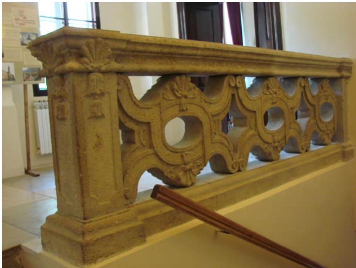
Slika 4-7 Kamena ograda

Rezbarene stepenice zaštićene su na ulazu kovanim metalnim vratima, a samo po odobrenju gospodara, sluga s gornjeg kata otvarao je vrata i puštao posjetitelje.