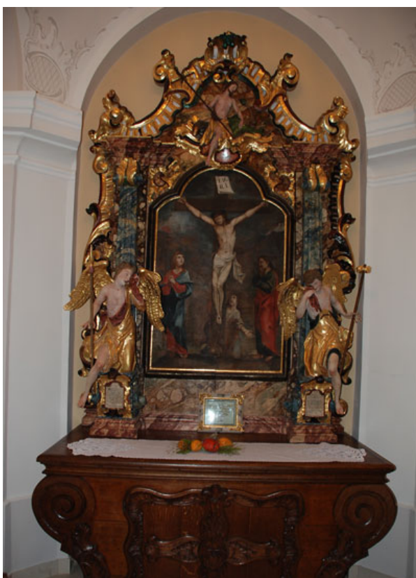
Slika 4-4 Kapela svetog Križa

Kapelica se po dolasku sestara u Lužnicu nalazila u prizemlju lijevog krila dvorca, ali je bila vrlo malena što je osobito nepovoljno bilo ljeti kada bi nedjeljom i blagdanom uz sestre dolazio i velik dio naroda. Časna majka Ignacija Pavičić preuredila je u tu svrhu jednu od gospodarskih zgrada koja je zadovoljavala svojom veličinom i to je bila „ljetna kapelica“, ali prilikom oduzimanja zemljišta, oduzeta im je i kapelica. Nova se nalazila u dvorcu, ali ne više u prizemlju, već na katu na mjestu bivšeg dvorskog salona baruna Raucha. Prilikom uređenja kapelice sestre su vodile računa da se sačuva uspomena na bivše gospodare dvorca. U desnom krilu dvorca na prvome katu sačuvana je još jedna mala „Rauchova kapelica“ s izvornim uređenjem, te uljanom slikom raspeća na baroknom drvenom oltaru.