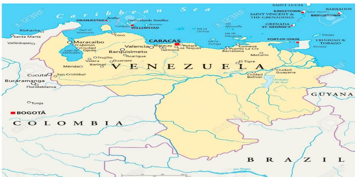
Slika 2: Karta Venezuele

Stanovnici Venezuele porijeklom su Španjolci, Američki Indijanci, crni Afrikanci, zatim Talijani, Portugalci, Arapi, Nijemci i drugi. Dvije trećine stanovnika su mestici i mulati, a oko 20% bijelci. Uz španjolski, govore se i mnogi indijanski jezici. Oko 71% stanovnika pripada rimokatoličkoj crkvi, 17% protestantizam (uglavnom pentekostalizam), 8% bez religije. 32