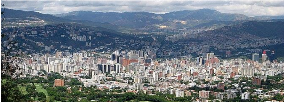
Slika 3: Grad Caracas