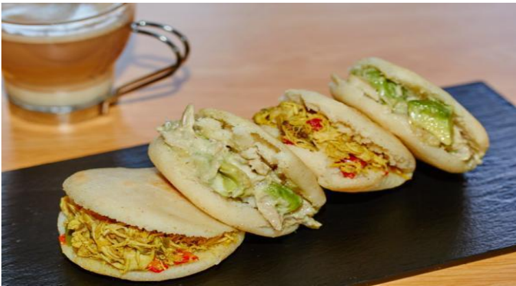
Slika 13: Punjene arepe

pećnicu, otprilike 10 min na 180°C. Tekstura mora biti hrskava, ali iznutra mekana kao polenta. Arepa se servira na način da se prereže (ne do kraja – trećina kruga otprilike se ne rastavlja), namaže se maslacem (ne treba ga posebno razmazivati već se sam rastopi), te se puni pripremljenim punjenjem na koji se dodaje malo naribanog sira. Umak se služi sa strane i dodaje po osobnom ukusu“. 58