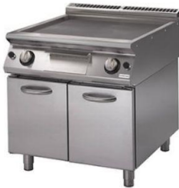
Slika 15: Plinski roštilj

Za proizvodnje 30 do 50 arepa svakoga dana dovoljan je plinski roštilj od branda Končara, čije su dimenzije 800x700x900 mm i s ukupnom snagom od 14 kw. Takav roštilj glavna je oprema za proces proizvodnje arepa koji bi kupci mogli vidjeti.