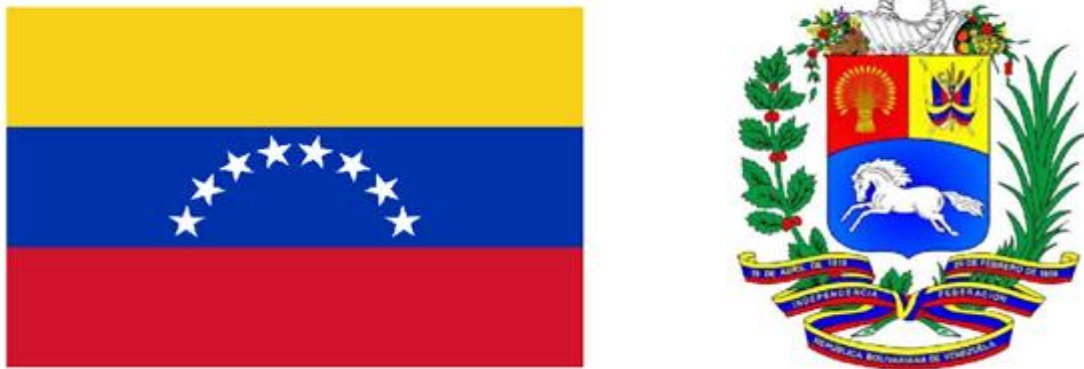
Slika 4: Zastava i Grb Venezuele