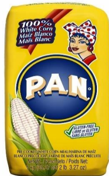
Slika 14: Najpopularnije kukuruzno prekuhano brašno