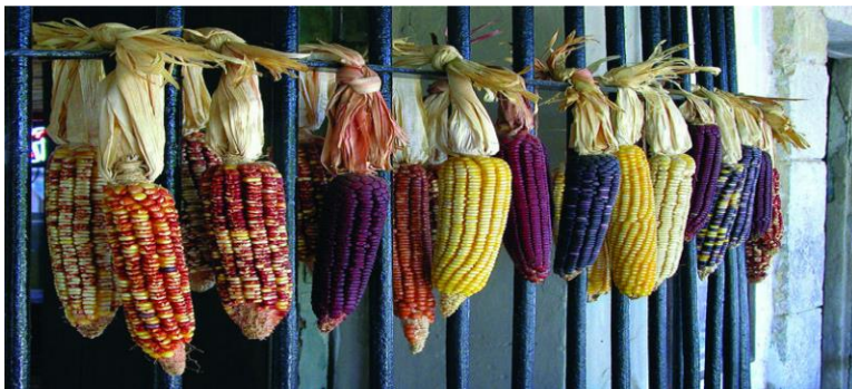
Slika 10: Različita vrsta kukuruza

Arepe su Indijanci pripremali i konzumirali još od vremena prije Kolumba na trenutnim teritorijima koji pripadaju Venezueli. Autohtoni prehrambeni običaji viđeni su u kreolskim jelima na bazi kukuruza poput arepe. Uvođenje arepe u njihova sela rezultat je klime i proizvodnje kukuruza koji je bio važan element u prehrani južnoameričkih starosjedilaca. U tim je krajevima uzgoj kukuruza bio raznolik. Na teritoriju koji odgovara današnjoj Venezueli, plemena su uzgajala devet vrsta kukuruza. Riječ arepa potječe od autohtone riječi "erepa", koju su Cumanagotosi 54 koristili za imenovanje kukuruza. Prema drugoj verziji, riječ arepa mogla je potjecati od "aripo", svojevrsnog blago zakrivljenog tanjura, napravljenog od gline, koji su Indijanci koristili za kuhanje tijesta od kukuruznih brašna. 55