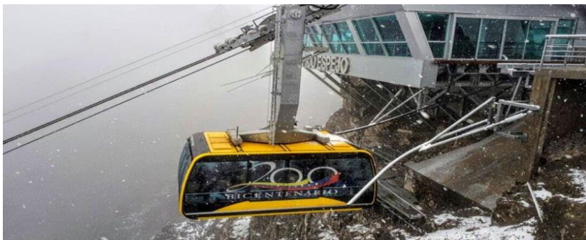
Slika 7: Žičara Merida

Sustav turističkog prijevoza žičara Mukumbarí, sustav je žičara koji djeluje u gradu Meridi. To je najviša i druga najduža žičara na svijetu sa svega 500 metara. Žičara Merida ima 12,5 kilometara, dosegovši visinu od 4,765 metara nadmorske visine, što je inženjerski posao, koji je tradicionalno jedinstven po svom tipu i s više od 50 godina povijesti. 50