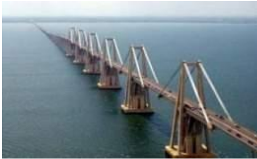
Slika 6: Most generala Rafaela Urdaneta

Most generala Rafaela Urdaneta, koji prelazi najuži dio jezera Maracaibo, u Zuliji, na sjeverozapadu Venezuele, i povezuje grad Maracaibo s ostatkom zemlje. Ime je dobio u čast generala Rafaela Urdaneta, junaka neovisnosti Venezuele. Jedan je od najvećih takve vrste na svijetu, drugi je najduži u Latinskoj Americi i zauzima 65. mjesto najduljeg na svijetu. 49