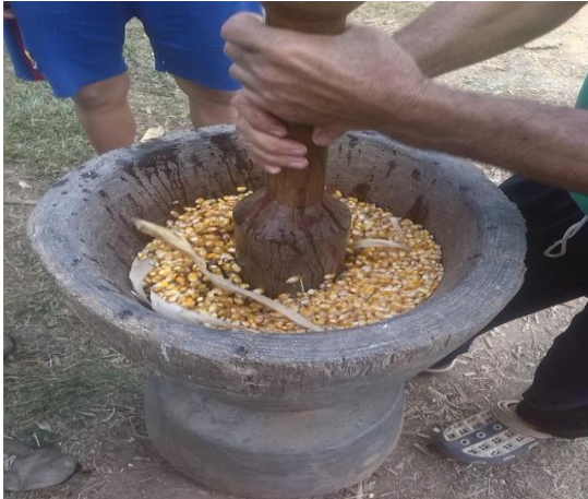
Slika 11: Mljevenje kukuruza