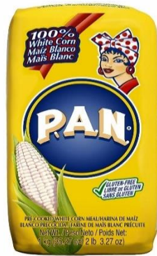
Slika 14: Najpopularnije kukuruzno prekuhano brašno