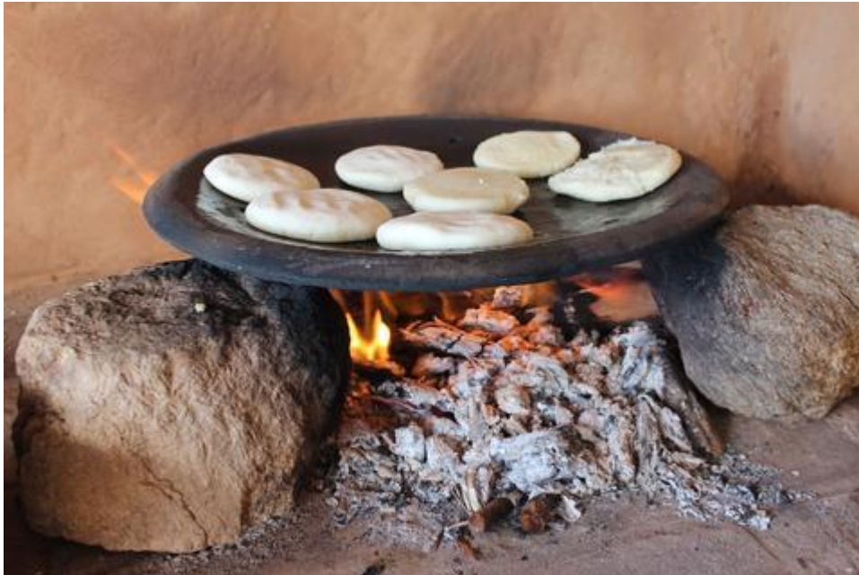
Slika 12: Budare i arepe

Izbor: Acuña, I. (14.07.2017). 13 datos curiosos que quizás no conoces sobre la arepa. La tienda venezolana. Preuzeto s URL: https://www.latiendavenezolana.com/blogs/tienda/13-datos-curiosos-que-quizas-no-conoces-sobre-la-arepa (Pristupano 4.05.2019).