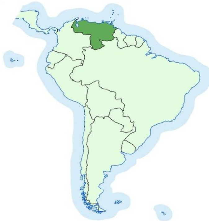
Slika 1: Položajna karta Venezuele

Venezuela (Bolivarijanska Republika Venezuela/República Bolivariana de Venezuela), država koja se nalazi na sjevernome dijelu Južne Amerike, (slika 1) između Karipskoga mora na sjeveru i Atlantskog oceana na sjeveroistoku (duljina obala 2800 km), Gvajane na istoku (duljina granice 743 km), Brazila na jugoistoku i jugu (2200 km) te Kolumbije na zapadu i jugozapadu (2050 km); obuhvaća 916 445 km 2 . U Venezueli živi 31 568 179 stanovnika prema popisu iz 2017. godine. 31