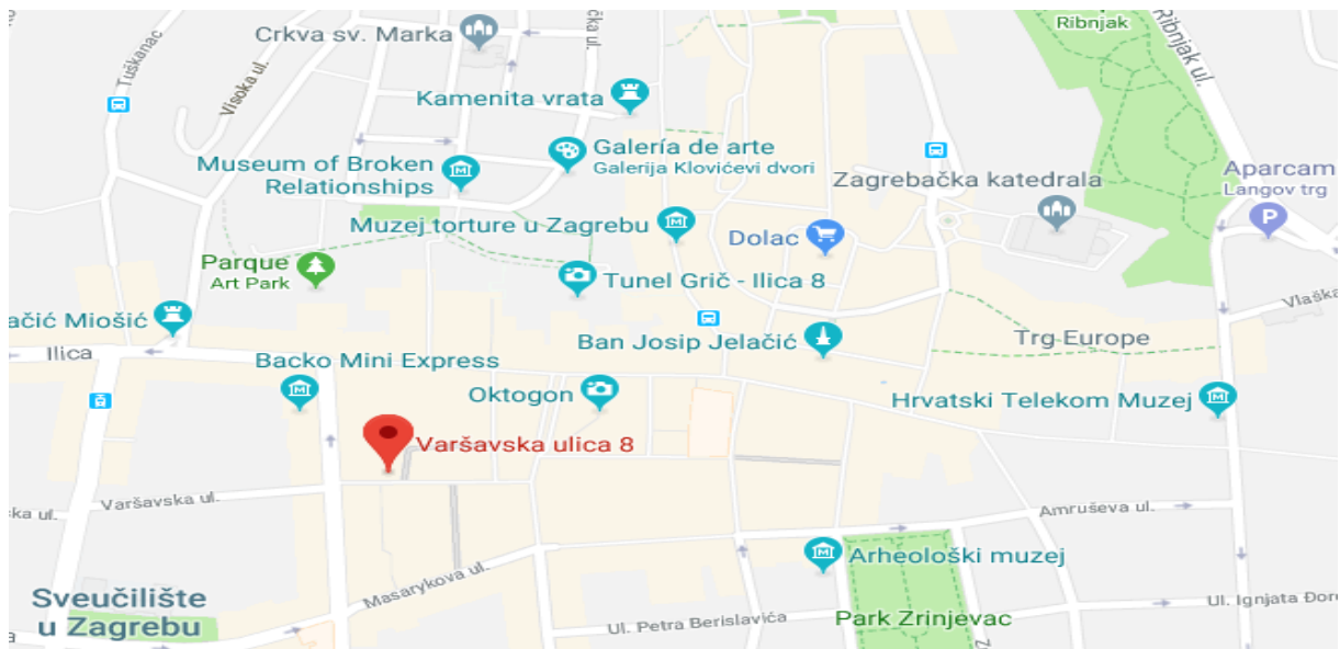
Slika 16: Lokacija

Lokacija ima važnu ulogu u poslovanju bilo kojeg poduzeća. Lokacija ovog primjera bit će u samom centru grada Zagreba, točnije u Varšavskoj ulici 8. Spomenuta lokacija je dostupna svima. U samoj blizini objekta nalazi se Cvjetni trg. Dakle protok ljudi je velik, pogotovo u ljetnoj sezoni. Na odabranoj lokaciji uređena je cjelokupna interna infrastruktura (struja, voda i kanalizacija). Prednost lokacije je da se nalazi u prometnom dijelu grada. Prostor ima 80 m 2 zatvorenog prostora koji je podijeljen na dvije zasebne prostorije od kojih je veća ona za kuhinju. Postoji i mali prostor za postavljanje stolica i stolova kako bi gosti mogli pojesti arepe u lokalu.