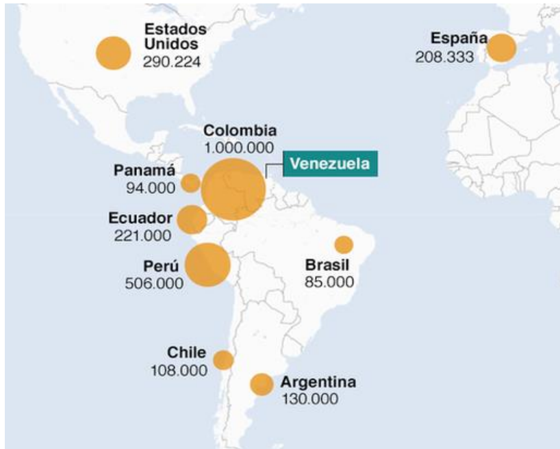
Slika 9: Glavna odredišta venezuelanskih migranata u 2018. godini

izbjeglica koji preplavljaju regiju. Zemlja je također postala međunarodni čvor kriminalnih aktivnosti. Najmanje dvanaest visokih dužnosnika, uključujući potpredsjednika Tarecka Al-Aissamija, proglašeni su međunarodnim vladarima narko-kartela“. 52