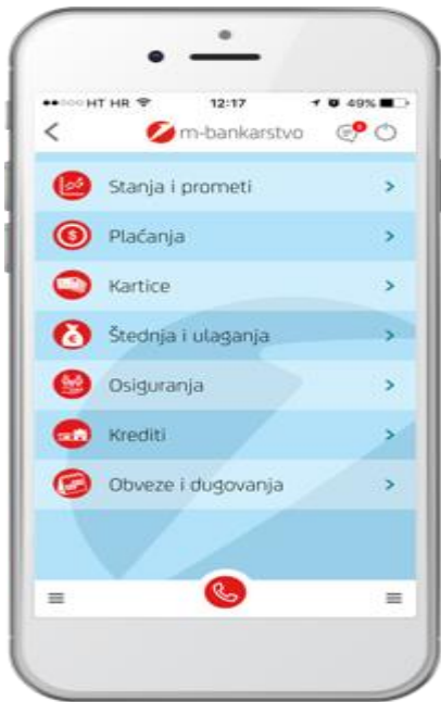
Slika 3: Početni ekran m-zaba, mobilnog bankarstva Zagrebačke banke

Nakon autorizacije putem PIN broja javlja se izbornik na kojem se izabire usluga koju klijent želi obaviti.