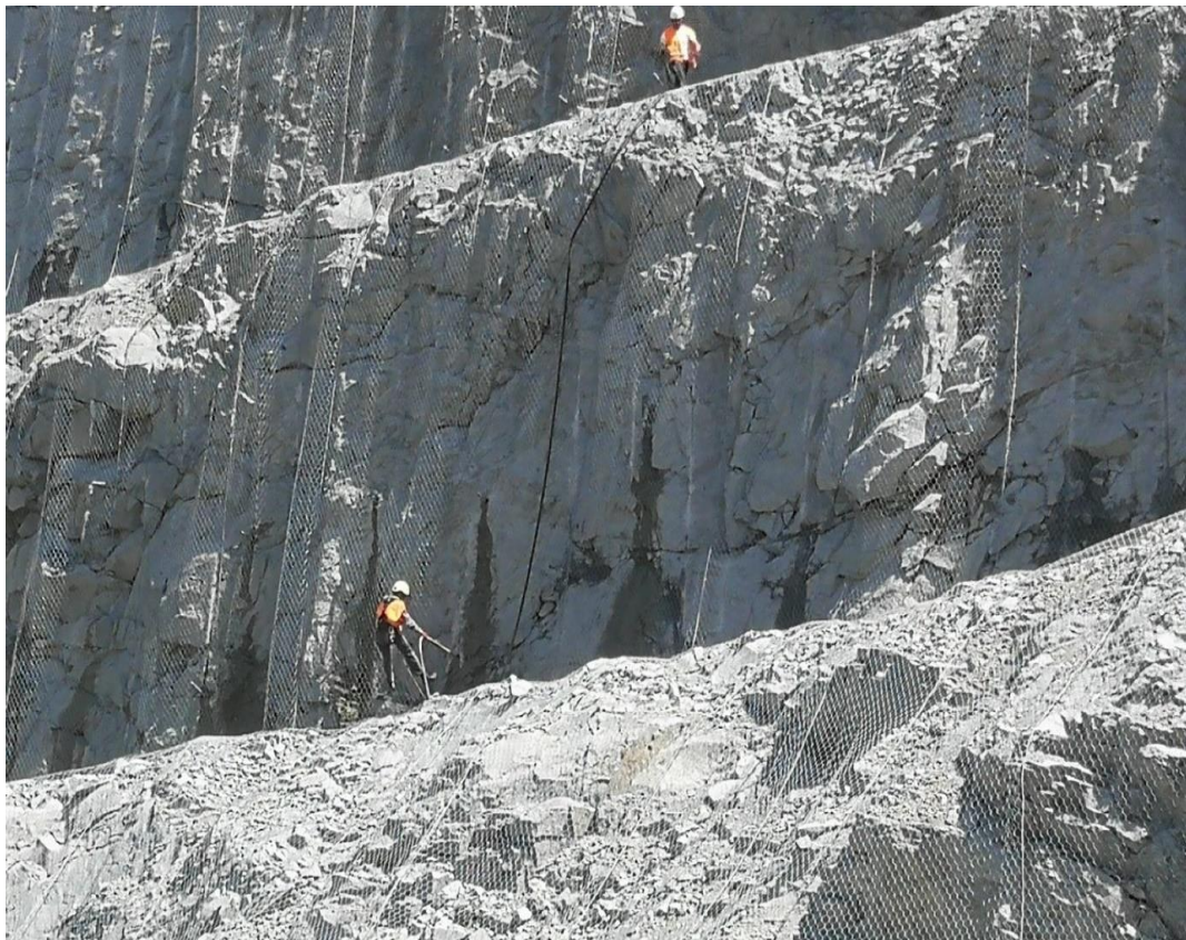
Slika 3. Izvođenje radova na kosini