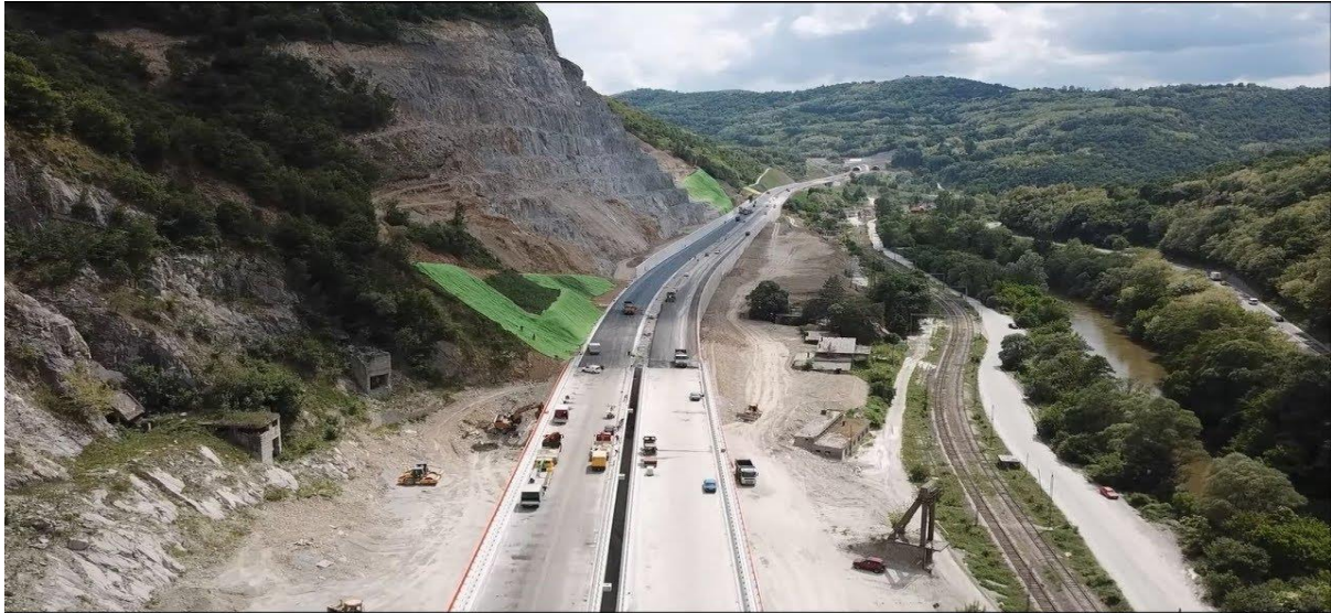
Slika 2. Autoput E - 75

E-75, dionica Caričina Dolina – Vladičin Han, poddionica Caričina Dolina – tunel „Manajle“, Republika Srbija, što je vidljivo na Slici 2.