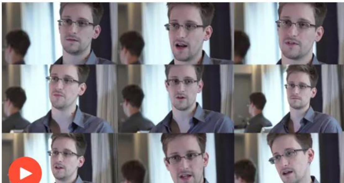
Slika 4. prvi intervju u lipnju 2013. za Guardian

The full story behind the scoop and why the whistleblower approached the Guardian