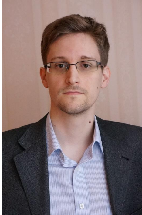
Slika 1. Edward Snowden

Reakcije javnosti iznenadile su čak i Snowdena. Ljudi su se na internetu masovno javljali i uglavnom izražavali podršku. Već se počeo širiti i masovni pokret: Vratimo na snagu Četvrti amandman. (Harding, 2014.)