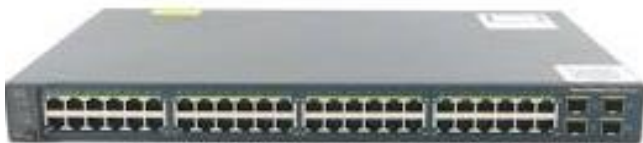
Slika 5 PoE Preklopnik

Preklopnik (engleski switch) je temelj današnjih komunikacijskih mreža. Glavna zadaća mu je kao i hub-u povezati računala. Međutim tu prestaje svaka sličnost. Preklopnik ponajprije prevladava probleme opisane u prethodnom poglavlju, tako da uređaji ne trebaju čekati na svoj red za slanje podataka, već je svim portovima omogućeno slanje podataka istovremeno. Isto tako promet nije vidljiv uređajima na svim portovima, već samo onima za koji je taj promet namijenjen. Stoga, da bi se dijagnostika mogla napraviti na preklopniku potreban je preklopnik koji ima funkciju zrcaljenja prometa na određeni port (engleski Port Mirroring). Na takvom portu se nalazi računalo na kojem onda pratimo promet sa portova koje smo uključili u zrcaljenje. Osim navedenog preklopnik može podržavati PoE, VLAN-ove, LLDP i još mnoge druge dodatne funkcije i protokole.