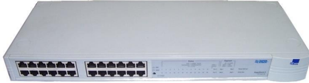
Slika 4 HUB

ostatkom mreže i zbog opisanog načina rada na računalu jednostavno pratimo sav promet koji prolazi hub-om. Hub nije upravljiv već ga se koristi takvog kakav je, odnosno na njemu se ne mogu programirati dodatne funkcije