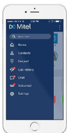
Slika 11 VoIP mobilna aplikacija

Pretstavlja aplikaciju koja se instalira na računalo ili pametnom telefonu i ima funkciju IP telefona. Ako se koristi na računalo potrebno je na istom imati mikrofoni i zvučnik ili slušalice sa mikrofonom. Kao i u slučaju IP telefona navedena klijentska aplikacija može koristiti neki od VoIP protokola, međutim u današnje vrijeme se koristi SIP gotovo bez iznimke.