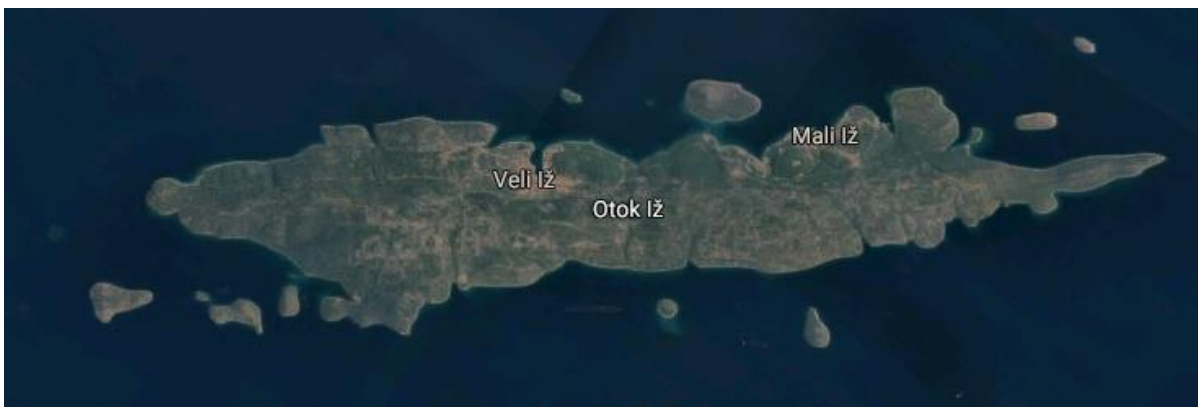
Slika 6 Karta otoka Iža 34

Otok Iž je smješten između Ugljana na istoku te Rave i Dugog otoka na zapadu. Površina mu je 16,5 km 2 . Dug je 12,3 km, širok do 2,6 km. Građen je od krednih vapnenaca i dolomita. Najviši vrh na otoku je Korinjak (168 m). Obala je duga 35,2 km. Okružuju ga brojni otočići: Beli, Fulija, Glurović, Knežak, Kudica, Mali, Mrtovnjak, Rutnjak, Sridnji i Temešnjak.