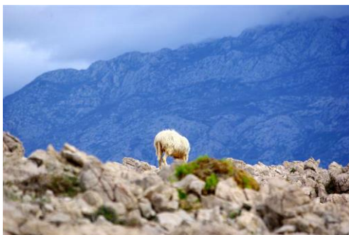
Slika 12 Paška ovca na paši 46

Među ključne autohtone prehrambene proizvode Zadarske županije spada i paška janjetina. Zbog načina uzgoja i ishrane, meso paške janjetine ima poseban okus te je svjetski gastronomi smatraju vrhunskim gastronomskim specijalitetom. Autohtona paška ovca hrani se na kršu i kamenjaru na kojem raste razno ljekovito bilje, sitna trava obasuta posolicom koju nanosi zimska bura te stoga ima specifičan i prepoznatljiv okus.