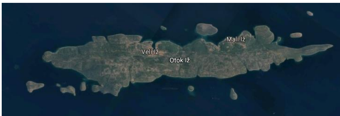
Slika 6 Karta otoka Iža 34

Otok Iž je smješten između Ugljana na istoku te Rave i Dugog otoka na zapadu. Površina mu je 16,5 km 2 . Dug je 12,3 km, širok do 2,6 km. Građen je od krednih vapnenaca i dolomita. Najviši vrh na otoku je Korinjak (168 m). Obala je duga 35,2 km. Okružuju ga brojni otočići: Beli, Fulija, Glurović, Knežak, Kudica, Mali, Mrtovnjak, Rutnjak, Sridnji i Temešnjak.