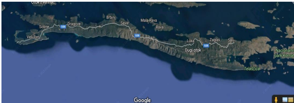
Slika 4 Karta Dugog otoka 27

Na istočnoj strani od otoka smješteni su brojni manji otoci (Sestrunj, Iž, Rava, Zverinac, Ugljan, Pašman, Žut i dr.). Građen je uglavnom od donjokrednih rudistnih vapnenaca i dolomita. Najviši vrh na otoku je Vela Straža (337 m) smješten u središnjem dijelu otoka. Tu se također nalaze i brojne špilje (Strašna peć, Kozja peć, Veli Badanj, Crvene rupe, Pećina).