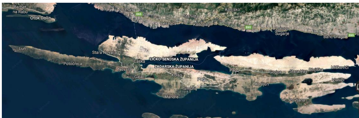
Slika 8 Karta otoka Paga 39

Klima na otoku je mediteranska. Veći dio otoka karakterizira kamenjar koji služi za ispašu koza i ovaca. Sačuvane su šume hrasta medunca i crnike, a na nekim dijelovima se zadržala autohtona zimzelena šikara. U poljima i udolinama (Dinjiško, Kolansko, Povljansko, i Vlašičko) uzgaja se vinova loza, maslina, žitarice, povrće, voće (smokva, badem, breskva). Nadalje, otok je poznat po ovčarstvu i proizvodnji sira, kućnoj radinosti (čipkarstvo) te proizvodnji soli (solane). Mostom kod Posedarja te trajektnim vezama povezan je s kopnom (Žigljen–Prizna) te otokom Rabom. Na otoku se posljednjih desetljeća snažnije razvija turizam. Uz gradove Pag i Novalju veća su naselja: Mandre, Povljana, Kolan, Lun, Stara Novalja, Vlašići i Metajna.