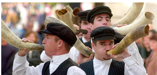
Slika 5 Saljska Tovareća mužika 33

S ciljem daljnjeg održivog razvoja obje gospodarske grane - turizma i ribarstva - potrebno je intenzivnije uključivanje marikulture u turističku ponudu. To može biti putem aktivnog uključivanja turista u djelatnost ribarstva i marikulture – otvaranje muzeja i interpretacijskih