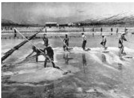
Slika 10 Berba soli na na Pagu 42

Paške solane spadaju u najstarije na istočnoj jadranskoj obali. Na Pagu se još uvijek može vidjeti proizvodnja soli starim postupkom prirodnog isparavanja u manjim glinenastim bazenima. Na otoku je bilo više solana do dolaska Venecije 1409. (Dinjiška, Povljana, Vlašići, Stara Novalja) kada u funkciji ostaje samo solana na Pagu. Venecija je uzimala 70% cjelokupne proizvodnje soli, a preostalih 30% dijelili su vlasnici solana i radnici u solanama, u omjeru svakom 50%. Venecija nije nikada bila vlasnik solane. Vlasnici solana bili su uglavnom zadarski (i paški plemići), ženski benediktinski samostan i crkva. Nakon propasti Mletačke republike dolazi Austrija koja je detaljno popisala solane i izradila katastarske planove. Nakon 8 godina vladavine Austrije ovo područje, na kratko, ulazi u sastav Napoleonovih Ilirskih provincija. Tada nastaje i ideja da se otkupe sve solane, ali nije provedena zbog propasti Napoleona. Povratkom Austrije realizira se ideja otkupa privatnih solana. Stvara se državni monopol koji je donosio veći prihod, ali od njega radnici nisu imali veće koristi te dolazi i do prvih štrajkova. U vrijeme Jugoslavije solana ostaje državno vlasništvo, a nakon nastanka današnje Republike Hrvatske, solana je privatizirana.