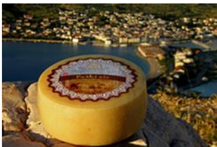
Slika 11 Paški sir 44

Danas se Paški sir može kušati i kupiti u domaćinstvima koja se bave proizvodnjom sira ili u nekoj od poznatih sirana na otoku (npr. Paška sirana d.d., Sirana Gligora, MIH Sirana,) koje su spojile tradiciju i tehnologiju te otvorile vrata posjetiteljima. Npr. Sirana Gligora za svoje posjetitelje organizira prezentaciju sirane (priča o Paškom siru), razgledaju proizvodnju, posjećuju zrionicu sira koja je smještena 6m pod zemljom, kušaju sireve te mogu obaviti kupnju u trgovini sirane u Kolanu. Sir MIH Sirane iz Kolana nositelj je oznake „Hrvatski otočni proizvod“. Paški sir je nositelj oznake „Izvorno Hrvatsko“. 45