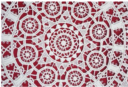
Slika 9 Paška čipka 41

Mjesto gdje su paške koludrice od davnina podučavale žensku djecu u pismenosti i izradi čipaka je samostan sv. Margarite. O tome svjedoče arhivski izvori iz 1579. godine. O njejoj ljepoti i savršenstvu pročulo se nadaleko pa su Paškinje pozivane u Beč kod nadvojvotkinje Marije Jozefe, carice majke, kako bi pokazale kako nastaje paška čipka. Izrada paške čipke pojačava se nakon osnivanja Čipkarske škole u Pagu koja je osnovana 1906. godine te je radila do 1945. godine.