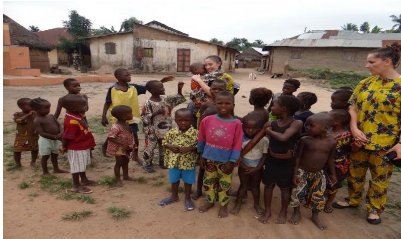
Slika 8 Upoznavanje s stanovnicima Benina

Dragica Milinović: Pitanje siromaštva u kontekstu poslovne etike s osvrtom na problematiziranje kvalitete života državljana Benina (završni stručni rad)