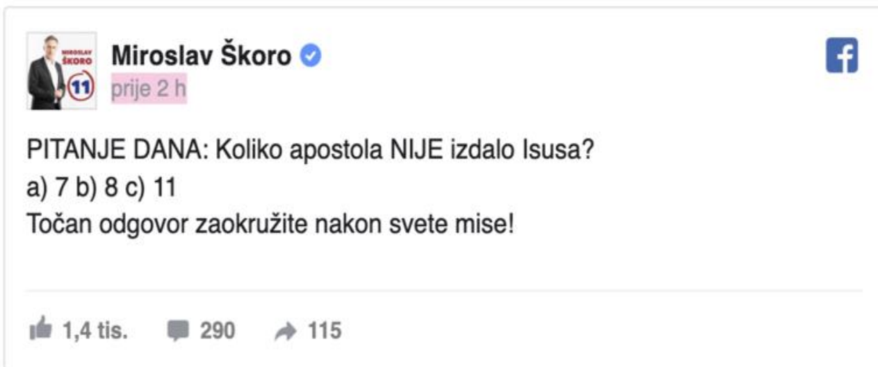
Slika 3 Miroslav Škoro prekršio predizbornu šutnju

U svojoj Facebook kampanji Miroslav Škoro je koristio i nekoliko zabavnih video skečeva na temelju svoje uloge iz emisije Večernja Školagdje je Željko Pervan na duhovit način komentirao njegovo gostovanje u emisijama Bujica i Nedjeljom u 2. S vremenom je broj pratitelja njegove službene stranice sve više rastao, a prava ekspanzija broja pratitelja dogodila se nakon predsjedničkog skupa u K. D. Vatroslava Lisinskog. Navedeni predsjednički skup nije služio samo kao događaj u kojem on govori i obraća se svojim potencijalnim biračima, nego i kao odlična prilika za prikupljanje materijala za objave na društvenim mrežama što potvrđuje činjenica da je nakon skupa započela promjena orijentiranosti na mlade ljude u Zagrebu od 18 do 30 godina, dok je do tada fokus bio usmjeren na Slavoniju i njezino stanovništvo starije od 40 godina. Miroslav Škoro često se služio live stream video prijenosima u kojima je komunicirao sa svojim narodom i odgovarao na njihova pitanja. Također, svi veći predizborni skupovi, uključujući i onaj u Lisinskom, bili su preneseni uživo putem Facebook video streama.