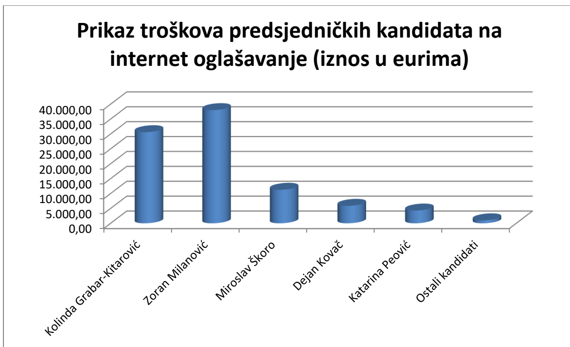
Grafikon 2 Budžet predsjedničkih kandidata na internet kampanju (Samostalni rad autora)

Iz prethodno navedenog grafikona jasno se može vidjeti koliko su predsjednički kandidati u prvom krugu izbora za predsjednika Republike Hrvatske uložili novaca u suvremeno internet oglašavanje. Prema velikoj analizi digitalne kampanje predsjedničkih kandidata koja je provedena 21.12.2019. godine možemo zaključiti kako je većina predsjedničkih kandidata imala dobar budžet za provedbu online kampanje. U digitalnu kampanju najviše je uložio Zoran Milanović s potrošenih 37.992,00 eura, nakon njega slijedi Kolinda Grabar-Kitarović koja je potrošila 30.582,00 eura, Miroslav Škoro uložio je 11.247,00 eura, Dejan kovač uložio je 5.860,00 eura. a Katarina Peović 4.279,00 eura dok su ostali predsjednički kandidati uložili 1.000,00 eura ili manje od toga. Izvor navedenih podataka su Facebook galerija oglasa i Google izvješće o transparentnosti. zanimljivo je kako predsjednički kandidat Dario Juričan nije uložio mnogo sredstava u bilo koji oblik oglašavanja, ali je od informativnog portala Index.hr dobio medijski prostor u vrijednosti 200.000,00 kuna potpuno besplatno.