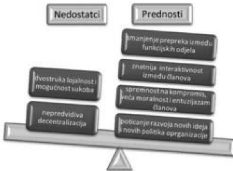
Slika 2 Prednosti i nedostaci timske organizacije