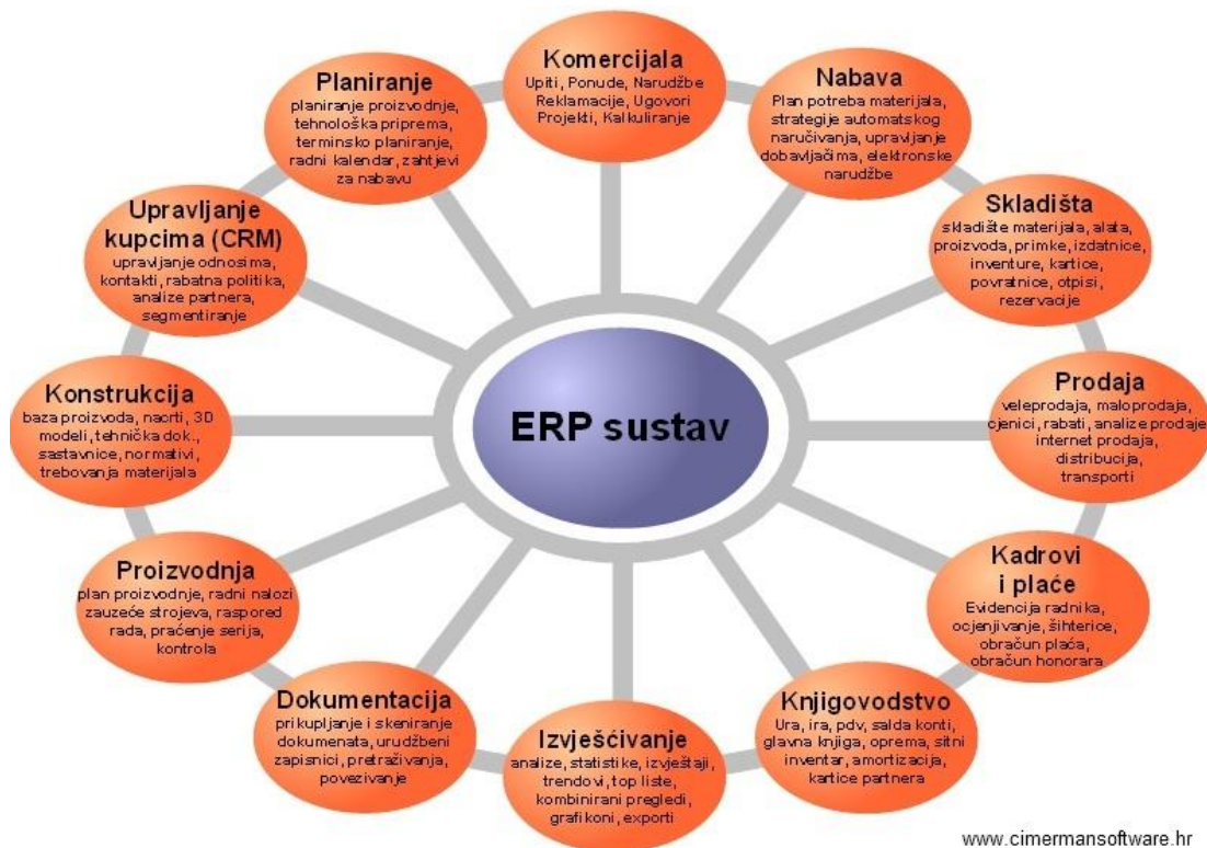
Slika 2: Struktura ERP sustava 18