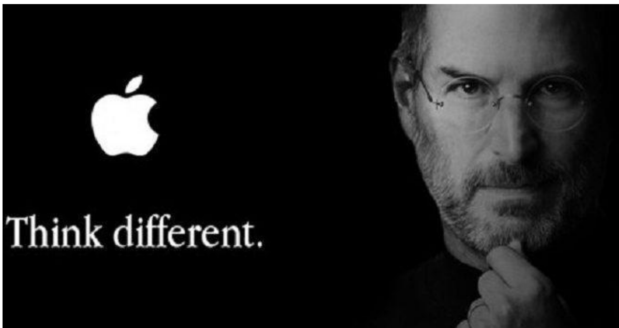
Slika 6.2.1 Prikaz Steve Jobsa

Čovjek koga su istjerali iz vlastite kompanije koju je osnovao, da bi se nakon što je Apple bio pred bankrotom vratio natrag na čelo firme, i u četrnaest godina njegove vladavine od posrnule kompanije pretvorio je u najvredniju kompaniju na svijetu.