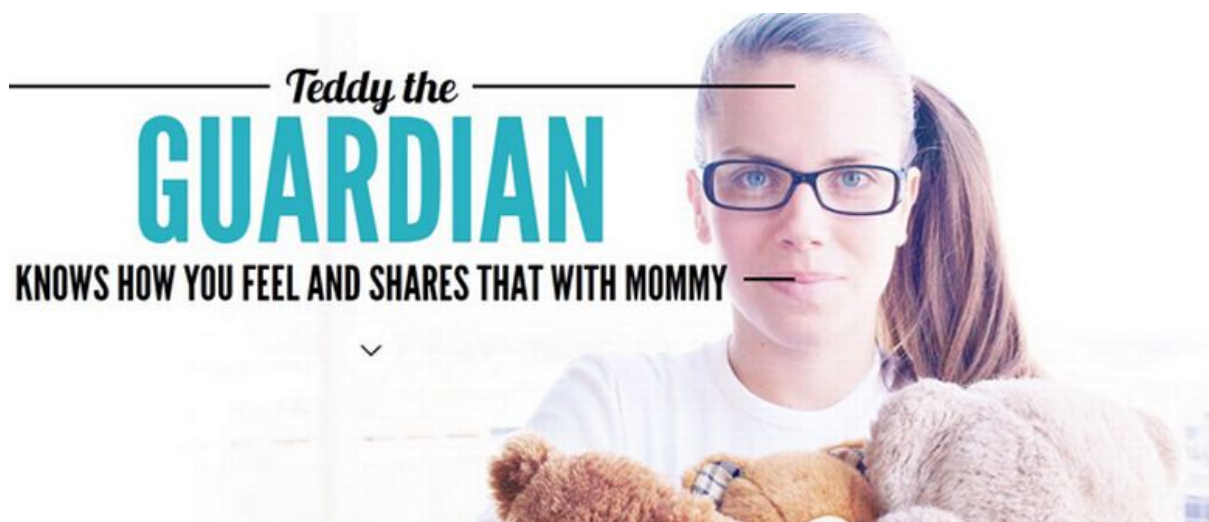
Slika 2. Plišani medvjedić poznatiji pod imenom „Teddy The Guardian