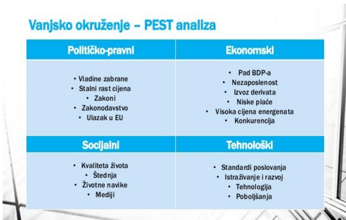
Slika 2: PEST analiza