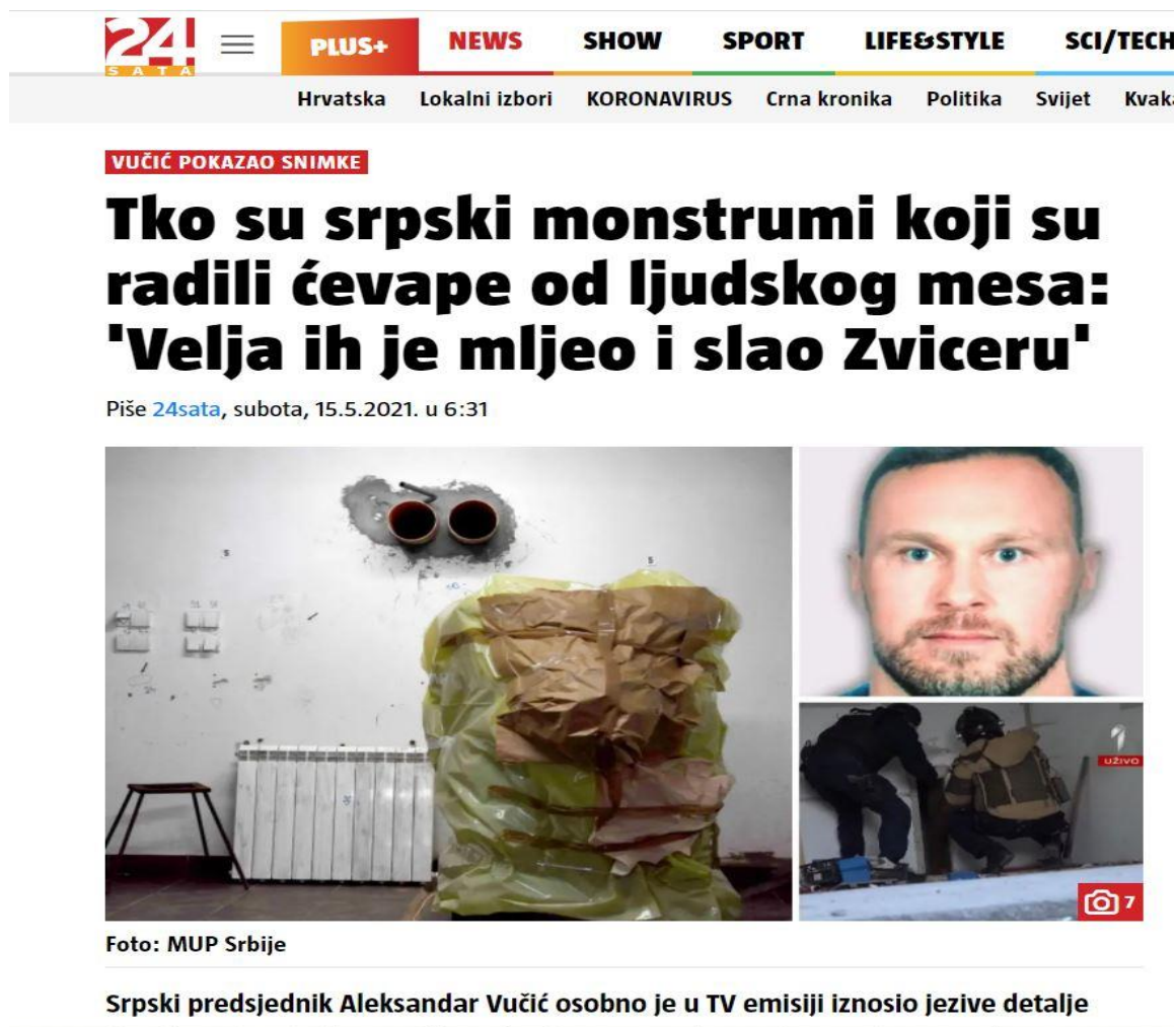
Fotografija 2. Snimka zaslona članka na portalu 24sata.hr, (18.5.2021)

U promatranom razdoblju mediji u kojima se provelo istraživanje pisali su i o više prometnih nesreća, između ostalog u jednoj 24sata.hr koristi glagol „pokosio“ 61 govoreći o naletu automobila na dvojicu pješaka, u kojima se kao posebno negativan primjer izvještavanja ističu članci o prometnoj nesreći, za čije se izazivanje sumnjiči mladić od 18 godina koji je, prema istrazi, automobilom upravljao pod utjecajem alkohola, a koja za posljedicu ima smrt njegova suvozača. U naslovima su prevladavali podaci o tome da nije imao vozačku dozvolu, vožnja pod utjecajem alkohola, smrt suvozača te prijašnje kažnjavanje zbog vožnje prije stjecanja