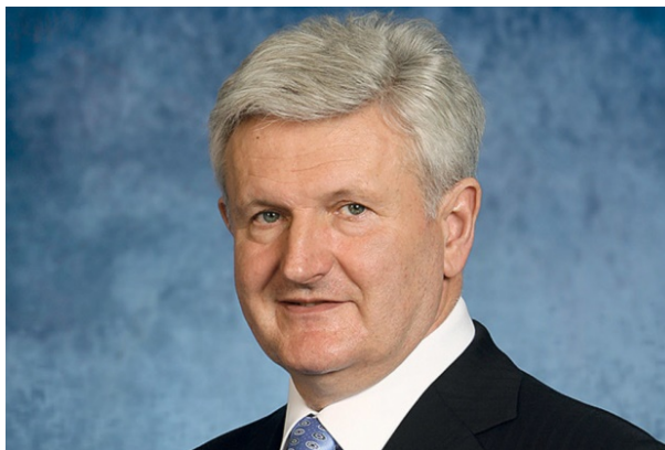
Slika 7. Ivo Todorović bivši predsjednik Uprave koncerna Agrokor