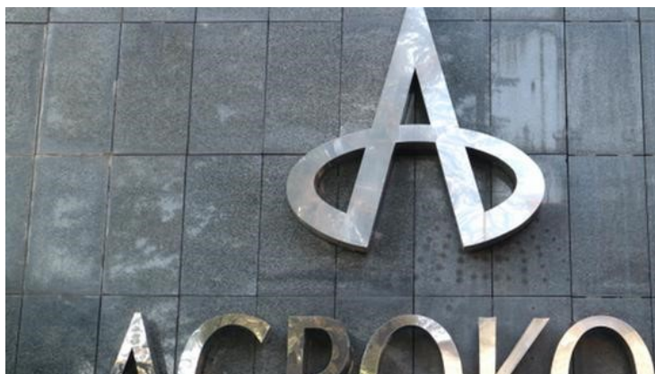
Slika 6. Logo Agrokora

Inače, osim Todorića, u aferi Agrokor osumnjičeno je još 14 osoba, među kojima su i njegovi sinovi Ivan i Ante te zet Hrvoje Balent. Osim njih četvorice, pod istragom su još Tomislav Lučić, Ljerka Puljić, Damir Kuštrak, Piruška Canjuga, Ivan Crnjac, Mislav Galić, Alojzije Pandžić, Olivio Discordia, Sanja Hrštić, Marijan Alagušić i Ivica Sertić. Sumnjiči ih se za niz zloporaba kojima je Agrokor oštećen za oko 1,1 milijardu kuna, a među krimenima koji im se stavljaju na teret su i namještanje financijskih izvješća Agrokora, davanje protuzakonitih zajmova, izvlačenje novca... Sve te kritike u proteklih godinu dana Ivica Todorić negirao je člancima na svojem blogu uporno navodeći da je žrtva političkog izгона.“ Ivica Todorić je 20.11.2018. godine, nakon namirene jamčevine od 7,5 milijuna kuna, pušten na slobodu uz sudske mjere opreza i uz priopćenje: "Izaći ću na izbore i osvojiti vlast. Pokrenut ću Hrvatsku na pravi način." 6