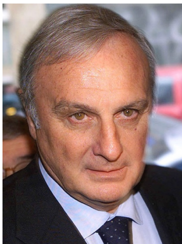
Slika 5. Calisto Tanzi bivši vlasnik kompanije „Parmalat“

tvrtka Lactalis, koja je danas posjednik i zagrebačkog Dukata. „Parmalat“ danas radi na tržištima 24 države, s godišnjim dohotkom većim od šest milijarda eura i više od 27 tisuća djelatnika. 5