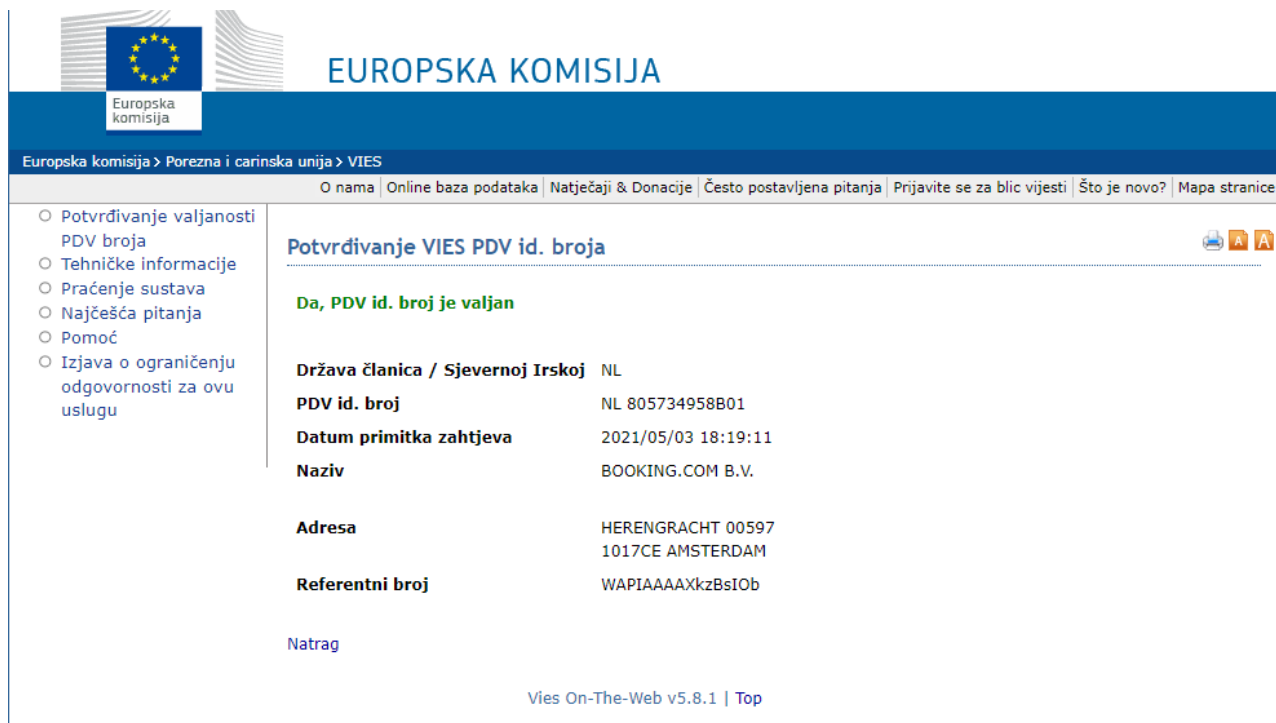
Slika 1. VIES baza podataka

Radi zajedničke kontrole i međunarodnog poslovanja postoji i baza podataka svih poreznih obveznika koji su registrirani u ovoj bazi podataka. Znači svaka isporuka i stjecanje dobara unutra Europske unije regulirani su zakonom da ne bi dolazilo do dvostrukog oporezivanja roba ili usluga.