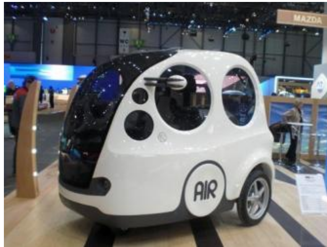
Slika 5. Automobil na potisnuti zrak

5. Automobili na potisnuti zrak i drugi – automobili na potisnuti zrak, vozila s upravljačem (skuteri, električni bicikli, romobili...) i vozila s tekućim nitrogenom još manje zagađuju okolinu nego električni automobili jer sve komponente mogu biti izgrađene bez zagađivanja okoliša. Solarne utrke automobila su održavane na regularnoj bazi kako bi se promovirala ideja o zelenim vozilima i ostale zelene tehnologije.