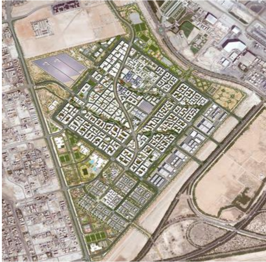
Slika 1. Arhitektonski prikaz grada Masdar