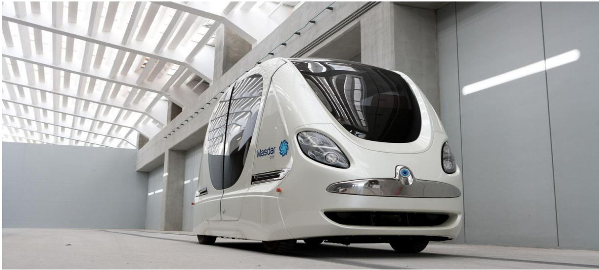
Slika 2. Autonomno vozilo PRT sustava