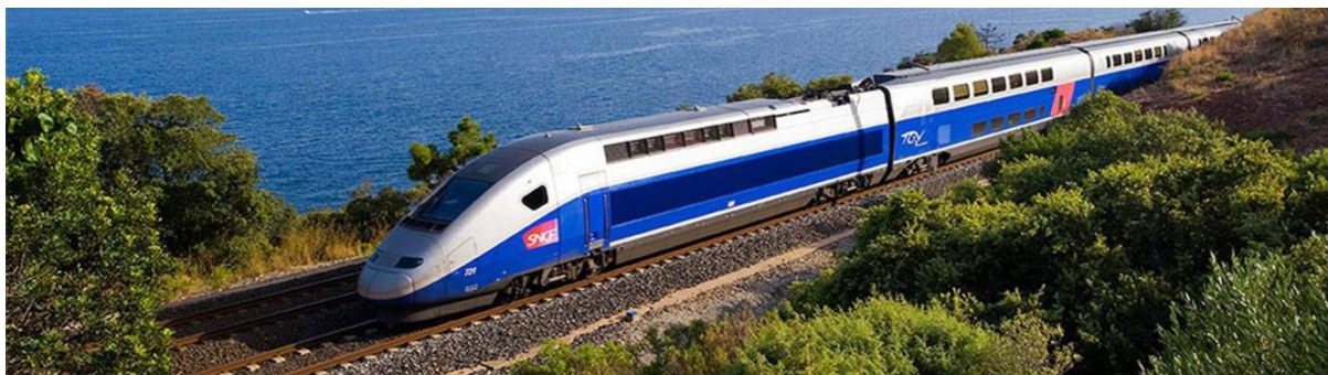
Slika 3. Francuski TGV vlak