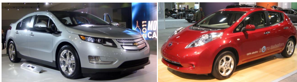
Slika 4. Chevrolet Volt „plug-in“ hibrid i Nissan Leaf električni automobil

3. Električna vozila i vozila s gorivnim ćelijama – ova vrsta vozila sa smanjenom potrošnjom petroleja uključuje električne automobile, „plug-in“ hibride i hidrogene automobile s gorivnim ćelijama. Električni automobili su tipično efikasniji nego automobili s gorivnim ćelijama te imaju bolju ekonomiju goriva nego konvencionalna vozila s motorima s unutarnjim izgaranjem ali su ograničeni dometom zbog pražnjenja baterije. Smanjuju emisiju ugljika do čak 99%.