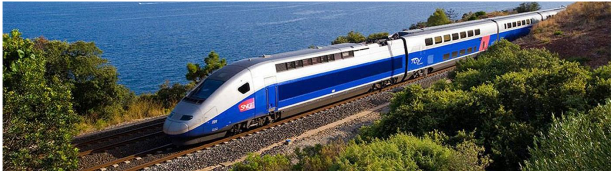
Slika 3. Francuski TGV vlak