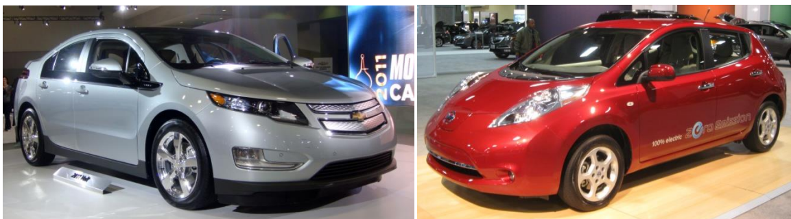
Slika 4. Chevrolet Volt „plug-in“ hibrid i Nissan Leaf električni automobil

3. Električna vozila i vozila s gorivnim ćelijama – ova vrsta vozila sa smanjenom potrošnjom petroleja uključuje električne automobile, „plug-in“ hibride i hidrogene automobile s gorivnim ćelijama. Električni automobili su tipično efikasniji nego automobili s gorivnim ćelijama te imaju bolju ekonomiju goriva nego konvencionalna vozila s motorima s unutarnjim izgaranjem ali su ograničeni dometom zbog pražnjenja baterije. Smanjuju emisiju ugljika do čak 99%.