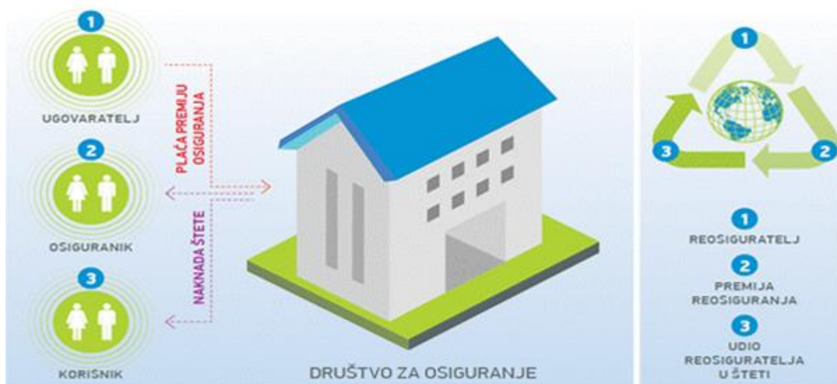
Slika 3. Kako funkcionira osiguranje?

Kao što je već nekoliko puta navedeno, društva za osiguranja prikupljaju sredstva od svojih osiguranika. Plaćanje premije osiguranja glavna je obveza ugovaratelja osiguranja. Plaćanje premije osiguranja regulirano je Zakonom o osiguranju, ali treba napomenuti da obveza osiguratelja postoji prema svakom osiguraniku pojedinačno i u slučaju kada ugovaratelj osiguranja nije uplatio premiju u predviđenom roku, ako nesretni slučaj nastane za vrijeme trajanja osiguranja. (Matijević B., 2010.) Za korisnika osiguranja, visina premije je izuzetno bitna. To znači ako je iznos premije pristupačniji klijentu samim time će i društva za osiguranje bilježiti rast. Na temelju toga se može zaključiti da bez korisnika, osiguranja ne mogu uspjeti i bilježiti rast, jer je prvenstveno njihov cilj pružiti zaštitu korisnicima te u trenutku nastanka osiguranog slučaja isplatiti osigurninu.