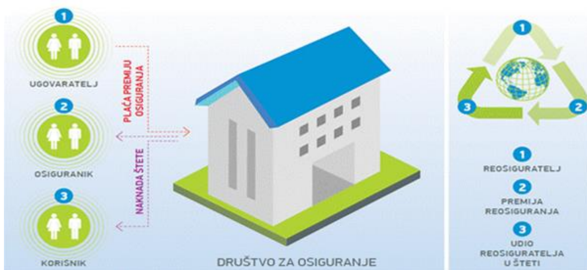
Slika 3. Kako funkcionira osiguranje?

Kao što je već nekoliko puta navedeno, društva za osiguranja prikupljaju sredstva od svojih osiguranika. Plaćanje premije osiguranja glavna je obveza ugovaratelja osiguranja. Plaćanje premije osiguranja regulirano je Zakonom o osiguranju, ali treba napomenuti da obveza osiguratelja postoji prema svakom osiguraniku pojedinačno i u slučaju kada ugovaratelj osiguranja nije uplatio premiju u predviđenom roku, ako nesretni slučaj nastane za vrijeme trajanja osiguranja. (Matijević B., 2010.) Za korisnika osiguranja, visina premije je izuzetno bitna. To znači ako je iznos premije pristupačniji klijentu samim time će i društva za osiguranje bilježiti rast. Na temelju toga se može zaključiti da bez korisnika, osiguranja ne mogu uspjeti i bilježiti rast, jer je prvenstveno njihov cilj pružiti zaštitu korisnicima te u trenutku nastanka osiguranog slučaja isplatiti osigurninu.