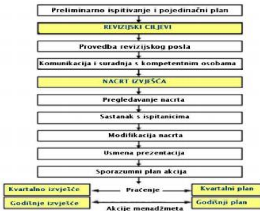
Slika 2. Proces izvješćivanja internog revizora

Nakon prikupljanja informacija i dokumentacije slijedi sastavljanje internog izvješća. Izvješće internog revizora smatra se konačnim rezultatom ili proizvodom cjelokupnog procesa interne revizije.