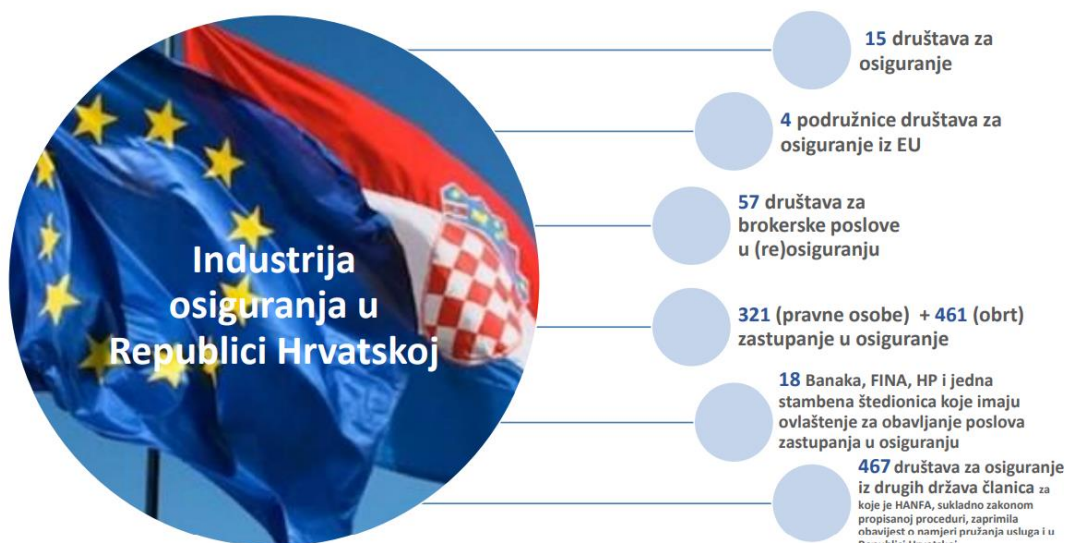
Slika 4. Industrija osiguranja u Republici Hrvatskoj

Društva za osiguranje koja se bave obveznim osiguranjima u prometu moraju biti članovi Hrvatskog ureda za osiguranje. 5