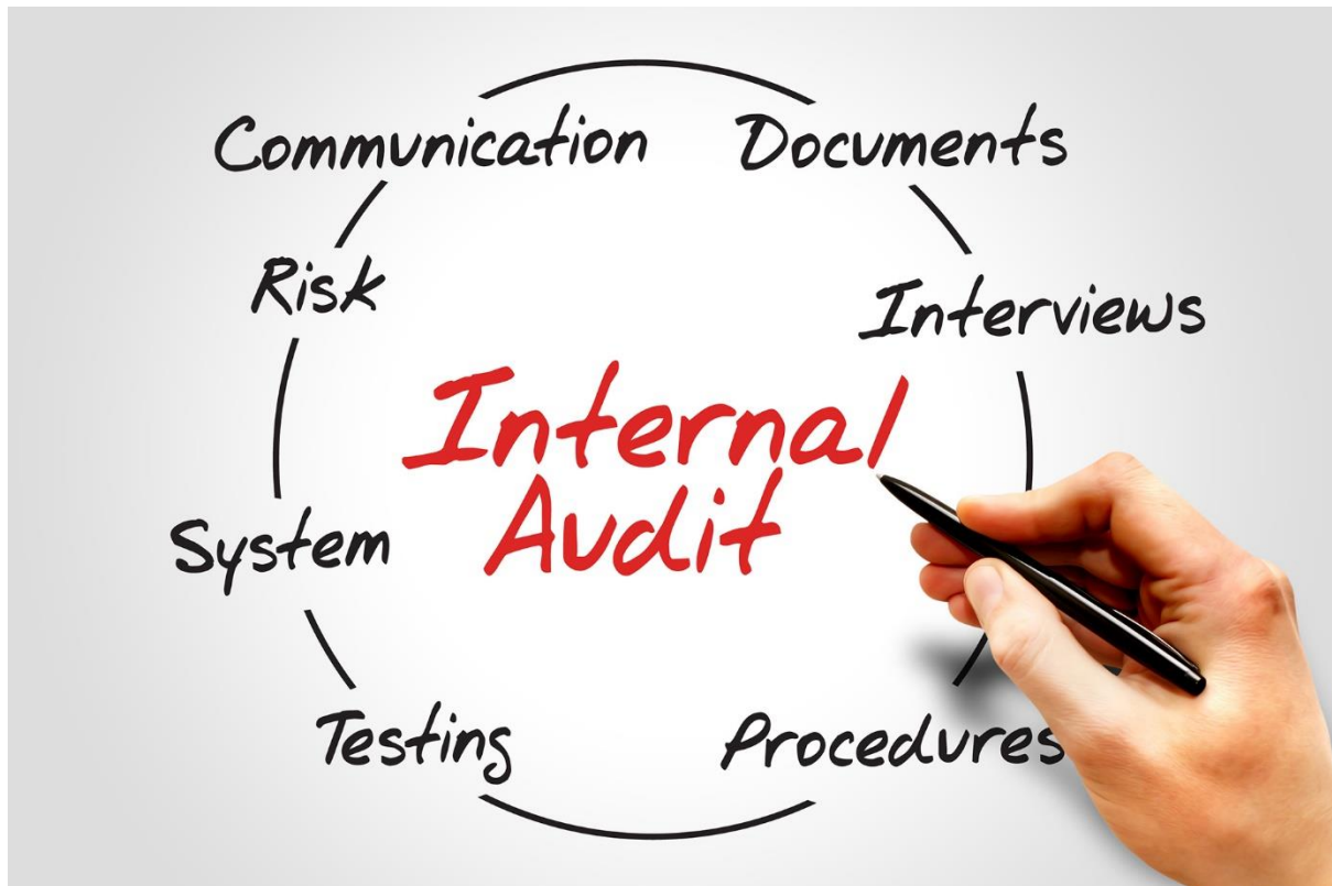
Slika 1. Interna revizija