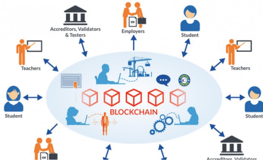
Slika 2. 20. načina transformacije blockchaina

nadzornog sustava kao što je oblak, vjerojatnost da cijeli sustav IoT bude oštećen ili zaustavljen je zanemariva. To osigurava kontinuitet, jednostavnost operacija, robusnost, stabilnost i sigurnost uz vrlo niske troškove. Moguć je razvoj još mnogih drugih obećavajućih i revolucionarnih razvojnih postignuća u IoT koja se mogu ostvariti pomoću tehnologije blockchaina.