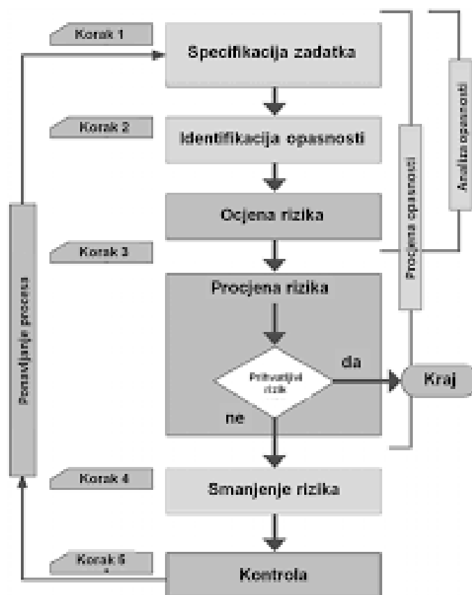
Slika 2 Metodologija procjene i smanjenja rizika

Procjena rizika je temeljni dokument iz područja zaštite na radu. To je proces procjene rizika za sigurnost i zdravlje radnik od opasnosti na radu. To je sustavno ispitivanje svih aspekata rada kojim se razmatra koji je uzrok ozljede ili štete, mogu li se otkloniti opasnosti i što u slučaju kad se opasnosti ne mogu otkloniti te koje preventivne radnje postoje ili bi se trebale uvrstiti u svrhu kontrole rizika. Procjena rizika se definira za svako radno mjesto unutar neke tvrtke pri čemu se rizik procjenjuje za pojedino radno mjesto kao mali, srednji ili veliki prema općim kriterijima razine rizika (vjerojatnost, posljedica). Prema njoj poslodavac poduzima sve mjere sprječavanja ili smanjenja rizika za svako radno mjesto.