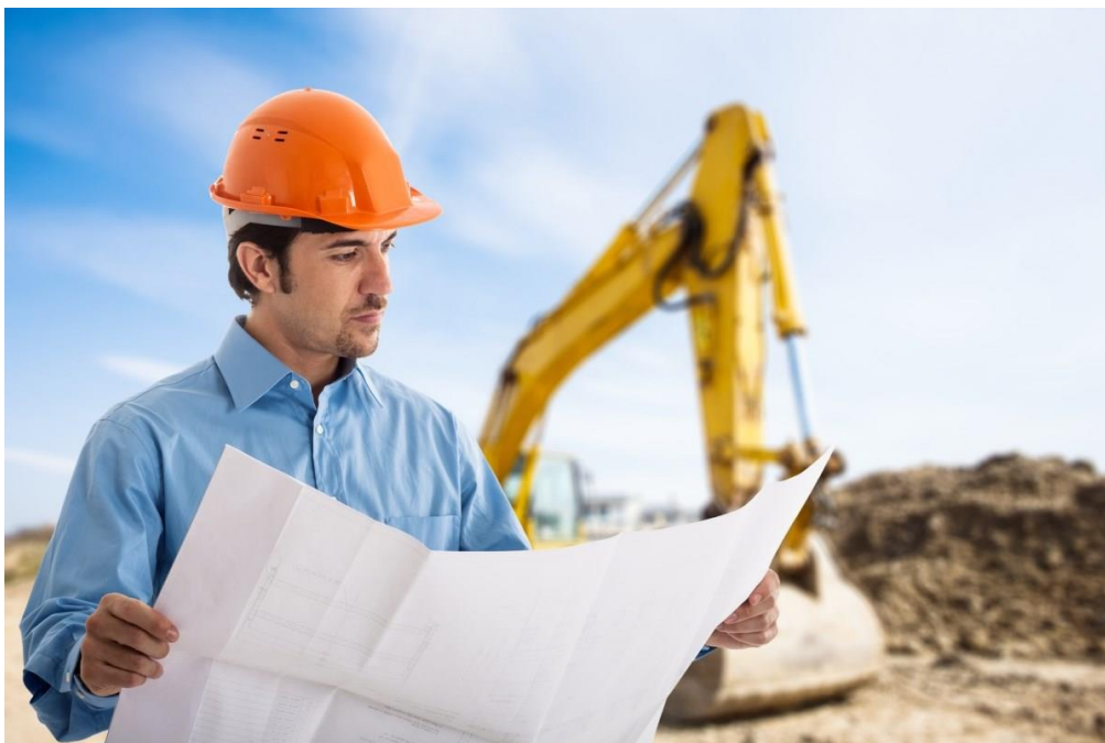
Slika 1 Prikaz radnika na radnom mjestu

Postoje različiti načini ostvarivanja rada. Rad u radnom odnosu je temelj prava. Uz rad nastaju brojna prava, obveze i odgovornosti kako za poslodavca tako i za radnika. Radno mjesto definira poslodavac, a od radnika se očekuje da radne dužnosti obavlja stručno, kvalitetno i pravodobno.