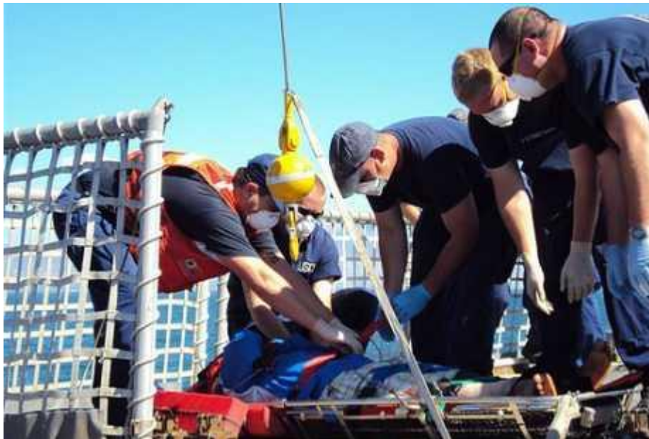
Slika 5 Ozljeda na radu

Unesrećena osoba ili poslodavac podnose prijavu za priznavanje ozljede ili bolesti na radu regionalnom uredu odnosno područnoj službi Hrvatskog zavoda za zdravstveno osiguranje nadležnom prema mjestu prebivališta. U slučaju da poslodavac ne podnese prijavu o ozljedi na radu, tada izabrani doktor unesrećene osobe mora podnijeti prijavu. Prijava se mora podnijeti 8 dana od nastale ozljede.