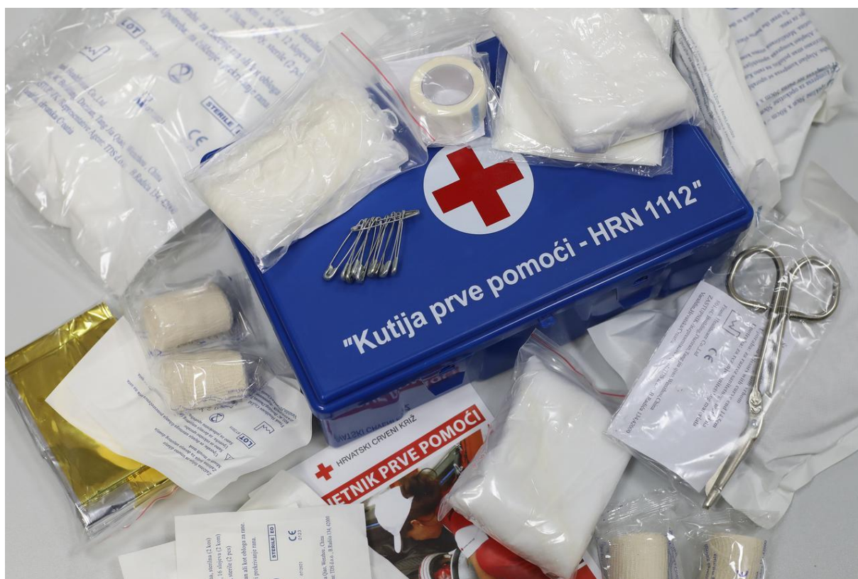
Slika 6 Kutija prve pomoći