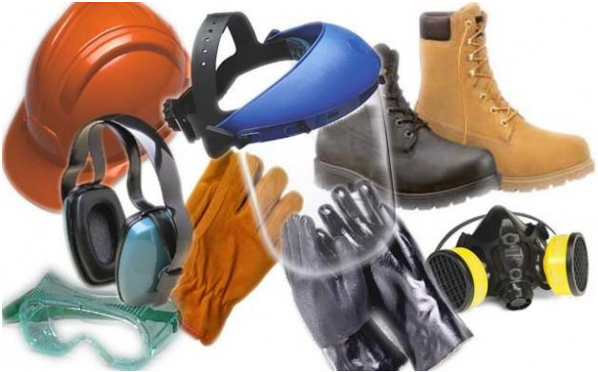
Slika 4 Osobna zaštitna oprema