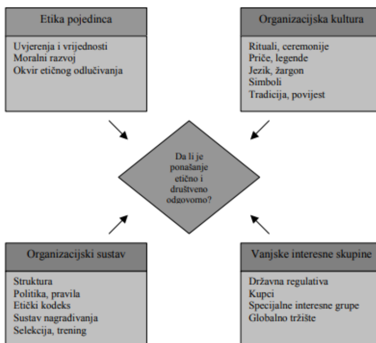
Slika 1. Faktori koji utječu na etično ponašanje organizacije